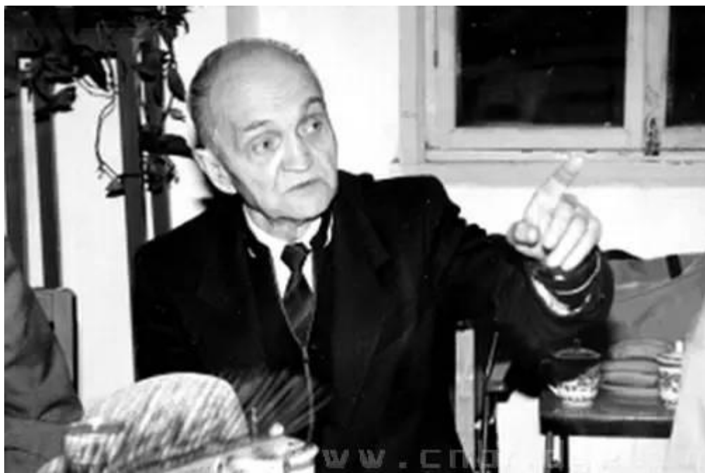
（图为康斯坦丁·西林）