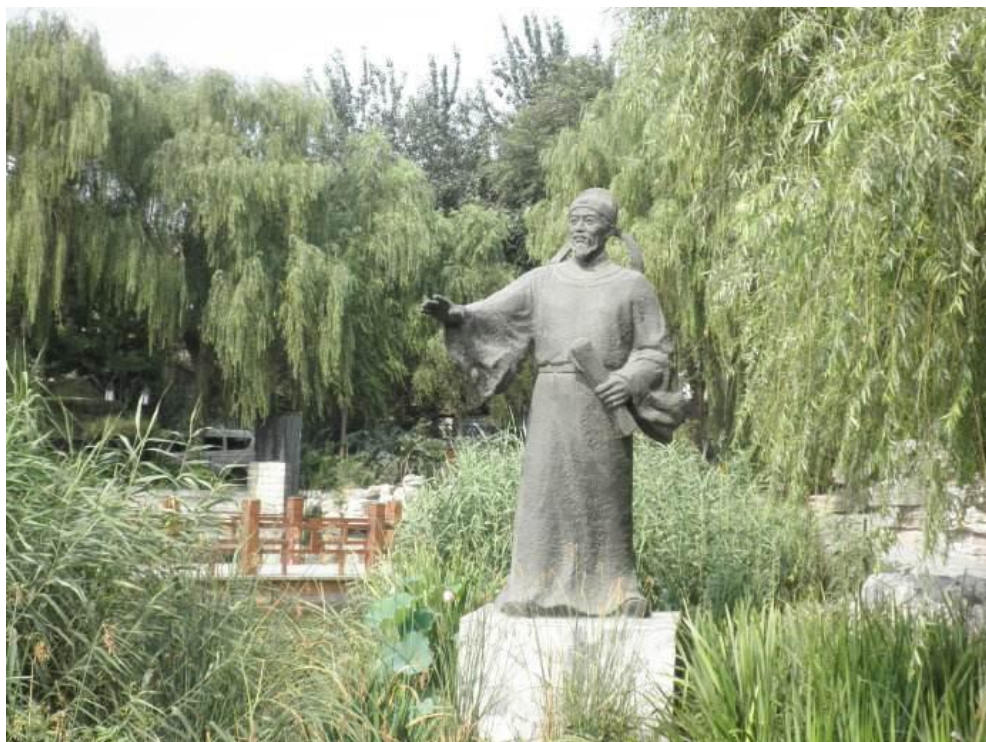
（图为汇通祠郭守敬像）

新中国成立后，党和政府十分重视保证供水这个民生大计。竭尽全力开发水源，先后修建了十三陵水库，官厅水库，密云水库等重大水利工程，大力开发南水北调工程，作出了不懈的努力。但这种环境治理，只靠政府出力是不够的，在清淤，排污，节水等许多方面。都离不开广大民众的配合。因此我们都要以郭守敬为榜样，学习传承他为造福社会，不辞辛苦的精神，为保障社会环境，作出自己力所能及的奉献。