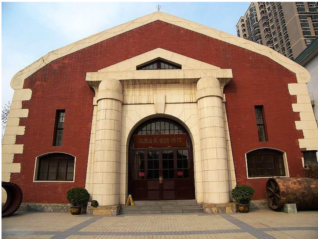
（北京市自来水博物馆）

里，迅速上升到至今管网总长度 7065 公里。市自来水集团拥有水厂 18 座，日供水能力 268 万立方米，供水服务面积 600 多平方公里，市区自来水普及率达到了 100%。