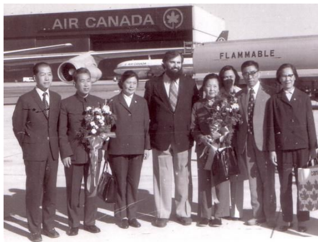
1977年5月，丁雪松率上海芭蕾舞团到加拿大访问。右四为丁雪松，左一为笔者

丁雪松同志，坚持原则，工作勤奋，性情宽厚，她是一位不可多得的领导干部。她于晚年，当记者采访她时，她曾说，她一生有三个意外：第一个是1949年建国前夕担任新华社驻朝鲜平壤分社社长；第二个是1964年任国务院外事办公室秘书长；第三个就是粉碎“四人帮”以后出国当首任女大使。她于2011年5月去世，享年93岁。