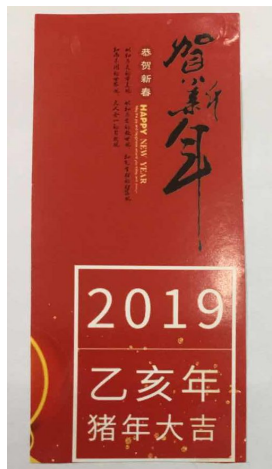
（文中提到的挂历一角）

印有“2019年，乙亥年，猪年大吉”的挂历勾起我上面絮叨的这番话。2019年是己亥年，与猪相关。既然如此，就顺便插些题外话，说说猪。在古代，猪被称为豕(shǐ)，还被称为彘(zhì)、豨(xī)、刚鬣(liè)，又名印忠、汤盎。其俗名是黑面郎、黑爷。这种动物是人类饲养的六畜（见儿童启蒙读物《三字经》：“马牛羊、鸡犬豕，此六畜，人所饲。”）之一。它在多数国人日常生活中扮演着不小的角色，是以农为生者的财富象征，“肥猪满圈”是过去农村殷实人家的标志，猪的肥瘦是衡量庄户人家勤快或懒惰的标准之一。篆刻大家方去疾刻过一方印：“人懒猪不胖”（见图）。对于食肉者（穆斯林除外）来说，除了猪毛和蹄甲，猪身上的东西几乎都可入口。在我们国