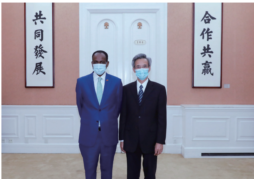
林松添会长与特肖梅·托加大使合影留念。

林松添说，非洲自然和人力资源丰富，是最年轻、最富活力、最有希望的大陆，已经并正在崛起，