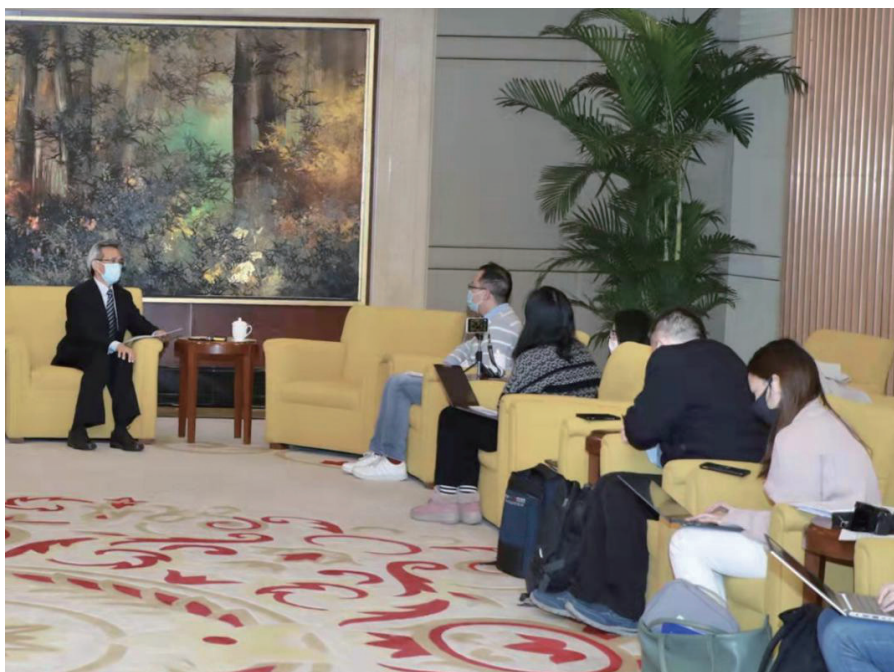
林松添会长接受媒体采访。

最近，在北京冬奥会期间或赛场上，中美运动员相互祝福、亲切合影、互赠礼物、友好相处，给寒冷的冰场带来了暖心的景象，也给我们留下了许多珍贵的启示，那就