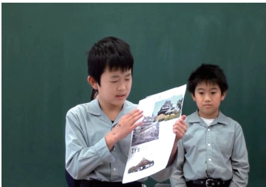
岛大附小同学介绍松江城旧址。

2020年突如其来的新冠肺炎疫情让二十一小赴日交流计划暂时搁置，但两地的小学生并没有因为疫情而淡忘彼此之间的承诺，反而被岛根“愿春早来、人间皆安”的祝