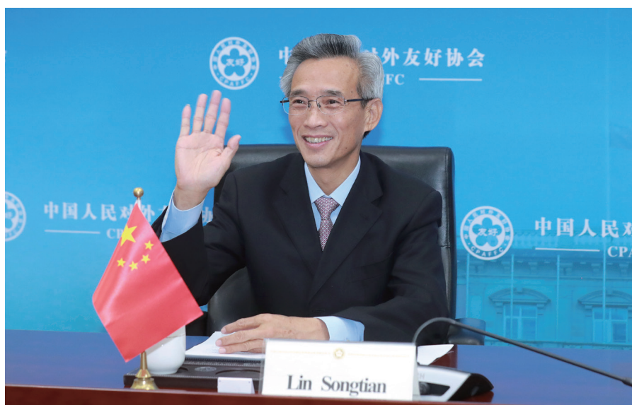
林松添会长出席对话会开幕式并致辞。

布兰斯塔德表示，1985年我曾接待时任河北省正定县委书记的习近平主席访问艾奥瓦州。2012年我们再次会面时，他亲切地称呼我为“老朋友”。我曾作为艾州州长