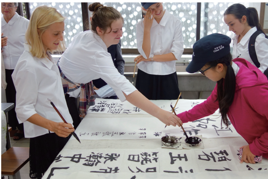
2016年，黑斯廷斯市中学生在桂林榕湖小学体验中国书法。

多年来，桂林与黑斯廷斯在诸多领域进行了有益的交流。有些交流活动以双向对等的方式展开，或者常年坚持，形成惯例。这些特定领域的交流卓有成效，广受欢迎，成为友城交流中的常青树。