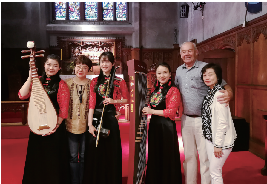
2018 年桂林市民乐小组到黑斯廷斯交流演出。

有效途径。黑斯廷斯市已举办了 4 次“终极大挑战”活动，仅凭一张人物相片，让广大中学生通过“人肉搜索”找出谜底。竞赛过程本身就是了解中国的过程，而请谜底人物亮相黑斯廷斯，高调参加节庆活动，更是绝佳的文化展示。