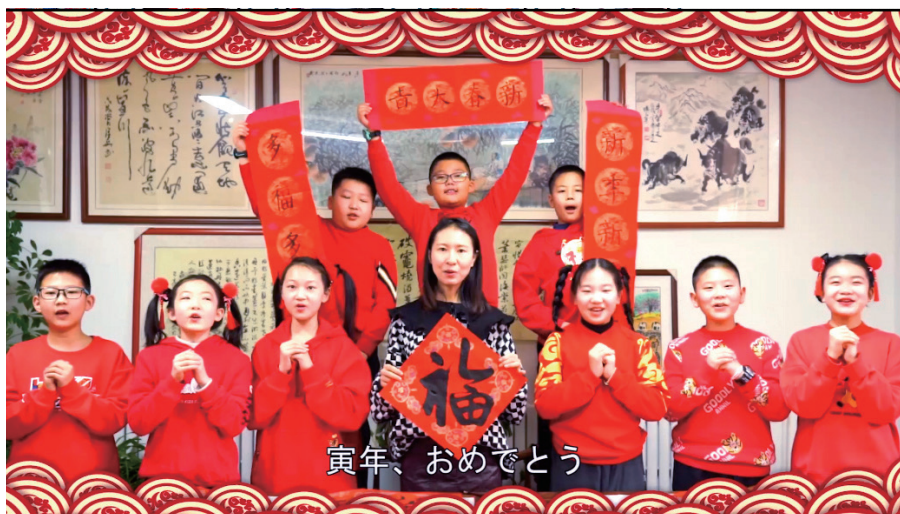
银川二十一小的同学们给大家拜年了。

“相知无远近、万里尚为邻”。宁夏和岛根虽然山海相隔、万里之遥,但是友好关系始终健康发展、历久弥新,并且一直影响和激励着两地一代又一代的普通人。明年将迎来宁夏和岛根建立国际友城关系30周年,二十一小和岛大附小间的友好交流将是对两地结好30周年的最好献礼,并将推动两地友谊更加深入人心,浸润两地少年的心田,为开启下一个友好交往的30年注入强大力量。■