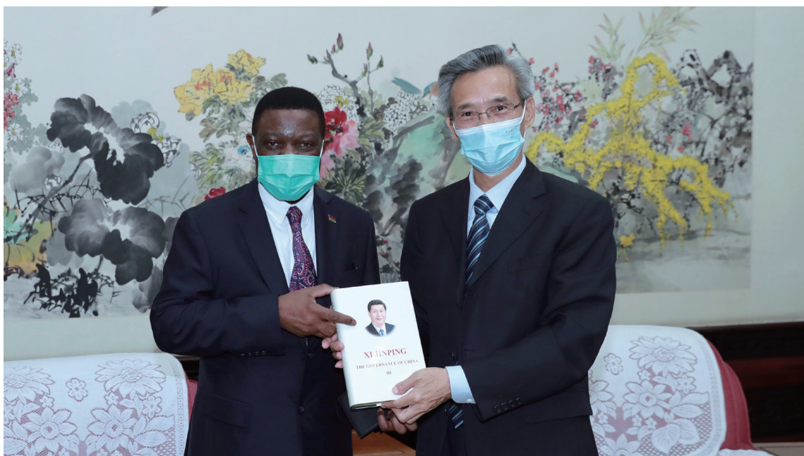
林松添会长向马拉维新任驻华大使钦泰扎赠送书籍。

林松添表示，由于地缘政治和冷战思维引发的俄乌冲突已严重破坏全球产业链、供应链和资金链稳定安全，引发了全球粮食、能源危机和通胀滞涨问题，世界人民、特别是非洲等发展中国家人民正面临生产生存威胁，并为此埋单。这是对世界人民的不公，应引起各国人民高度警惕。国际社会只有伸张正义、劝和促谈而非火上浇油，才能早日实现停火止战、摆脱危机，共享和平安宁与发展繁荣。■