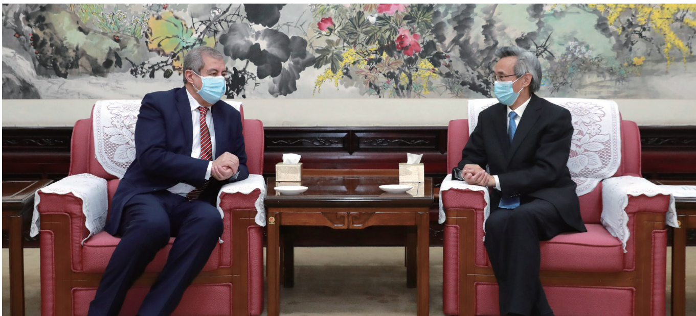
林松添会长与拉贝希大使亲切交谈。

双方还就推动两国民间友好交流，加强友好城市、地方政府、企业等领域交流与合作交换意见，达成积极共识。■