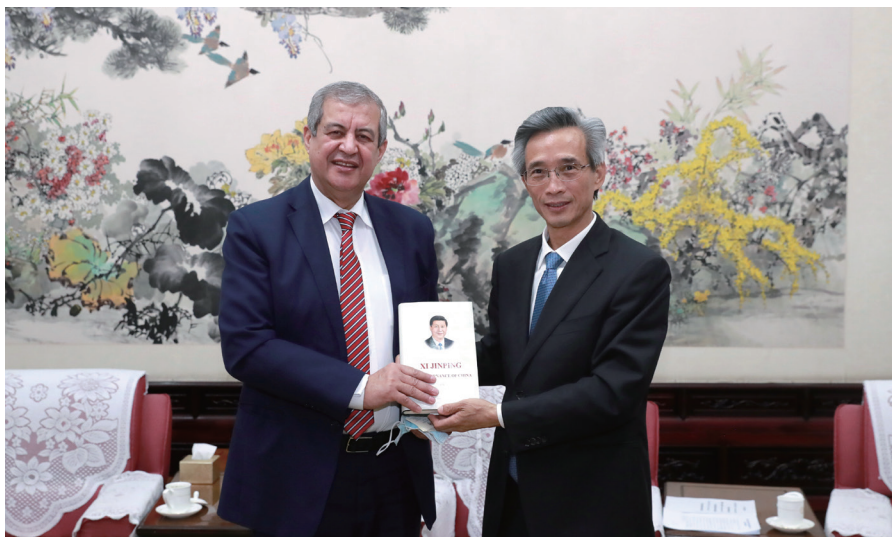
林松添会长向哈桑·拉贝希大使赠送书籍。

3月15日，林松添会长在中国人民对外友好协会会见阿尔及利亚新任驻华大使哈桑·拉贝希。亚非工作部主任孙学庆等会见时在座。