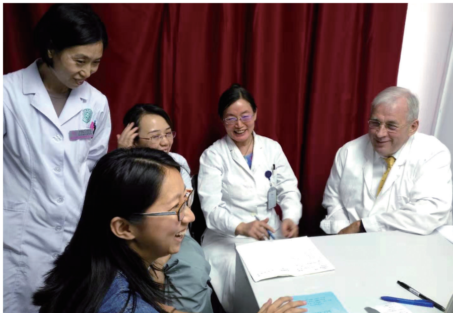
2019 年 9 月，托马斯（右一）在北京妇产医院会诊。

2015 年 3 月，托马斯被授予“南京荣誉市民”称号。同年 9 月，托马斯与夫人应邀来华，参加中国人民抗战胜利 70 周年纪念活动；习近平主席向他颁发抗战胜利 70 周年纪念章。2017 年 12 月，南京大屠杀国