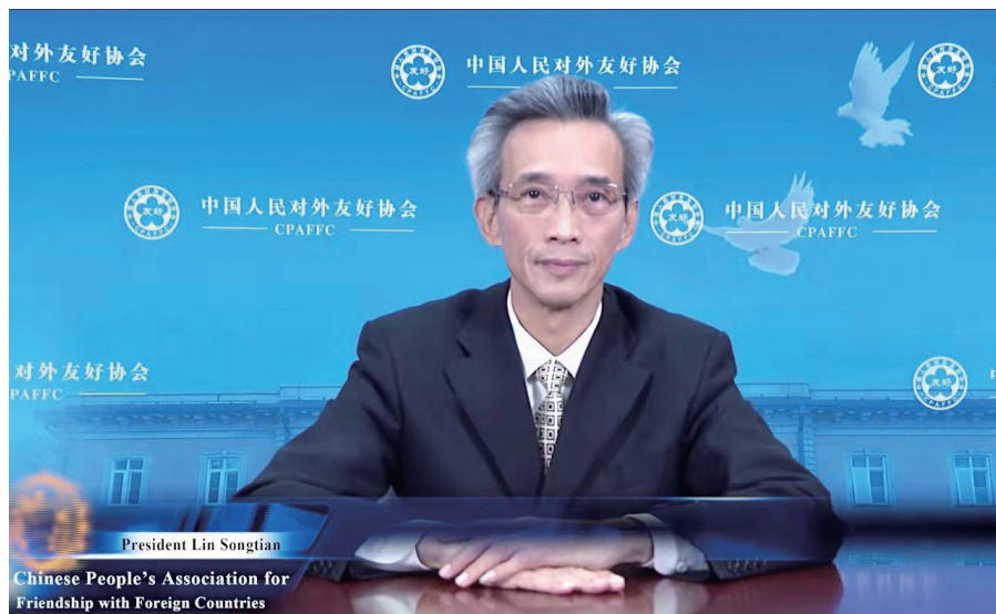
林松添会长在活动中做视频发言。

林松添说，中国共产党和政府始终坚持以人民为中心的人权理念。面对新冠肺炎疫情威胁，中国政府始终坚持人民至上，不惜一切代价救治和维护每一位中国公民的生命健康安全，不放弃任何人的生存权。面对贫困这一人类难题，中国党和政府把全体人民对美好生活的向往作为奋斗目标，让 14 亿多中国人民一个都不少地摆脱了贫困，过上了好日子。据法国民调机构益普索集团（Ipsos）发布的 2020 年度全球调