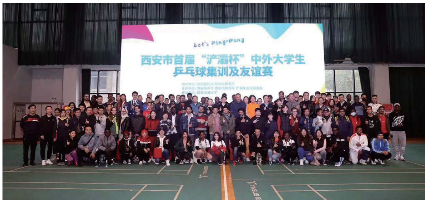
中外大学生乒乓球集训及友谊赛在西安市成功举办。

疫情无情，但未能阻断我们和众多友城共谱“友谊乐章”。自新冠肺炎疫情暴发以来，西安市新缔结交友城4对，友好交流关系4对；与各友城开展了迎十四运——中日韩友好城市樱花秀、西安——圣彼得堡欢乐新春活动、瓦伦西亚海鲜饭大赛等数十次丰富多彩的交流活动；与日本船桥市、韩国安东市等友城举办了数十场线上交流会议。2021年还借陕西省百对国际友城结好庆祝大会之机和法国波城市、荷兰格罗宁根市、土耳其科尼亚市和塞尔维亚克拉古耶瓦茨市等多个友城共庆“逢五”“逢十”结好周年。未来，西安也将继续发挥好古丝绸之路起点的区位优势，以更加开放包容的姿态拥抱世界，同各友城形成更加良性的互动，促进共同发展。■