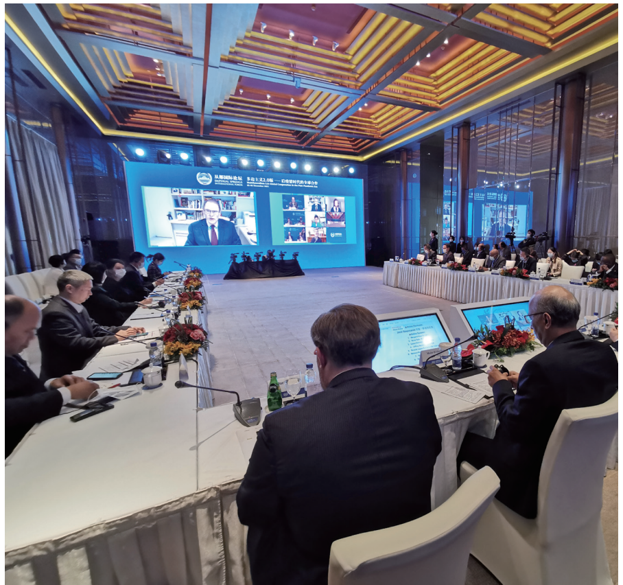
与会代表在论坛活动中进行深入交流和讨论。

关于后疫情时代的经济复苏、重振全球化，各方展开热烈讨论并一致认为世界各国应秉持真正的多边主义，坚持可持续发展理念，共同应对经济复苏难题。波黑部长会