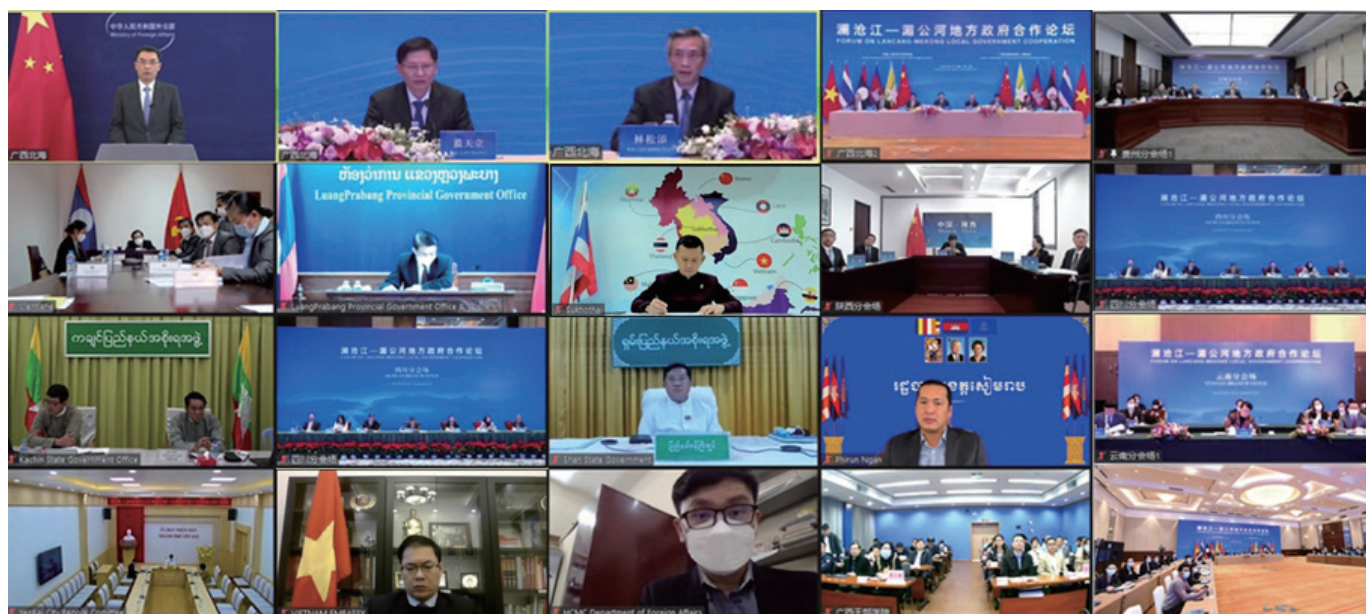
澜沧江—湄公河地方政府合作论坛以线上线下相结合方式举行。

林松添表示，前不久建成通车的中老铁路就是“一带一路”倡议在老挝率先落地见效和澜湄合作的重要成果。明年1月即将生效的《区