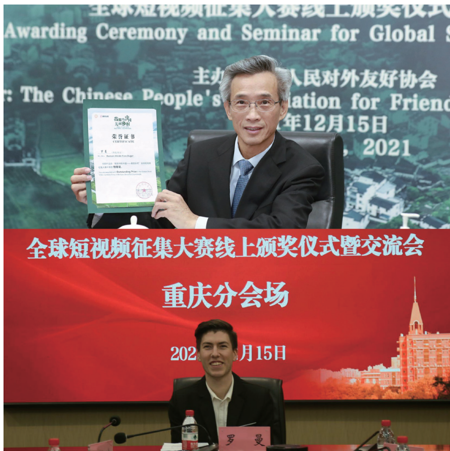
林松添会长向特等奖获得者颁授证书并作主旨讲话。

颁奖仪式后，17位外籍人士代表分别围绕“我眼中的中国乡村文化魅力”“我眼中的中国乡村绿色生态”“我眼中的中国乡村开放发展”三个议题，结合在中国乡村所见所闻和生活经历作了精彩发言，纷纷