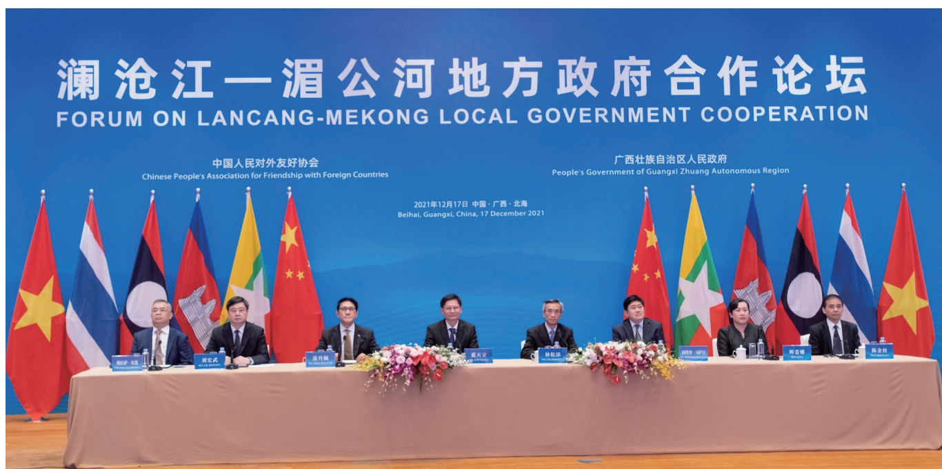
澜沧江—湄公河地方政府合作论坛在广西北海市成功举行。