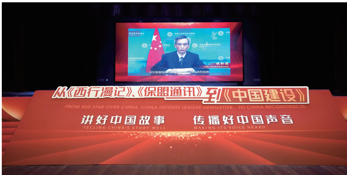
林松添会长在纪念活动上发表视频致辞。

族伟大复兴的满腔热情和执着追求，为我们在新时代讲好中国故事、传播好中国声音树立了光辉典范，留下了重要启迪和宝贵精神财富。我们要铭记宋庆龄先生为实现民族复兴、维护世界和平、促进人类进步作出的伟大贡献，缅怀和感谢埃德加·斯诺、路易·艾黎等一大批曾