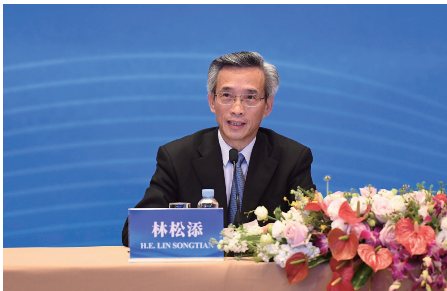
林松添会长出席论坛并作主旨发言。

会发展和人民福祉带来的广泛利益，一致赞赏中方搭建六国地方政府合作新平台，纷纷感谢中国和相关友城对各自国家及其抗击疫情提供的大力支持与宝贵帮助，并介绍了各自抗疫情况和推动经济复苏社会发展相关举措，表示愿与中方地方政府加强交流，深化在抗疫、农业、水资源、经贸、投资、物流、旅游、教育、环保、传统医药、人文等领域的互利合作，为六国地方政府和民众带来更多实际利益，共同维护澜湄合作可持续发展和共同繁荣。