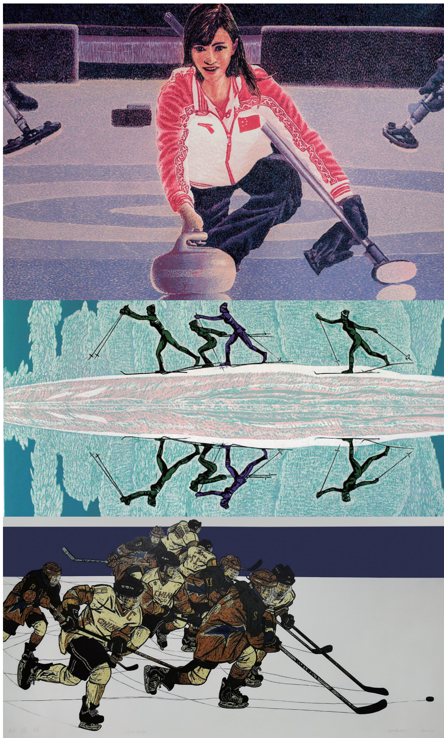
艺术家以冬奥会和冰雪运动为主题的精彩画作。