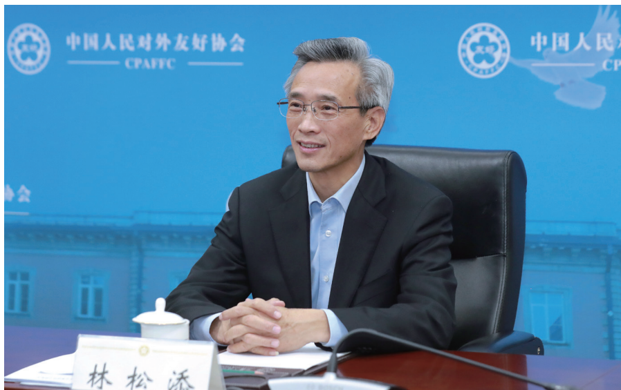
林松添会长作为友人理事会主席出席会议并发言。

2021年12月28日，中俄友好、和平与发展委员会第十三次全体会议和2021年中方全体会议以视频方式分别举行。全国政协副主席、委员会中方主席夏宝龙出席中方全体会议并与俄方主席季托夫在双方全会上分别致辞。中国人民对外友好协会会长林松添作为友人理事会中方主席出席会议并发言。