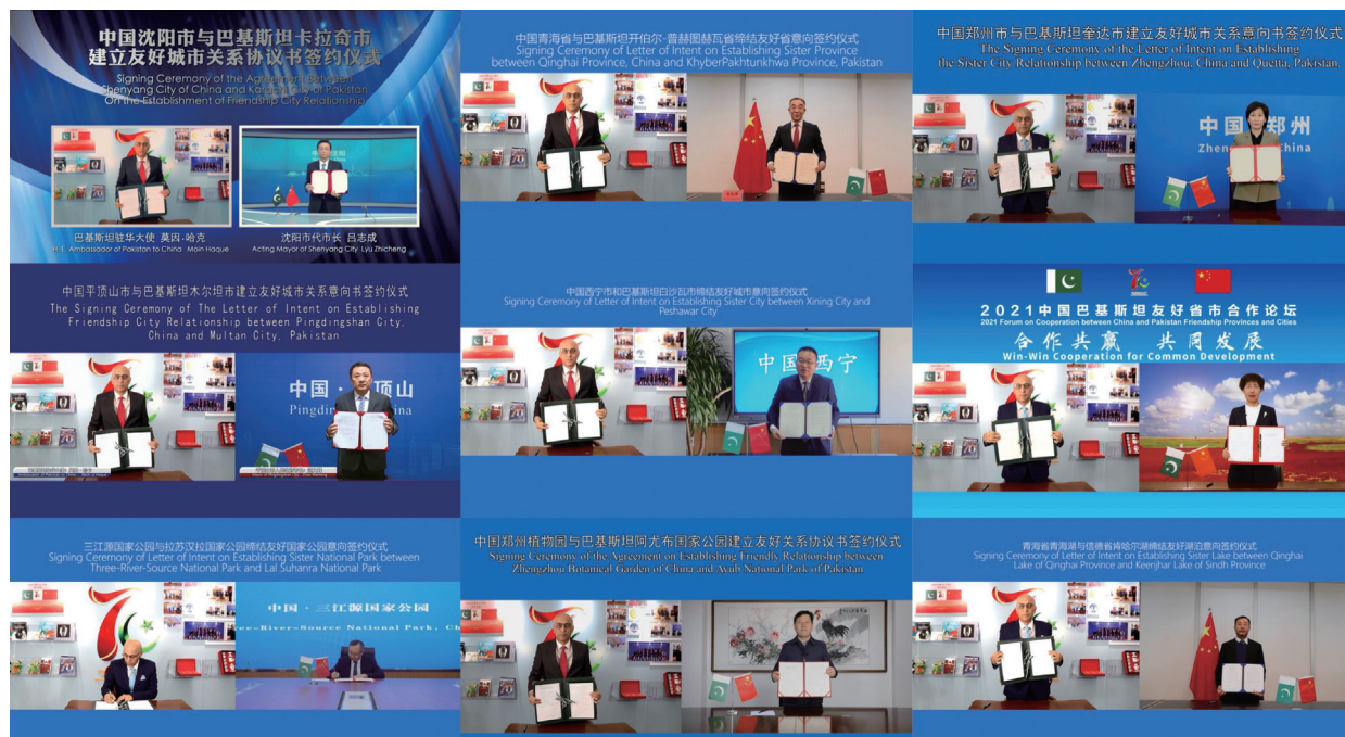
与会各方签署结对好协议或结对好意向书。

2021 中国巴基斯坦友好省市合作论坛是由中国人民对外友好协会和巴基斯坦驻华使馆于 2019 年发起成立的机制性活动，是庆祝中巴建交 70 周年系列活动之一。