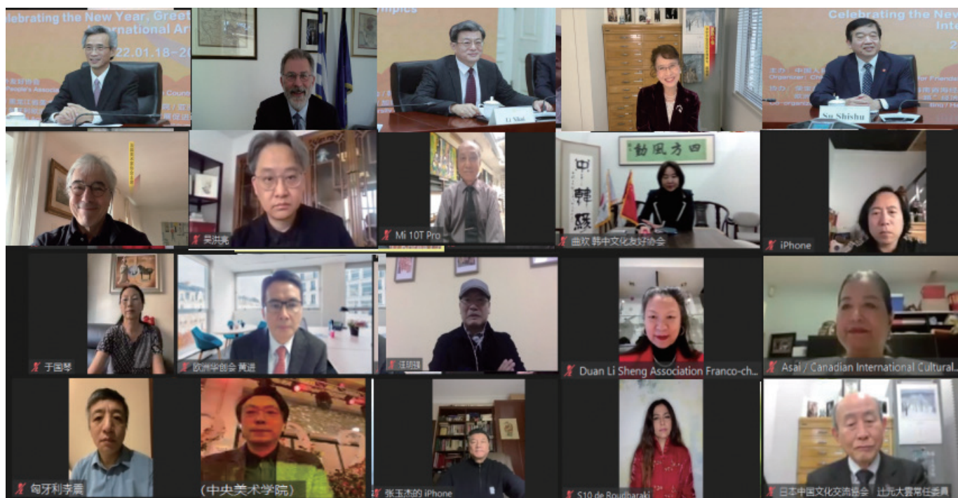
主要嘉宾视频连线出席活动开幕式。

本次展览展出了来自中国、俄罗斯、美国、英国、法国、加拿大、日本、韩国、巴西、智利、南非、