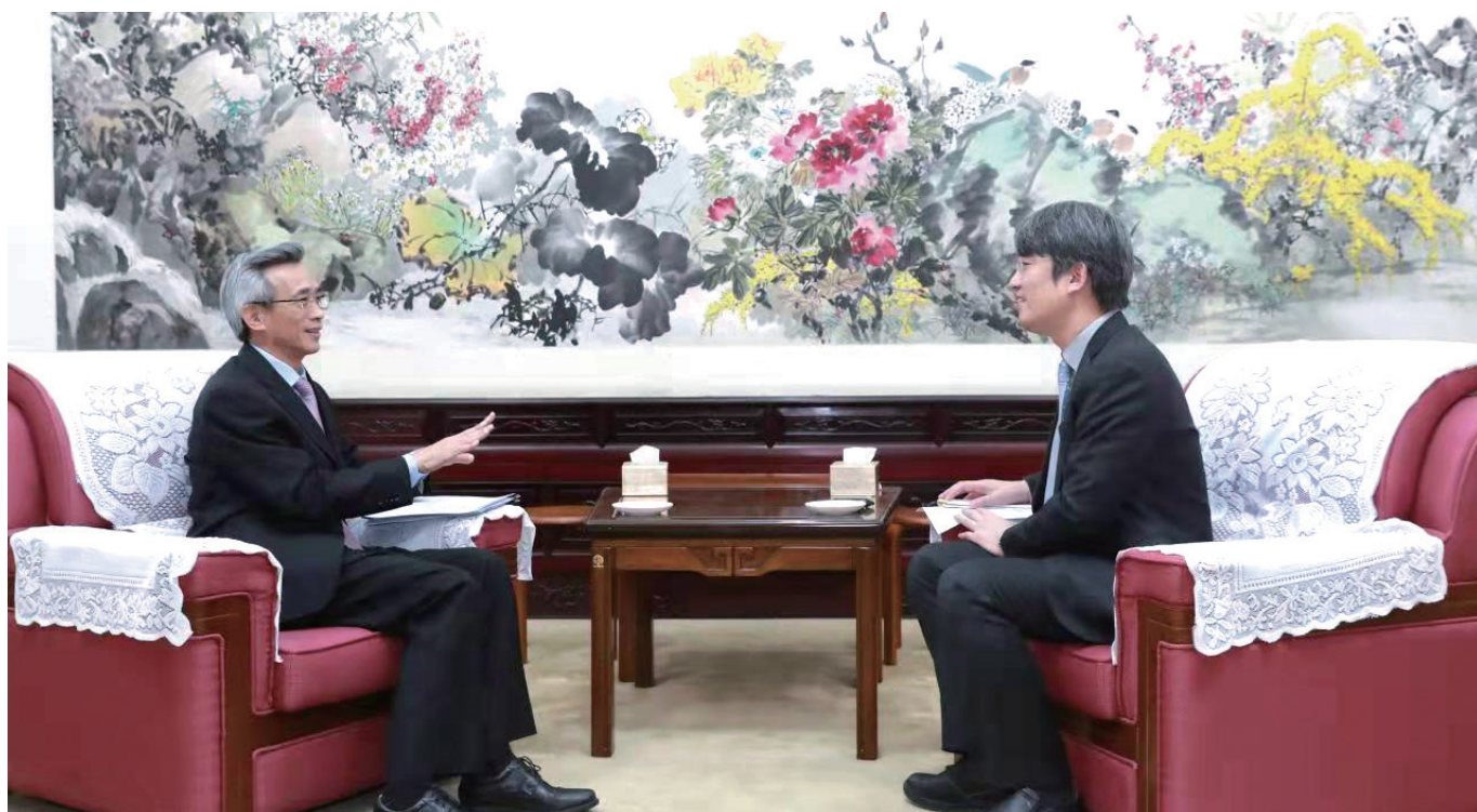
林松添会长接受韩国《中央日报》独家专访。

谈及韩国对华舆论、特别是年轻人对华感情变差的现状以及对这一现状的破解之道，林松添表示，中韩两国同属亚洲文化和儒家文化圈，两国人民拥有共同的亚洲价值理念和情感共鸣，共同致力于维护世界和平、公平、正义。韩国对华舆论变差以及韩国青年对华感情薄弱主要有两个原因，一是相互了解、友谊基础薄弱，新冠肺炎疫情又阻断了两国人员正常往来，影响了彼此了解和友谊；二是美国为维护自身霸权地位和既得利益，极力煽动地缘政治和意识形态冲突，毫无疑