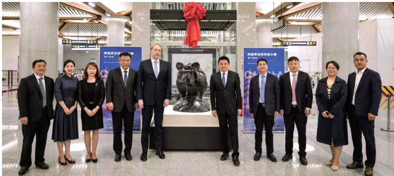
芬兰科沃拉市赠送的木熊工艺品揭幕仪式。

2021年10月，为促进世界青年群体参与文明交流互鉴，西安市外办还举办了“我眼中的世界——西安国际友城青少年绘画作品展”，征集并展出了来自9个国家11个国际友城及西安市青少年的125幅色彩明快、充满想象的书画作品，生动呈现了世界各地节日、习俗、美食、