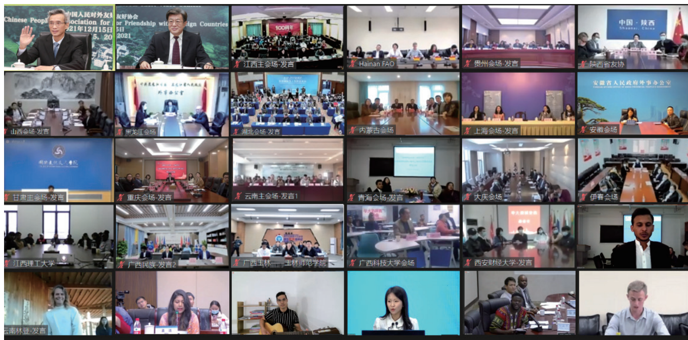
中外嘉宾近 400 人线上线下出席活动。

林松添说，当前，世界已进入新世纪新时代。世界变了，“中治西乱”已成为全球大现实，“东升西降”已成为世界大趋势，且不以人的意志为转移。美国等西方资本