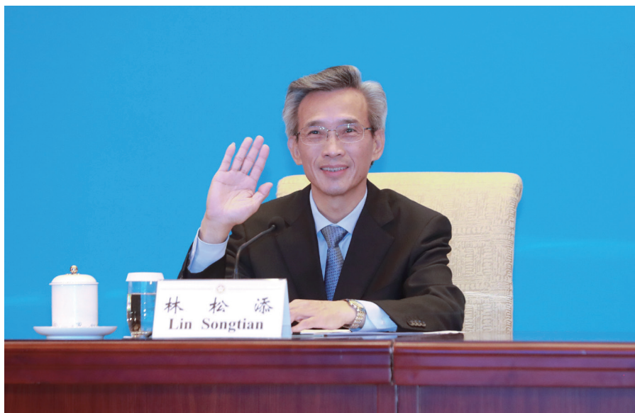
林松添会长出席论坛并致辞。

七、我们呼吁，人类正处于一个转折点，世界正在经历百年未有之大变局。国际社会需要来自各领域的领导者以智慧、责任和使命感来面对现实。世界各国对世界的和平稳定与发展繁荣负有共同责任，应展现应有的责任和担当，凝聚共识，采取有效行动，坚定维护全人类的普遍安全与共同利益，共创人类美好未来。■