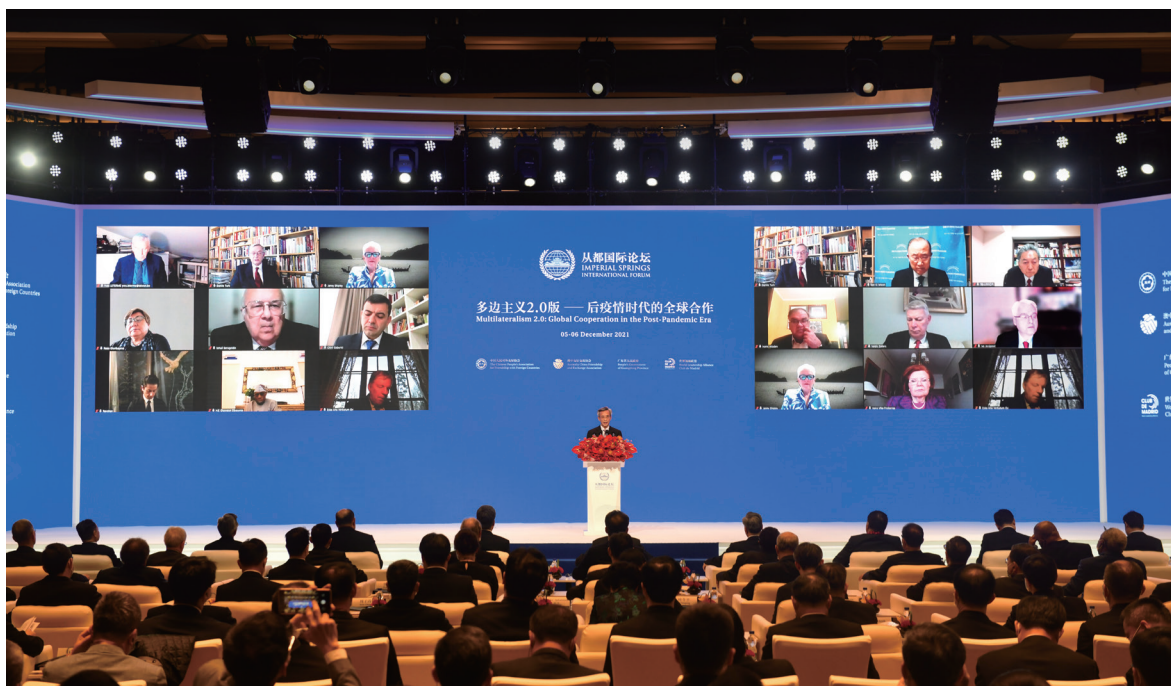
“2021 从都国际论坛”在广州开幕。