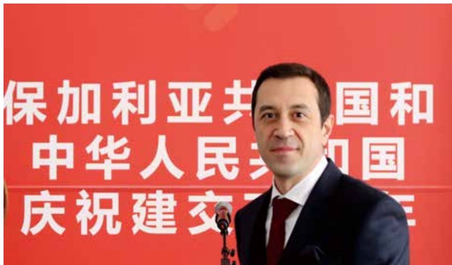
保加利亚驻华大使格里戈尔·波罗扎诺夫

正如我上面提到的，去年在中国中东欧国家合作倡议框架下，保加利亚举办了两场重要会议，也邀请到李克强总理访问首都索菲亚。在李克强总理和保加利亚总理博伊科·鲍里索夫共同出席的新闻发布会上，他谈到了自己参观保加利亚