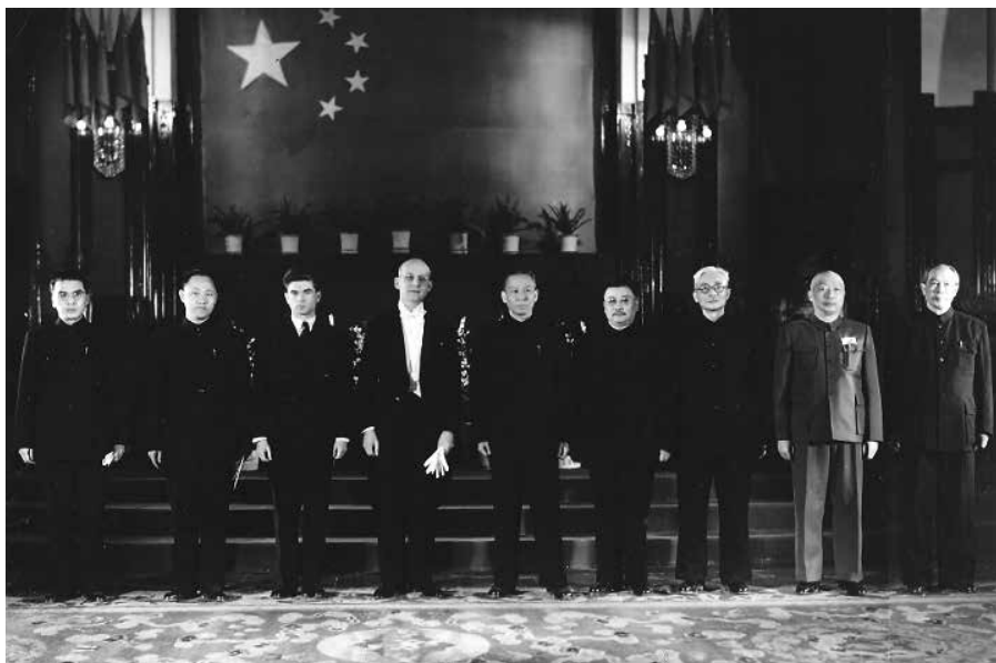
1950 年 1 月 13 日魏斯科普夫大使向中华人民共和国中央人民政府副主席刘少奇递交国书（当时毛泽东主席正在访问苏联）

本文作者白漪葛，毕业于捷克查理大学汉学系，曾任职于捷驻华大使馆，退休后为捷中友好事务奔忙，现任捷华协会秘书。