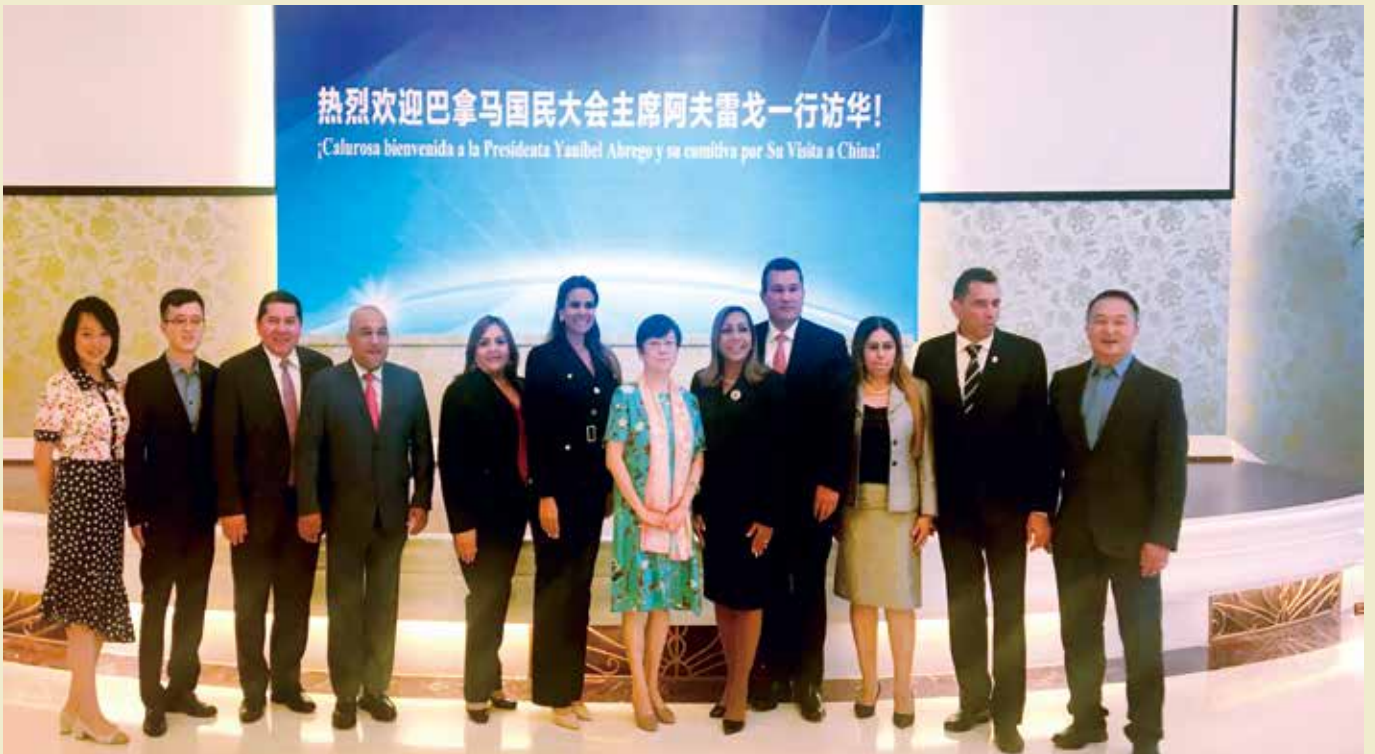
2019年6月20日，李小林会长会见应我会邀请访华的巴拿马国民大会主席雅尼贝尔·阿夫雷戈一行。