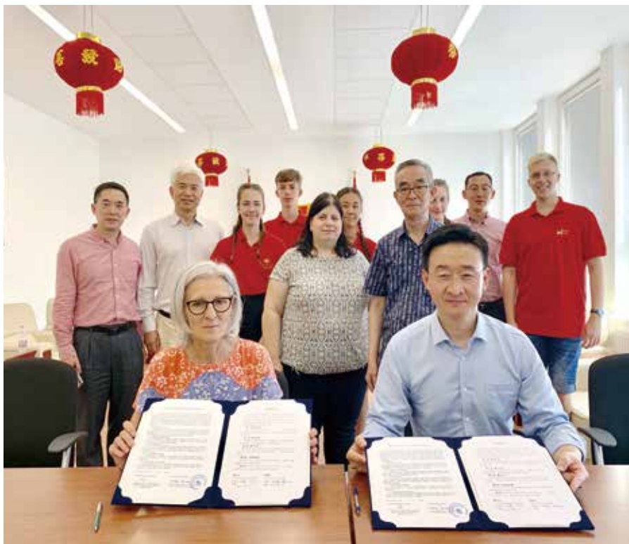
仓峰副会长与匈中双语学校校长签署赠书协议