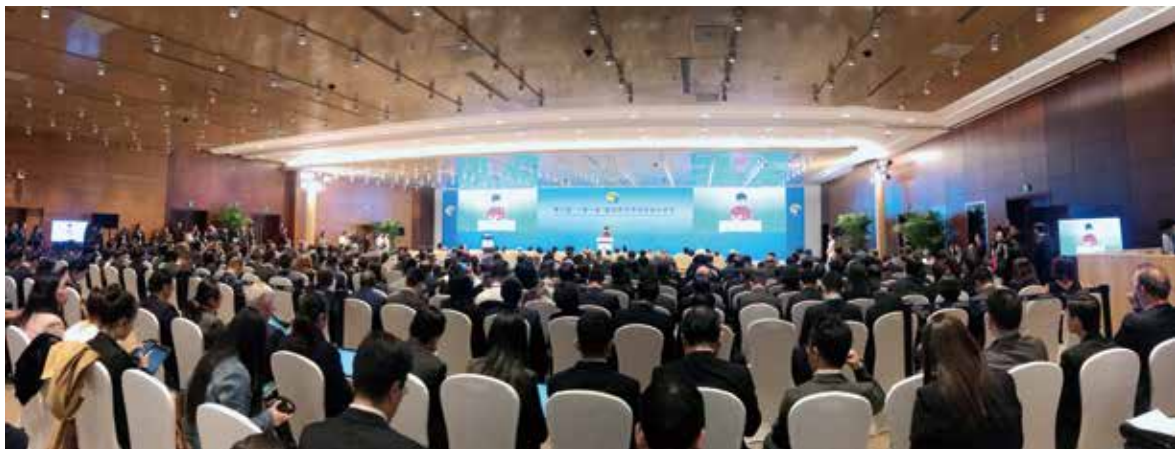
“一带一路”国际合作高峰论坛地方合作分论坛现场

正是由于地方合作在“一带一路”建设中日益增长的重要作用，今年的高峰论坛增加了“地方合作”分论坛，受到国内外嘉宾的热烈欢迎。这也是全国对外友协首次参与主办分论坛。4月25日下午，来自中国内地、港澳地区和全球五大洲40多个国家的省州长、市长及其代表、众多国际组织、企业家代表和专家学者共计300余名嘉宾共聚一堂，围绕“深化地方合作，共享发展成果”会议主题，分享“一带一路”地方交流的成果与经验，展望合作的前景与机遇。在这里，各位嘉宾不仅了解了世界各地的优质资源，听到历史悠久的友城故事，也学习