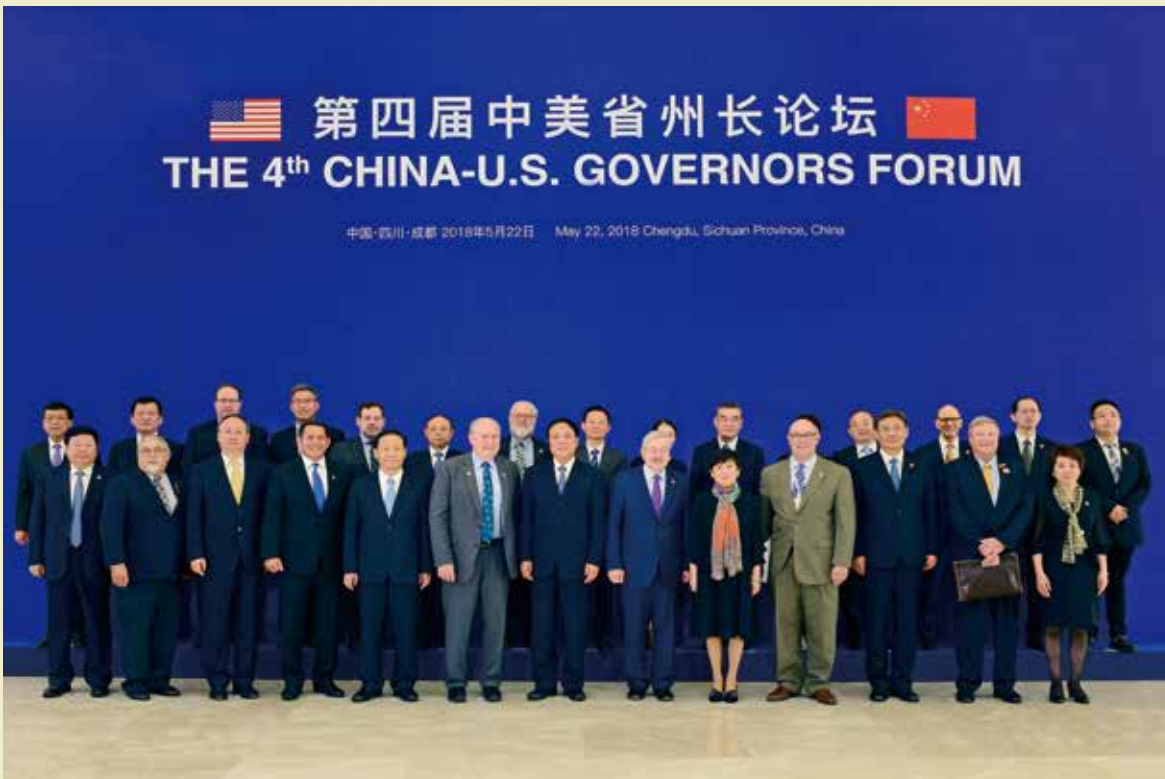
2018年5月22日，第四届中美省州长论坛在四川省成都市举行