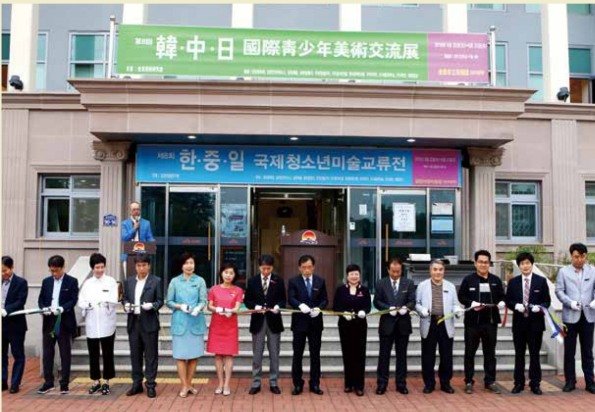
2018年5月22日，第八届中韩日青少年书画交流展在韩国金泉市立美术馆开幕