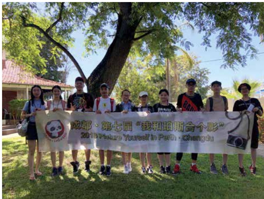
成都第七届“我和珀斯合个影”

最令人期待的是拜见市长。在到达珀斯的第二天下午，我们来到了 council house。在那里，我们见到了市长，给市长带去了传统礼物，并和市长进行了互动交流。周日，我们去了野生动物园。我们看到，袋鼠和考拉都很可爱，还有西澳特有的动物袋熊，以及一些鸟类。我很舍不得和这里说再见。此次珀斯之行，让我最难忘的是这里宜人的气候和一点也不怕人的小动物。在这里，上了这么多课，让我感受到了这里活跃的课堂氛围和友善的教师。最后，感谢为我们组织这次游学之旅的所有老师，让我们有了一次难忘的回忆。总有一日，我还会回到这里来的。■