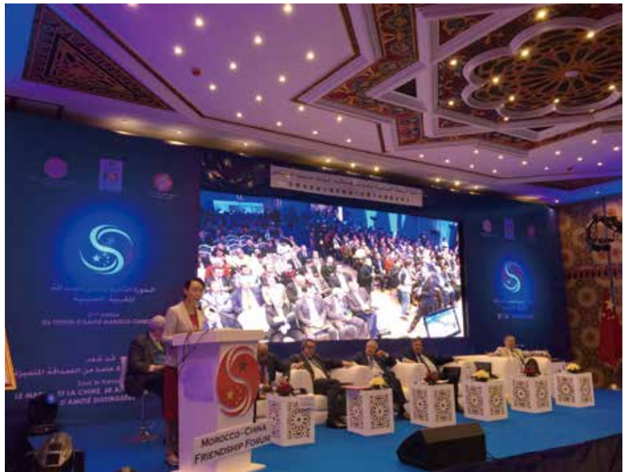
第二届中国摩洛哥友谊论坛现场