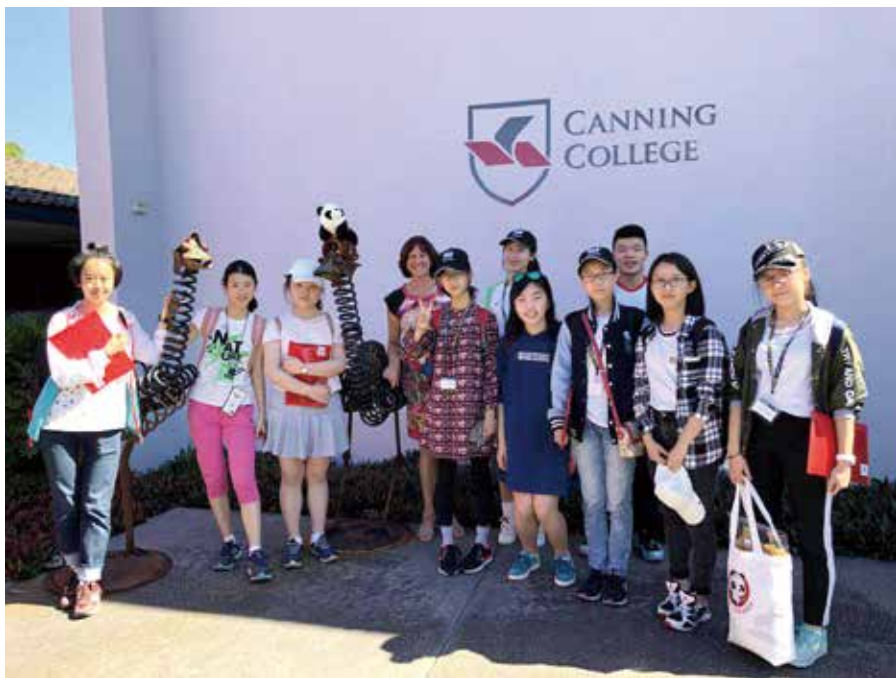
成都小使者参观西澳大利亚坎宁学院

珀斯市长丽莎·斯嘉菲迪和西澳大利亚州教育推广署执行总监菲尔·佩恩在珀斯市政厅热情接待了来自成都的获奖学生，对成都小使者的到来表示热烈欢迎，希望此次