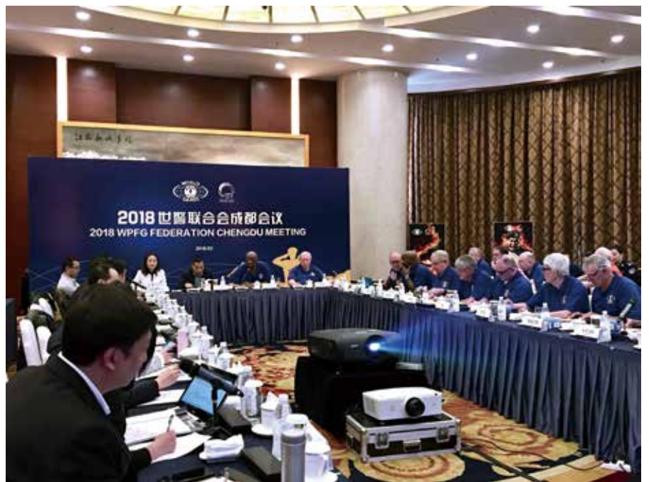
2018 世警联合会成都会议

成都市外事侨务办助力更多国际大咖关注成都新经济发展，为成都发展新经济培育新动能全力以赴——欧洲经济发展一体化委员会主席海赫默德·格瑞纳、南非驻华大使多拉娜·姆西曼、爱尔兰驻华大使康宝乐、诺贝尔奖得主、DNA 双螺旋结构发现者詹姆斯·沃森博士、捷克共和国外交部第一副部长卢卡