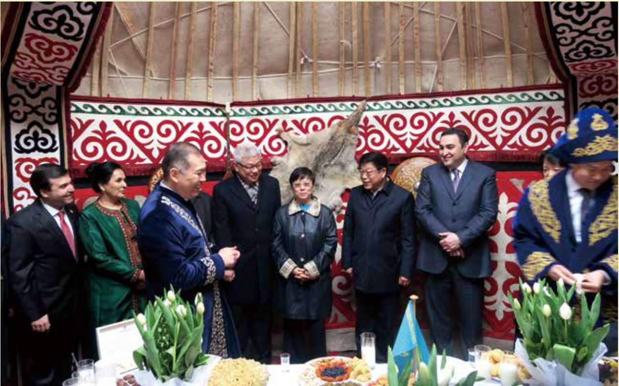
2018年3月23日，李小林会长出席国际纳乌鲁孜节招待会