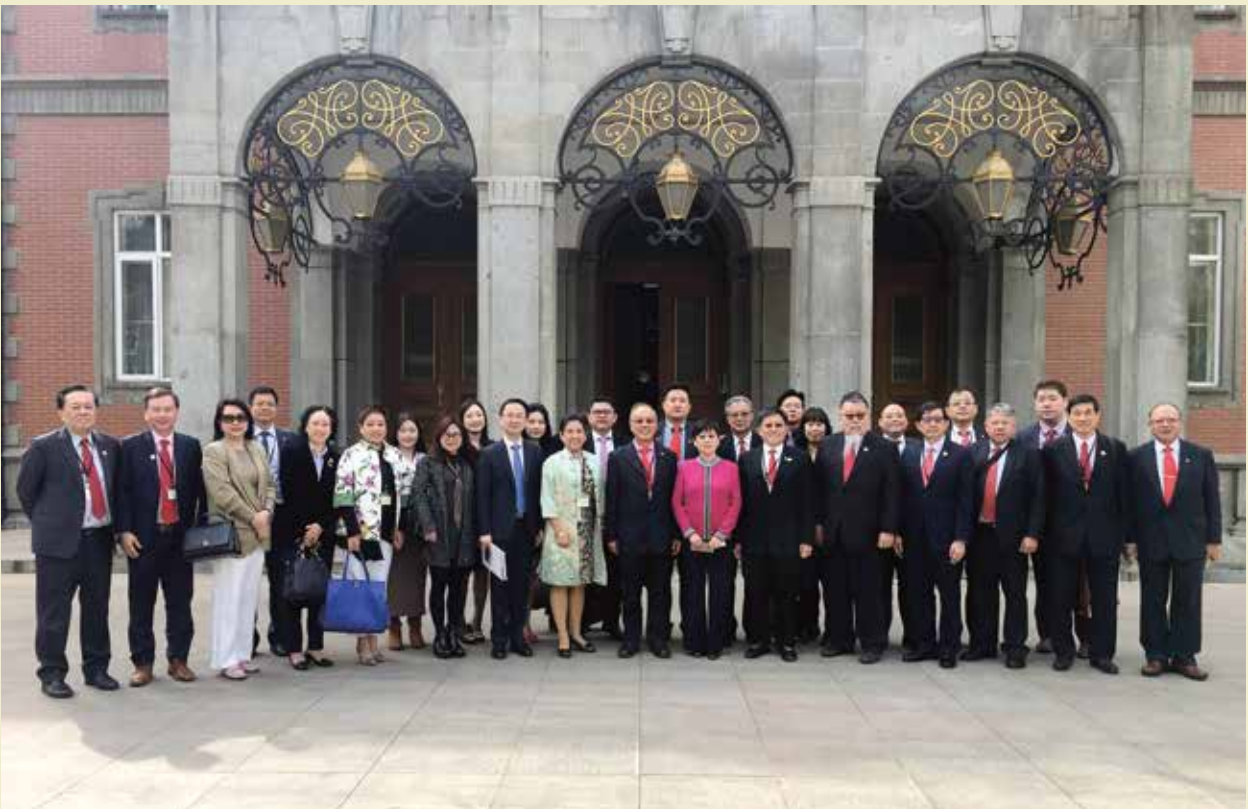
2018年3月29日，李小林会长与新加坡代表团合影