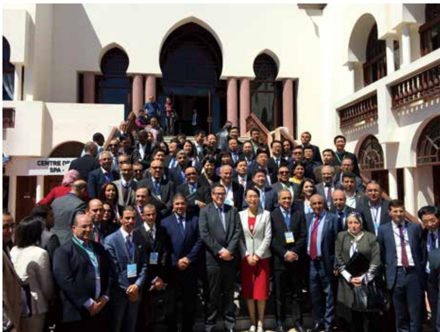
中摩代表在论坛会场愉快合影

中摩友谊论坛以地方政府务实合作为切入点，进一步夯实了中摩战略伙伴关系，密切了两国人民的友谊。摩洛哥作为非洲联盟和阿拉伯国家联盟成员，因其独特的地理位置，将为增进中非全面战略合作伙伴关系，中国与阿拉伯国家全面合作、共同发展的战略合作关系以及加强中国与非洲和阿拉伯国家在“一带一路”建设中的合作发挥更加重要的作用。中摩友谊论坛的召开也为今年在北京举办的中国非洲合作论坛峰会和中国－阿拉伯国家合作论坛第八届部长级会议打下良好的基础。■