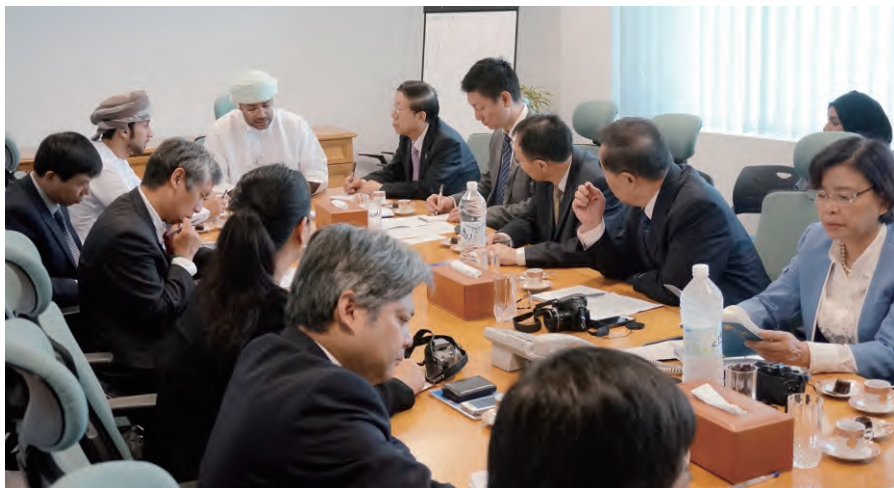
代表团与阿曼促进投资与扩大出口总署座谈

代表团此次在阿曼的访问只有一天半的时间，但阿方十分重视，多个机构同接待方阿曼中国友协联