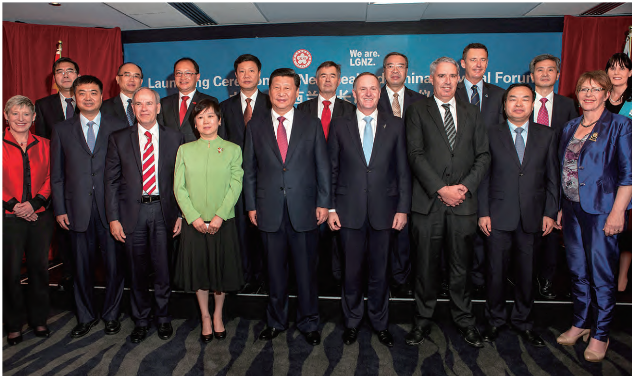
习近平主席和约翰·基总理同与会中新市长合影

李小林会长在发言中表示，全国友协受中国政府委托，协调管理中国国际友好城市工作。经过41年的发展，中国已同世界上133个国