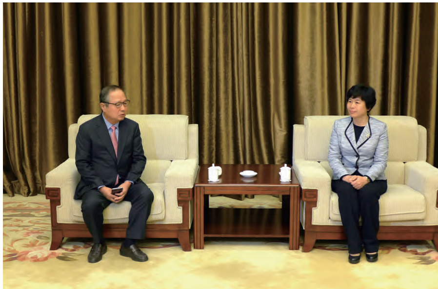
河北省副省长秦博勇（右）会见金成烨团长

在河北省涿州市，代表团参观了桃园结义之地三义宫，深切理解刘备、关羽和张飞的忠义、仁义和仗义。在习近平主席工作过的正定