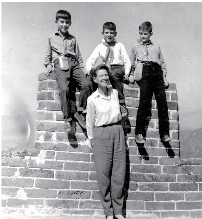
1965年伊莎白和她的三个儿子在北京八达岭长城

作出毕生奉献。我也确实感到很幸运, 在工作中有机会与这些人士认识, 向他们学习, 表达我的崇敬。