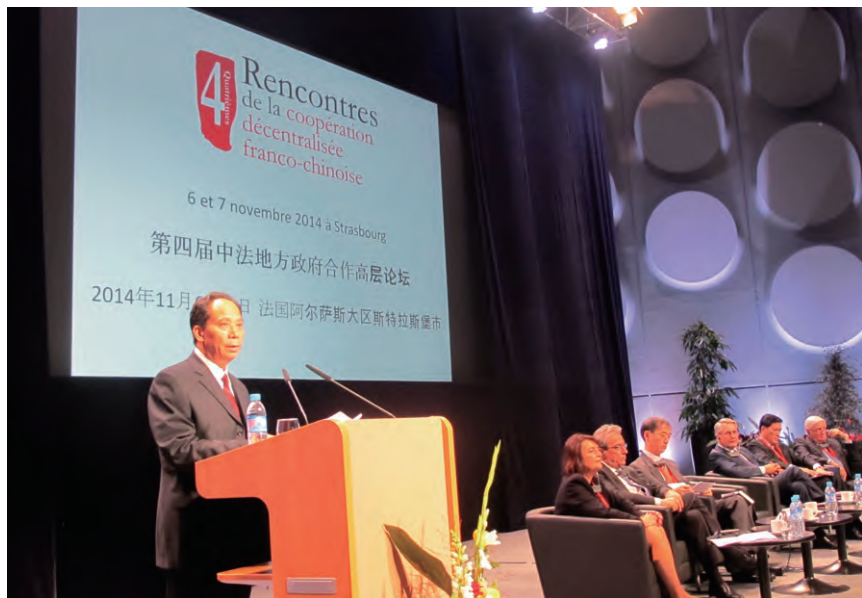
全国人大常委会副委员长吉炳轩在开幕式上发表重要讲话

吉炳轩副委员长在开幕式上发表的重要讲话中，阐述了中国全面深化改革、实现“两个百年”的奋斗目标以及近期召开的中共十八届四中全会关于全面推进依法治国的重大决定。关于中法地方合作，他表示，地方合作是中法关系的重要组成部分，也是促进中法友好关系可持续发展的重要引擎。合则两利，合则双赢，合作越紧密，中法两国人民的福祉就越大。合作之基在于情，双方只有在互相敬重、友情相融的基础上，才能合作得更加紧密、更加牢固、更加宽广和更加深厚；合作之根在于诚，中法友好的根基