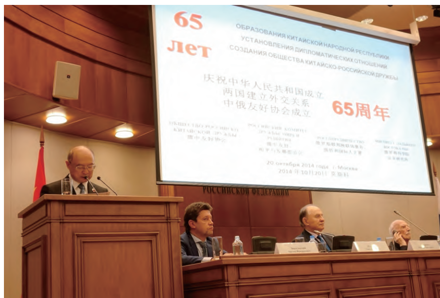
全国政协副主席、中俄友协会长陈元在中俄建交暨中俄友协成立 65 周年庆祝大会上致辞

陈元副主席访问俄罗斯，是中俄关系进入新阶段后双边首次重大民间外交活动，对进一步夯实中俄关系的社会和民意基础，将两国高水平的政治关系优势转化为更多实实在在的务实合作成果起到了积极推动作用。■