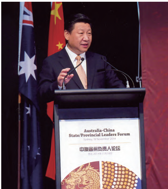
习近平主席在中澳省州长论坛上致辞

习近平主席在致辞中对中澳省州负责人论坛成功召开表示祝贺。习近平指出，地方是两国合作最基