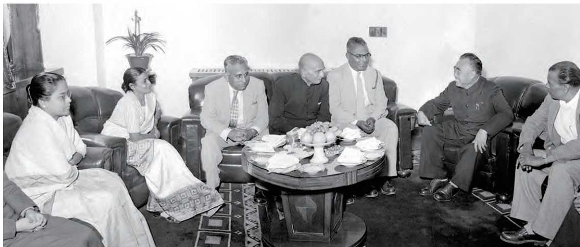
朱德副主席 1957 年 10 月 4 日接见印度援华医疗队队员及其家属

这一时期的友好交流中，两国领导人高度重视，积极参与。1953 年以丁西林会长、夏衍为正副团长的友好代表团应印中友协邀请访印，受到了印度副总统拉克里希南和总理尼赫鲁的接见；同年全印和平理事会应和大邀请组派印度艺术代表团访华时，毛泽东主席会见了代表团主要成员，周恩来总理为代表团举行了欢迎招待会。