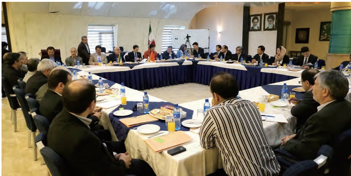
中伊两国友协年会暨两国关系研讨会会场

伊中友协成员、伊朗文化及伊斯兰指导部副部长阿里·穆拉哈尼在会见代表团时表示，伊中两国都是有着古老文明的重要国家，伊方重视同中国的关系，愿同中方加强合作，推动双边关系的发展。伊朗文化及伊斯兰指导部是伊最重要的部门之一，负责艺术、电影、书刊