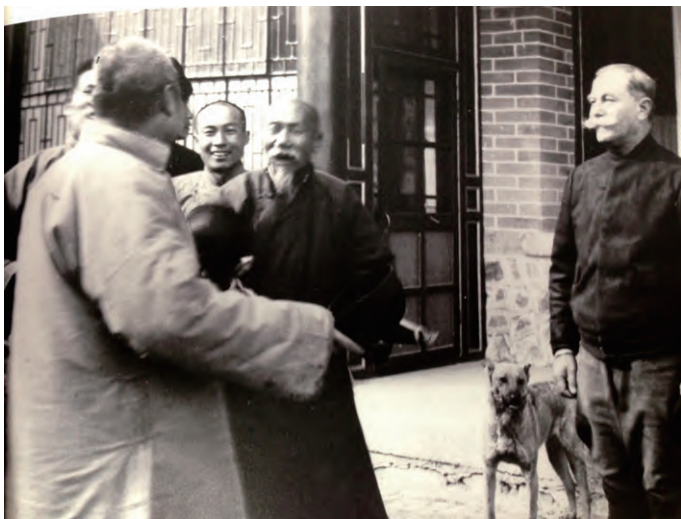
贝熙业大夫在贝家花园与当地农民在一起

习近平主席所说的“自行车驼峰航线”是贝熙业大夫在中国不为人知的一段传奇。贝熙业大夫自己在描述这段传奇时这样写道：“我曾经目睹并亲历了这里的军民奋起抗击日本侵略者的一幕，深受感动。我愿意为这个勇敢的民族尽绵薄之力。因为我深爱中国，深爱这里的人民。”1950年，77岁高龄的贝熙业大夫娶了26岁的大家闺秀吴似丹为妻。年龄的差距并没有成为双方相爱的障碍，贝醉心于中国文化，特别痴迷研究基督教与道教的共性，