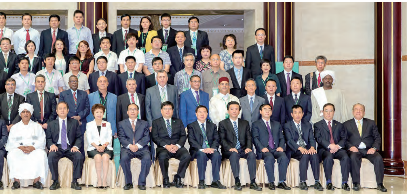
中阿城市论坛与会代表

阿卜杜拉·萨阿迪大使在讲话中赞扬了巴勒斯坦人民为争取合法权利的不懈努力,高度赞赏中国对巴勒斯坦人民的声援和支持。萨地·加波代办在讲话中感谢中国政府和人民对巴勒斯坦人民正义事业的坚定支持。加尼姆·希卜里大使宣读了2014年阿拉伯国家联盟秘书长纳比勒·阿拉比就声援巴勒斯坦人民国际日的讲话。■