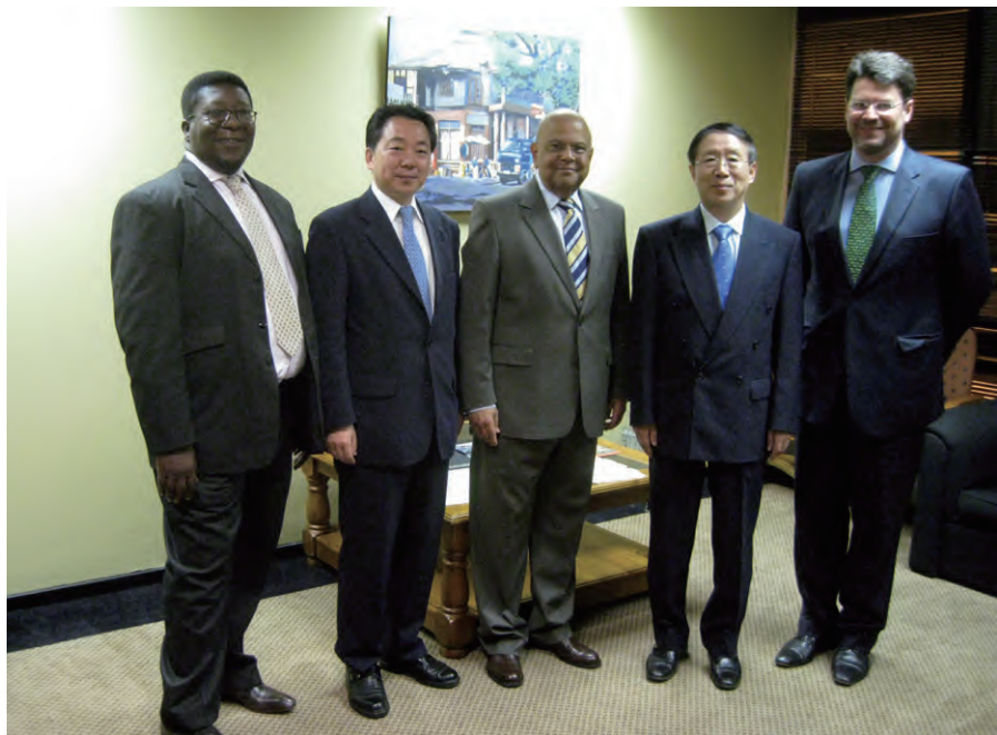
代表团与南非联合执政和传统事务部部长戈尔丹合影