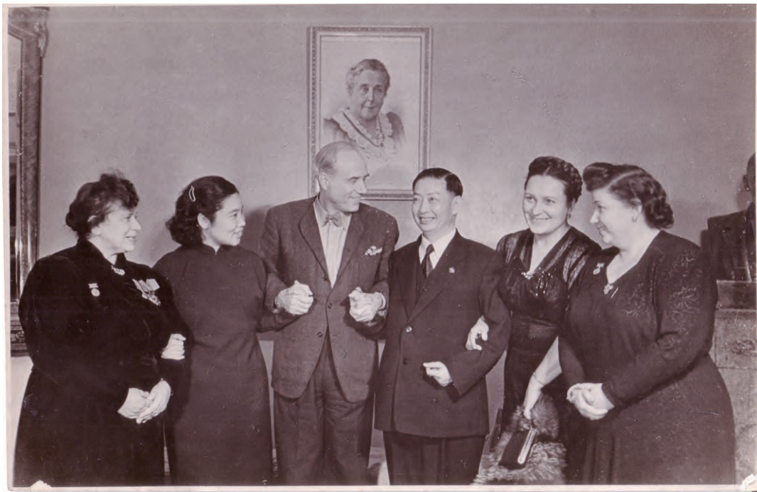
梅兰芳（左 4）、常香玉（左 2）在莫斯科与苏联艺术家在一起

宴会后，又到剧场观看歌舞剧，剧情具有喜剧色彩。演毕，演员还不肯离去，等待与梅兰芳见面、合影。因为第二天早晨要赶飞机，双方才依依不舍地分别。■