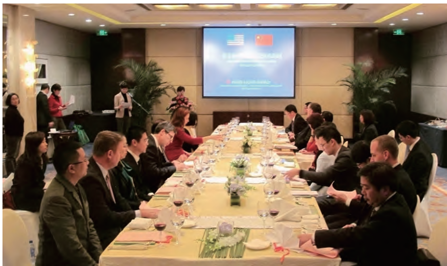
代表团在“中美地方政府领导人交流会”上，与来自四川省自贡、遂宁、江油等地的市领导和部门负责人共叙友谊，畅谈合作

共同度过了一段短暂而欢乐的时光。克里费希激动地表示，孩子们的微笑和友谊温馨动人，是他们此次四川之行最珍贵的记忆。代表团还与成都市成华区教育局负责人和学校负责人进行了座谈交流，在教育领域的合作形成了共识。在成都高新区，代表团通过高新视窗，全面了解了高新区20年发展历程、发展成就和今后的奋斗目标。团员们详细询问了高新区的产业规划和吸引外来企业的优惠政策，对成都优美的自然环境和良好的投资环境称赞不已，纷纷表示愿意向自己家乡的企业宣传成都，鼓励更多的美国企业到成都投资兴业。在三圣花乡，代表团参观了幸福梅林、白鹭湾湿地和生态花卉产业园，对成都市各级政府统筹城乡发展、改善生态环境、帮助农民增收方面所取得的成就表示钦佩。