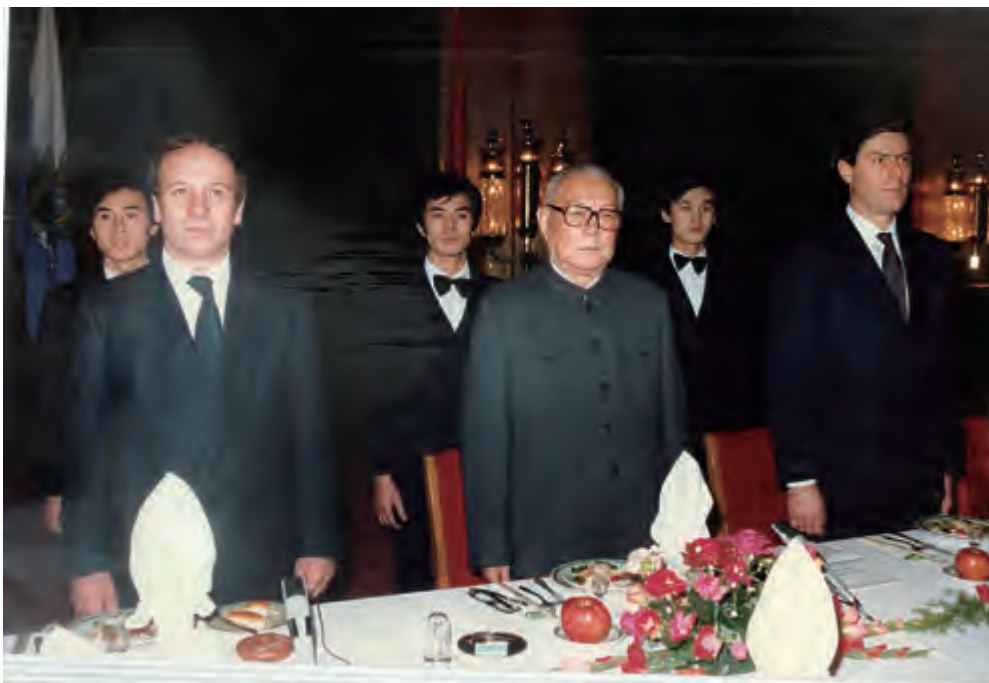
1988 年，李先念主席宴请来华进行国事访问的圣马力诺国家元首泰伦齐（左 1）

在中国的访问过程中，我乘坐的是著名的红旗车，这让我十分欣慰，因为我知道“红旗”车是中国国家象征。之后，在全国友协的帮助下，我得