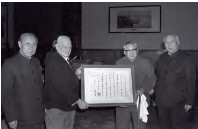
1982年12月2日，北京市政府授予路易·艾黎“荣誉市民”称号。