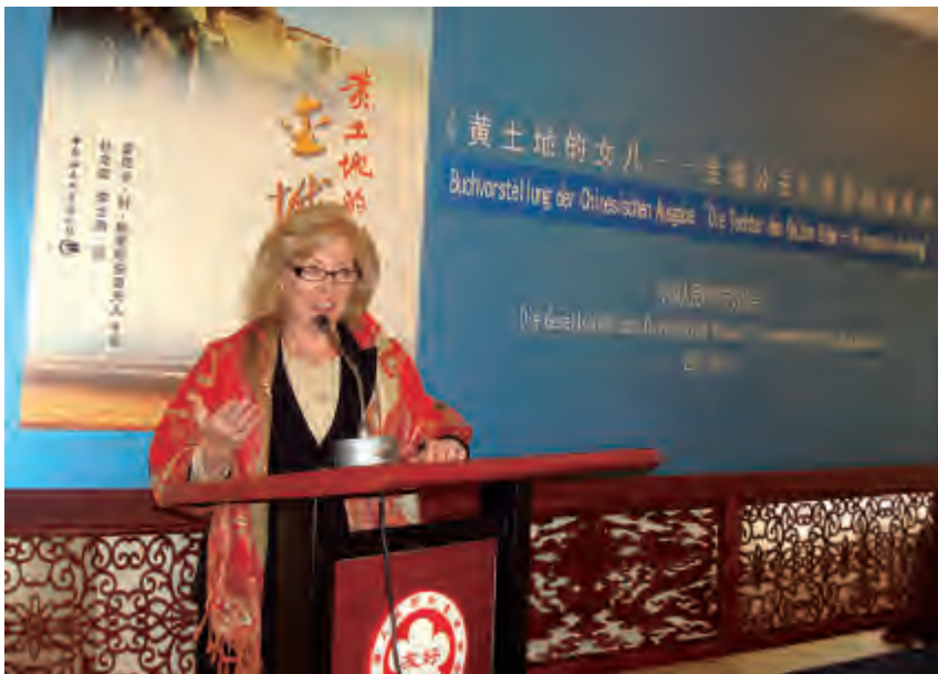
本文作者在《金城公主》中文版首发式上讲话

今年是中国人民对外友好协会成立 60 周年，我谨代表德国莱法州多纳斯贝格县德中友协向对外友协表示衷心祝贺！