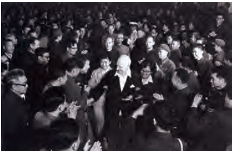
1982年6月5日，路易·艾黎参加甘肃兰州石油技工学校建校40周年的庆祝活动，受到师生和校友们的热烈欢迎

我虽然自1952年在京召开亚洲及太平洋区域和平会议时就知道艾黎，他搬进“和大”院内后也常在各种外事场合见过他，但对他的往事并不熟悉。1982年甘肃省应老培黎校友请求，同意在兰州举行一次“山丹培黎学校创办40周年纪念大会”，让校友们有机会见见艾黎，并去山丹看看。艾