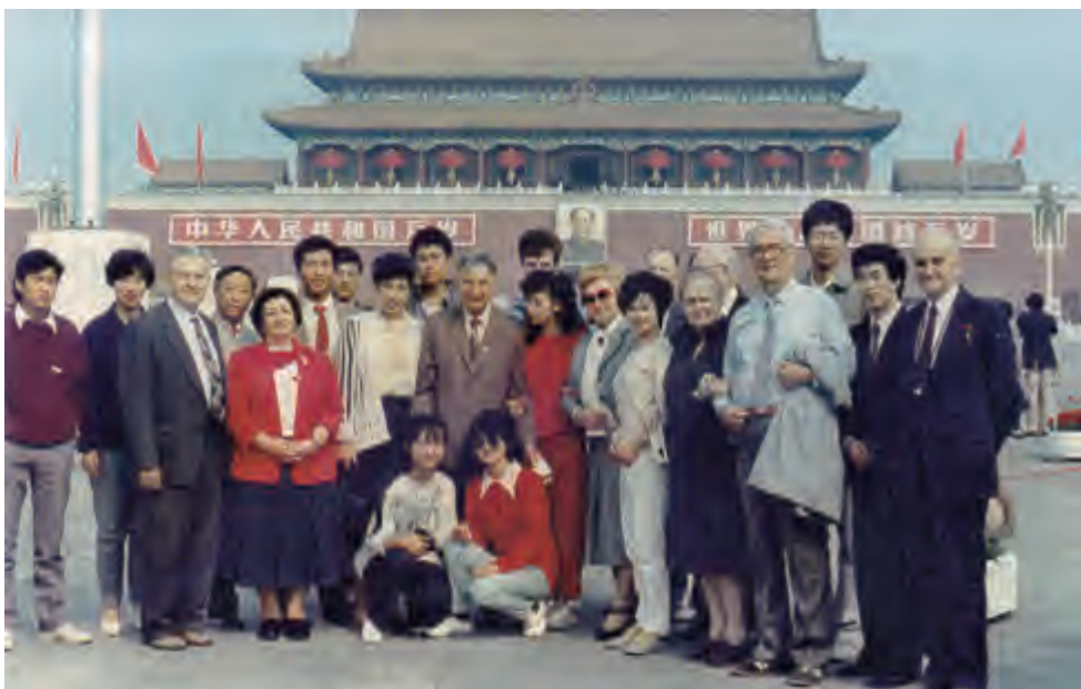
1989年9月30日，阿尔希波夫率团访华时在天安门广场合影