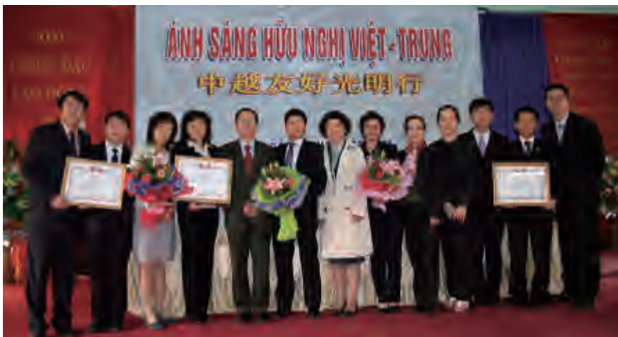
2009年11月，全国友协在越南举办“光明行”活动

人为越中面向新世纪的发展确定了指导思想和总体框架，即“长期稳定、面向未来、睦邻友好、全面合作”的十六字方针。2002年，中共中央总书记江泽民在访问越南时提出“好邻居、好朋友、好同志、好伙伴”的四好精神。2008年，两国领导人一致同意建立全面战略合作伙伴关系，标志着越中关系进入新的发展阶段。从战略高度和长远利益出发，越中两党和两国政府为两国各领域合作提供有利条件，人民交流日益活跃。