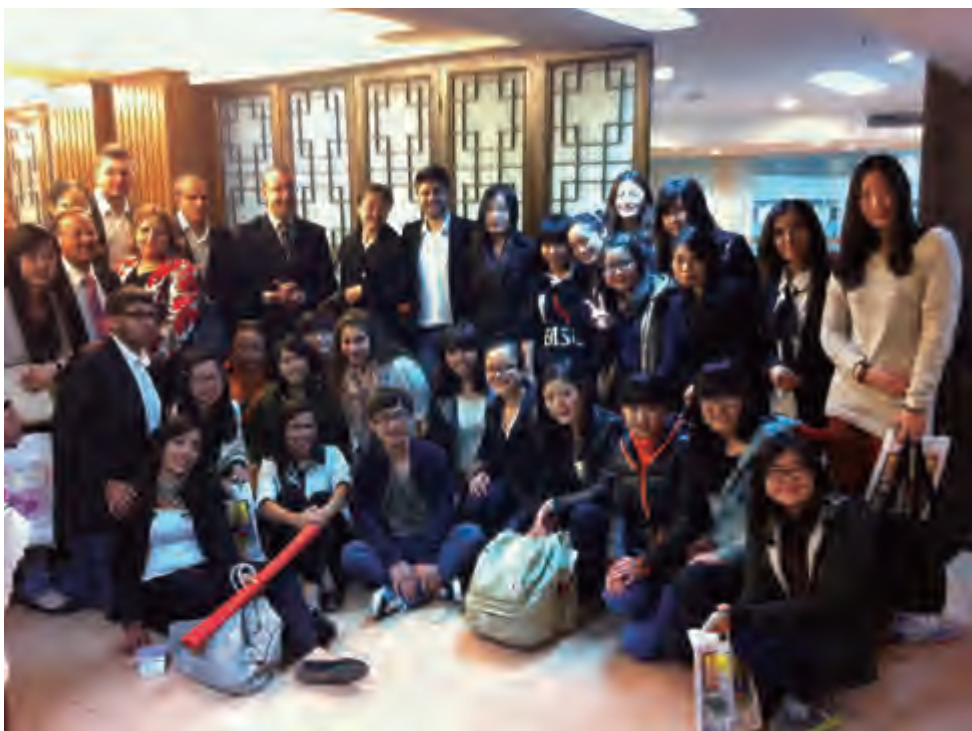
黎中友联代表团与北京第二外国语学院的学生交流