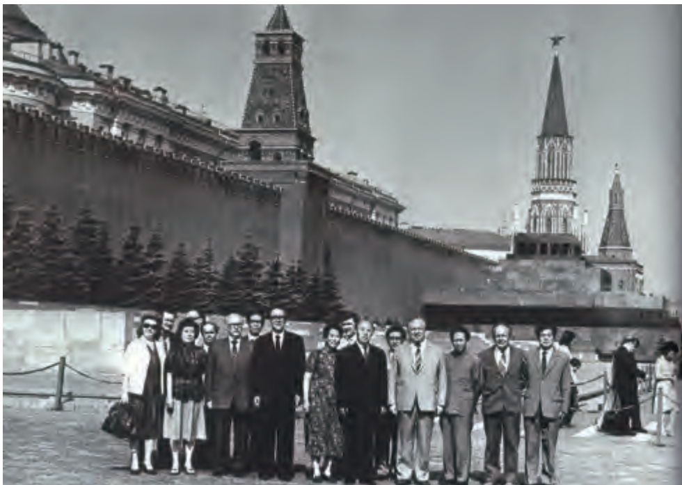
1984年6月，中国人民对外友好协会会长王炳南率团访俄时参观红场

这方面最好的例证就是习近平主席与俄联邦外交部所属莫斯科国际关系学院的学生亲切交流并作了演讲。我有幸作为校友受邀参加本次活动。习近平主席在他题为《顺应时代前进潮流 促