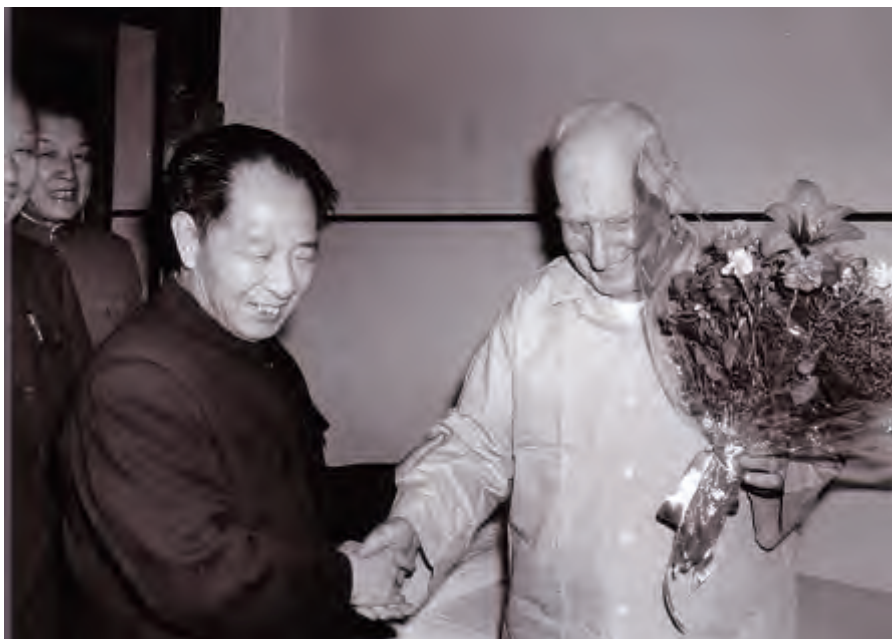
1982年3月，胡耀邦同志去北京协和医院看望艾黎