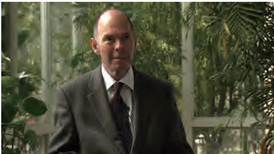
赫尔加松在全国友协接受采访

冰中文协可能是与中国人民对外友好协会最早建立关系的文化组织。1955年，全国友协会长楚图南