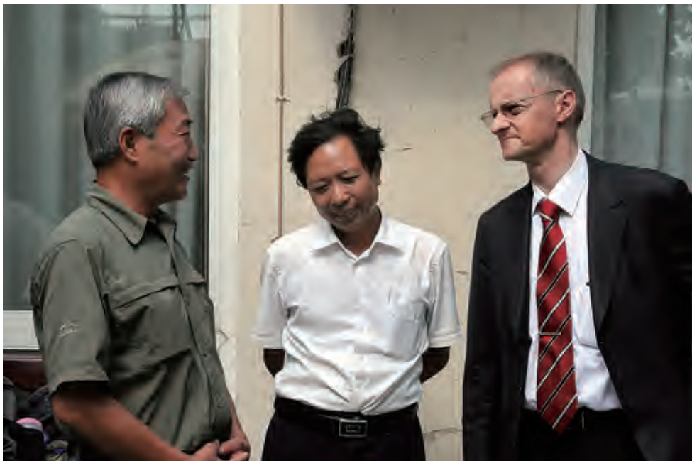
白鹤（右 1）2013 年访华时参观宁夏一葡萄酒庄园