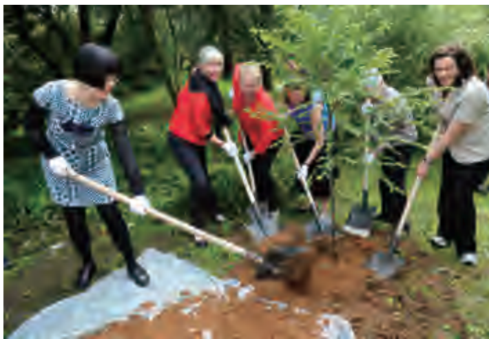
代表团成员种植象征新时期中美两国人民友谊的红豆杉树苗

考克斯表示，他和夫人一直以来都非常期待能够探寻外祖父的足迹，亲眼看看中美友谊之树。他介绍说，红杉树原产自美国加利福尼亚州，来自尼克松总统的家乡。对于美国人来说，红杉树代表着力量与美丽。在条件允许的情况下，小小的红杉树种可以生根发芽成长为世界最高的参天大树并存活数千年。1972年，尼克松总统希望通过他对中国的首次访问播种下中