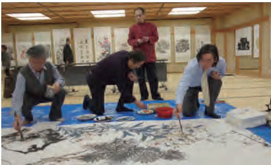
中国画家现场作画交流。右1为本文作者

此次出访收获颇多。在此感谢主办方中国·友好艺术交流院提供此次机会。在保钓之际，此访不负文化外交之重任、破冰之旅之先锋。同时，本次艺术之旅也受到了日方友人诚挚和热情的接待。艺术上的交流是短暂的，但通过艺术交流传递出中日友好的情谊是源远流长的。■