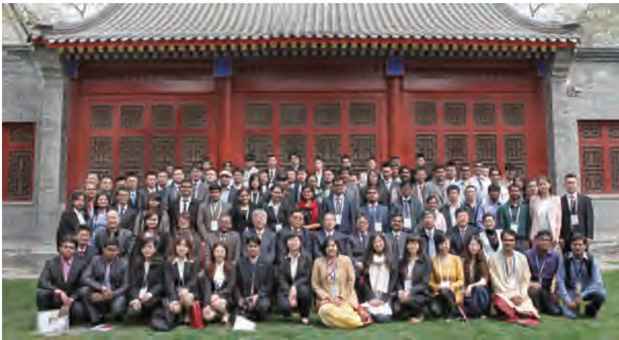
第二届中印大学生论坛与会者合影