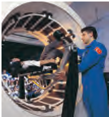
同学们在上太空模拟仪器课

活动组织者最大的慰藉，激励着我们为促进各国年轻一代的相互了解做更多实实在在的工作。土耳其太空教育营地的创始人卡亚·通加虽然于去年不幸去世，但他为促进国际友谊而作出的卓越贡献将被各国人民所铭记。我也为自己能够参与建立我会与土耳其太空教育营地的合作关系而感到荣幸。■