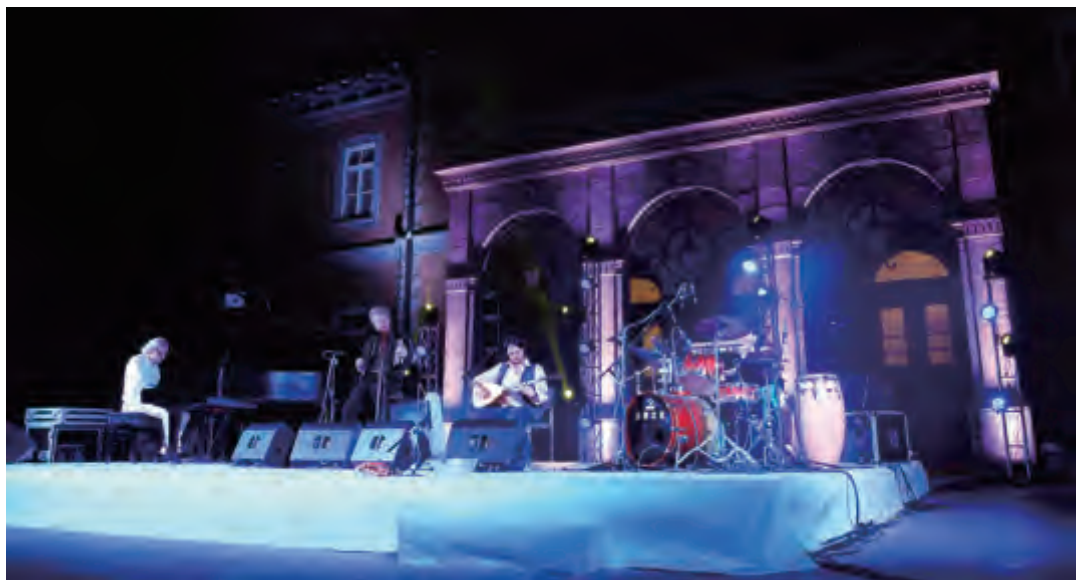
法兰克福多彩四重乐乐队在全国友协主楼前演出

会长在讲话中谈到的，世界要和平，国家要发展、人民要幸福都离不开民间的友好与信任。人民间的友谊可以通过各种方式获得，音乐就是一种高雅且愉悦的方式。音乐家给我们带来美的享受的同时，也在人们心中传播友谊和信任。这就是友协举办“中德友好之夜”音乐会的初衷。■