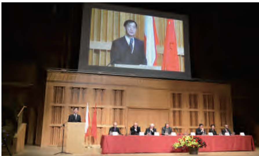
全国政协副主席李建平宣读中欧协会会长乌云其木格的致辞

自中波于 2011 年 12 月建立战略伙伴关系以来，两国地方和民间交往逐步活跃，在经贸、文化、教育、科技等领域的合作进一步扩展。作为中波双方合作举办的第一次大规模地方交流活动，论坛得到双方相关部门的高度重视。