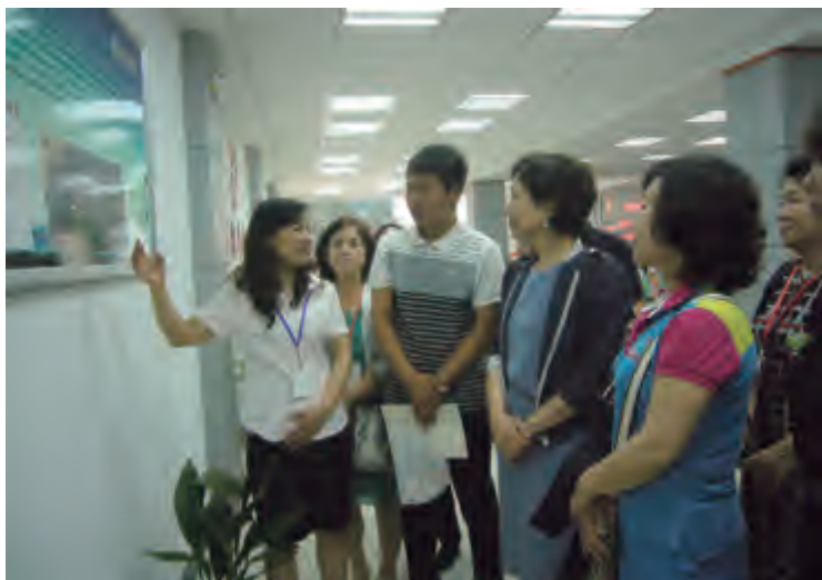
韩国益山代表团在镇江社区进行文化交流

曹丽虹副市长在致辞中说，文化是一个民族生存与发展的精神命脉，是人类共有的精神家园，而图书馆是知识的宝库、文明的殿堂、学习交流的最佳场所。“益山之窗”设在图书馆格外有意义，能够使更多的市民读者受益。15年来，两市频繁的文化交流吸引了越来越多的市民参与互动，使得国际化意识深植两市民间，已成为两市关系得以持续发展的源动力。李汉洙市长说，韩国有句谚语“十年变江山”，5年