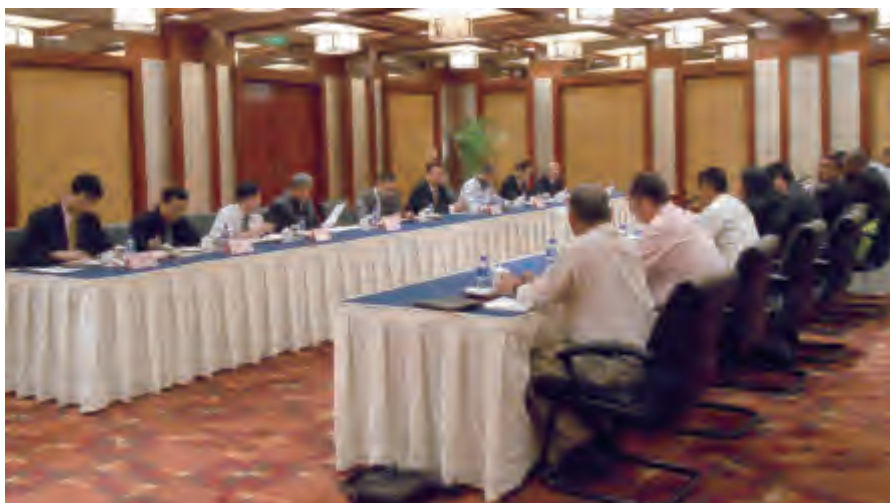
拉美市长代表团与北京市旅游委员会座谈