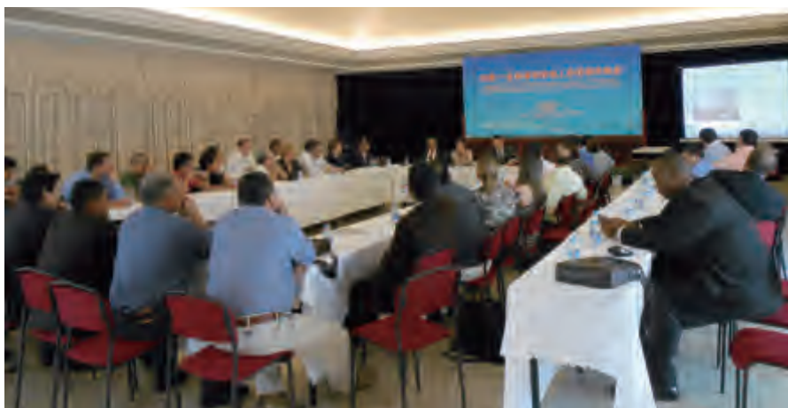
代表团与中拉友协负责人进行工作座谈