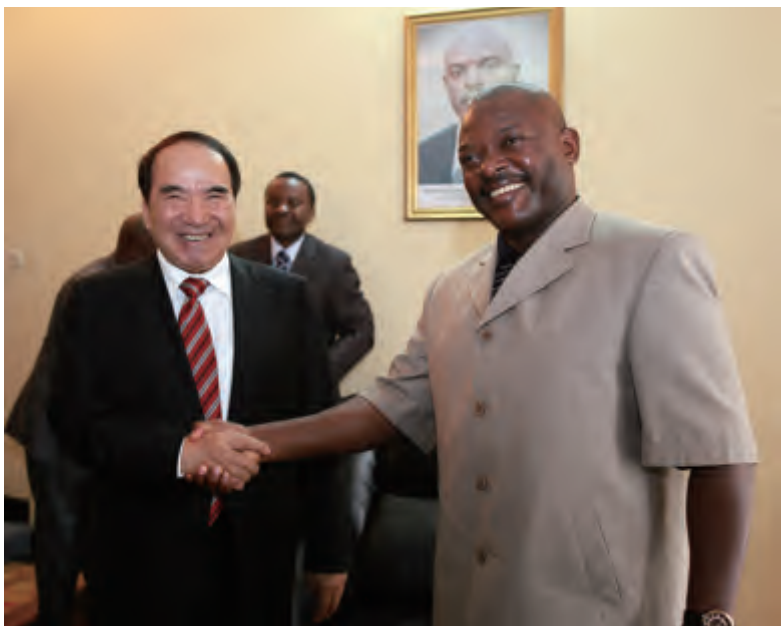
中非友协会长阿不来提·阿不都热西提拜会布隆迪总统恩库伦齐扎

阿不来提会长在与布、坦两国领导人会见时表示，中国与布、坦两国传统友谊深厚。近年来，中国与两国高层互访不断，各领域务实合作成果丰硕，在国际和地区问题上保持着良好的沟通与交流，在涉及彼此核心利益和重大关切的问题上相互支持。中非友协作为促进中非民间友好的组织，将进一步加强