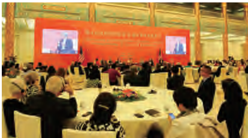
尼克松基金会代表团出席专题研讨会

口，加强农业方面的合作。医疗卫生方面也有巨大合作潜力，今年10月将在北爱尔兰召开经济论坛，其中包括医疗领域的议题，希邀请中国医疗方面相关人士参会。