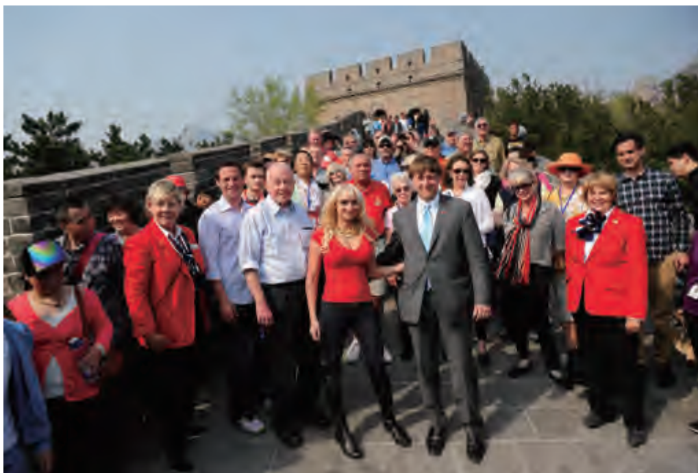
代表团一行登上八达岭长城

政府和人民高度重视中美关系，认为中美之间有必要面对面地澄清误解，携手共建新型大国关系。