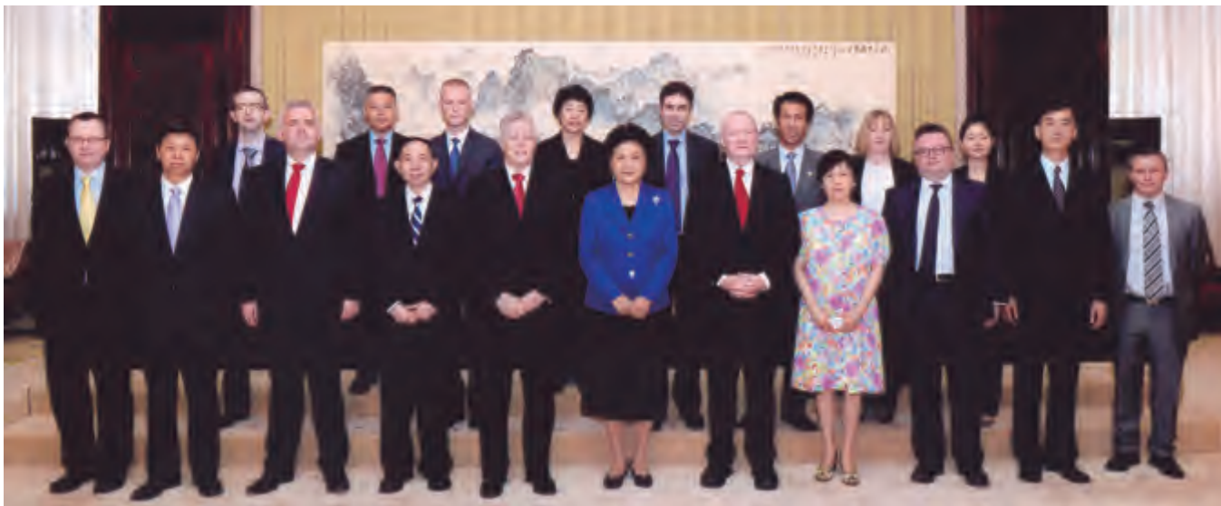
刘延东副总理会见英国北爱尔兰地方政府首席部长罗宾逊和副首席部长麦吉尼斯

关于双边合作，罗宾逊表示，去年刘副总理为奥斯特大学孔子学院揭幕，北爱尔兰希望能在此基础上更进一步，将汉语教育推广到中小学。农畜产品是北爱尔兰经济强项，期待扩大对中国的农牧产品如奶制品的出