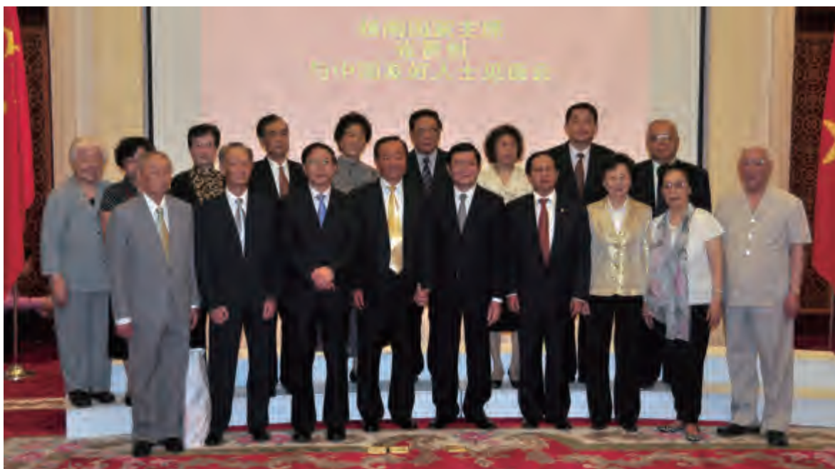
张晋创主席（前排左5）与中方主要人员合影

谈到此次访华成果时，张晋创介绍说，本着友好、坦诚、建设性和面向未来的精神，我分别与中国高层领导人进行了多场会谈和会面。双方都重申了高度重视并坚定发展越中友好关系和全面合作的基本方针，并将共同维护和平稳定的环境，实现共同发展。双方就进一步增进政治互信达成了很多共识，并同意将对方的发展视为自身发展的机遇。双方也同意加强各领域的务实互利合作。■