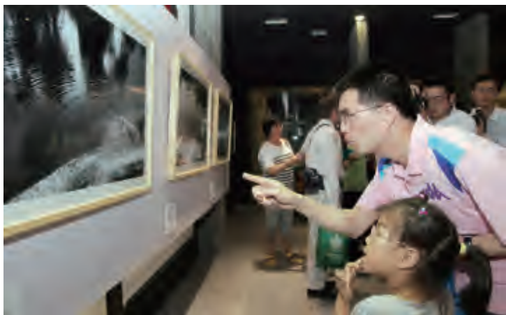
一位市民边走边给自己的孩子在讲解作品

期望：“中国梦”是当下热门词，我理解“中国梦”的意思是拥有美丽的环境和美好的生活，所以保护环境、珍惜水资源是构筑“中国梦”的基础。我认为青岛是美丽的海边城市，在这里举办以