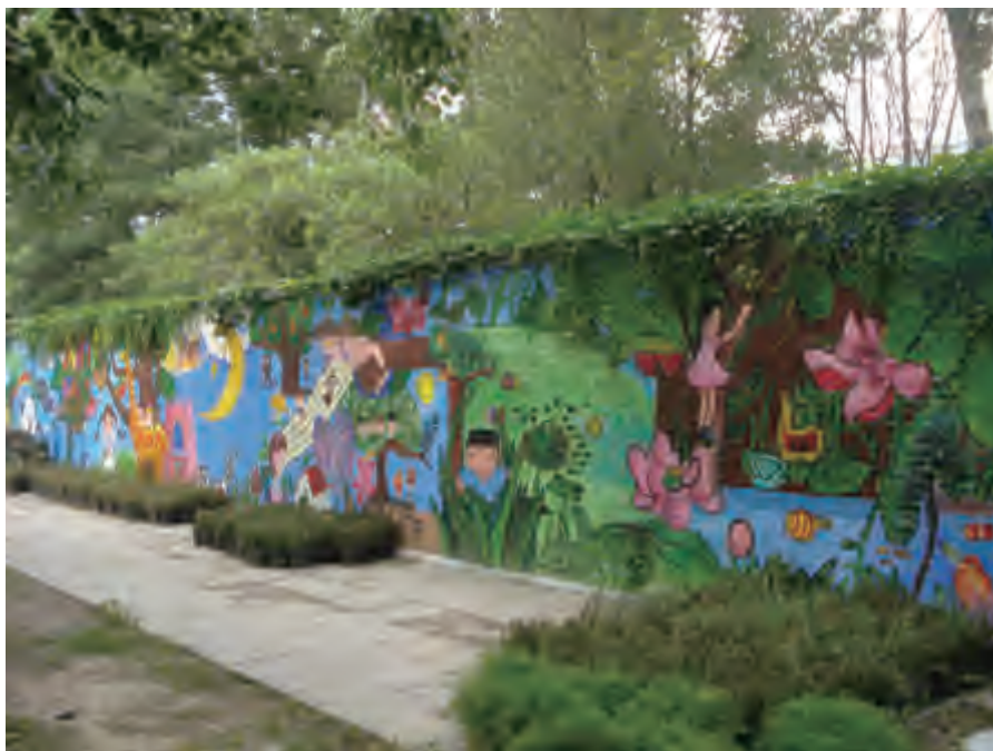
中国儿童中心园内 2009 年国际儿童壁画节作品

何时离开；年度的朋友 - 每年只联系一次；图利的朋友 - 总是向你索取点东西；磁铁般的朋友 - 到哪里都要带着你；多疑的朋友 - 总是担心被欺骗；神经质朋友 - 几乎问你 500 次是否还是他的朋友；“白日梦”朋友 - 总是沉浸在愉快之中；“虚拟或网络”朋友 - 如此接近却触摸不到；“银行家”朋友 - 总是愿意帮你解决“财务之困”；“吝啬鬼”朋友 - 与“银行家”朋友刚好相反；“独占”型朋友 - 不希望你有其他朋友；“大众”型朋友 - 太忙以致