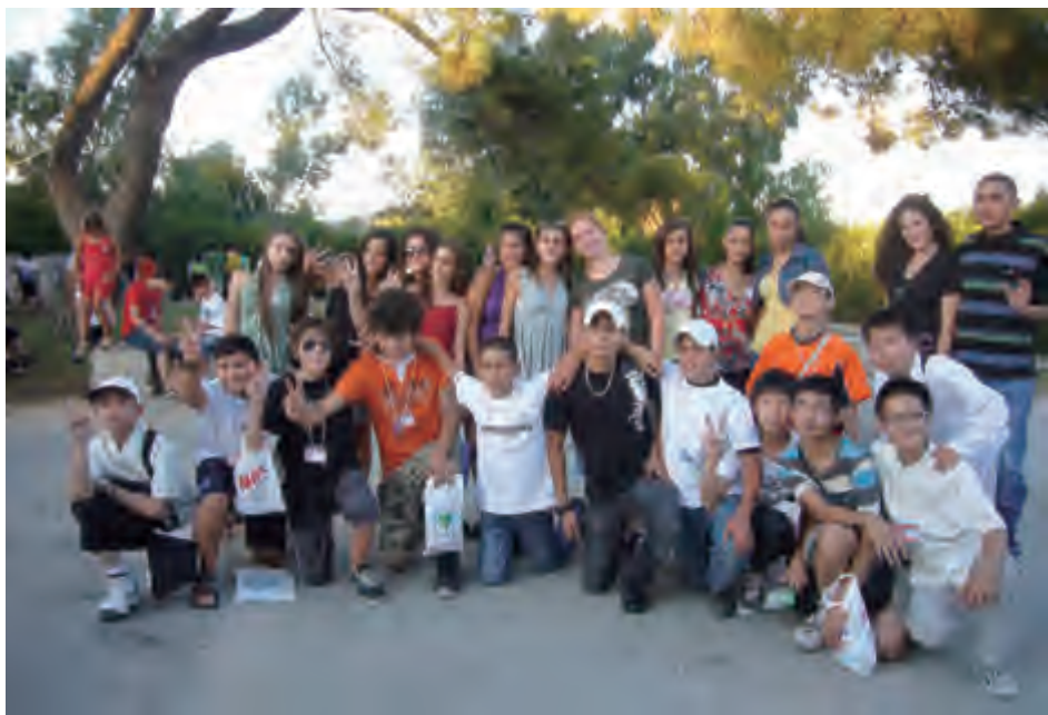
夏令营里的中外学生

四川省人民对外友好协会立即行动，组派12名学生于当年7月参加夏令营。从那时起，土耳其太空教育营地每年均向我会提供奖学金名额。我会已组派国内省市数十名学生赴夏令营学习。同时，我会也分别于2011年3月和2013年4月接待土耳其太空教育营地主要负责人访华，双方签署了合作备忘录。2012年7月至8月，在土耳其中国文化年之际，我会在土耳其太空教育营地举办了中国书画作品展，向土耳其和世界