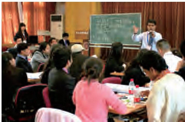
文化分论坛小组展示

4月26日下午，论坛进入正式讨论阶段。此次论坛分设文化、经济、外交三个分论坛，每个分论坛主席团成员又根据代表各自的文化背景和他们提交的参会论文将代表分为5个讨论小组。每个阶段的会议主要由小组自由讨论、小组展示、投票三个环节组成。由各分论坛代表投票选出的最佳小组代表所在分论坛于4月27日下午的展示环节中集中呈现各自的讨论成果。在为期两天的会议过程中，两国代表分别就“中印文化中女性形象对比”、“全球化对中印两国生活方式的影响”、“金融危机下中印经济面临的挑战与机遇”、“中印经济发展模式比较”、“军事实力增长与中印双边关系”和“媒体对中印两国关系的影响”等具体议题进行了深入的探讨和交流。他们激烈的辩论、高效的合作、精彩的展示和深厚的友谊构成了此次论坛的一道道亮丽的风景线。■