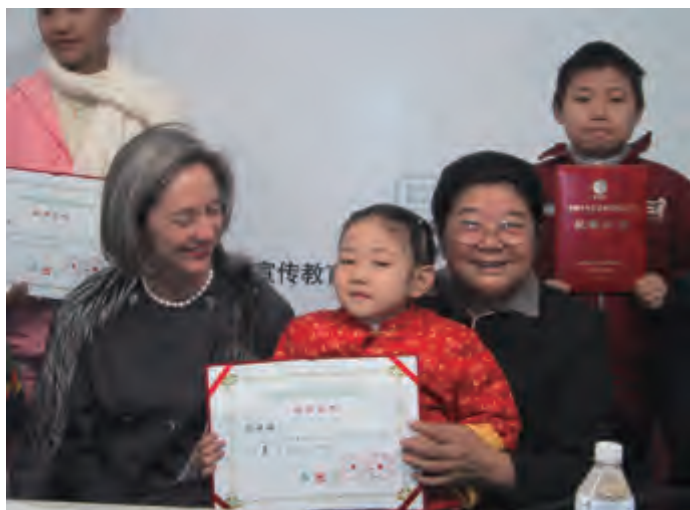
2000年，全国妇联副主席顾秀莲和美国驻华大使夫人萨拉·雷德与获奖儿童

随后相继出现了许多类似的组织，如“公共外交”等。然而，不幸的是“外交”一词当今被