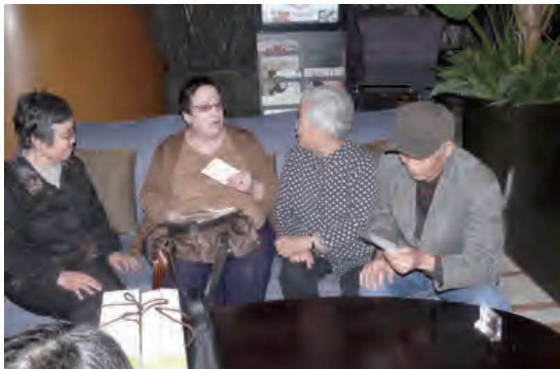
丽达见到了阔别已久的儿时伙伴

丽达对青岛的城市扩容和变化感到很惊讶。在她的印象中，青岛一直是一个很小的城市。我们带着丽达一家参观了奥帆中心、五四广场等一些新建的景点，丽达说现在的青岛很漂亮，但她更喜欢青岛的老街道。■