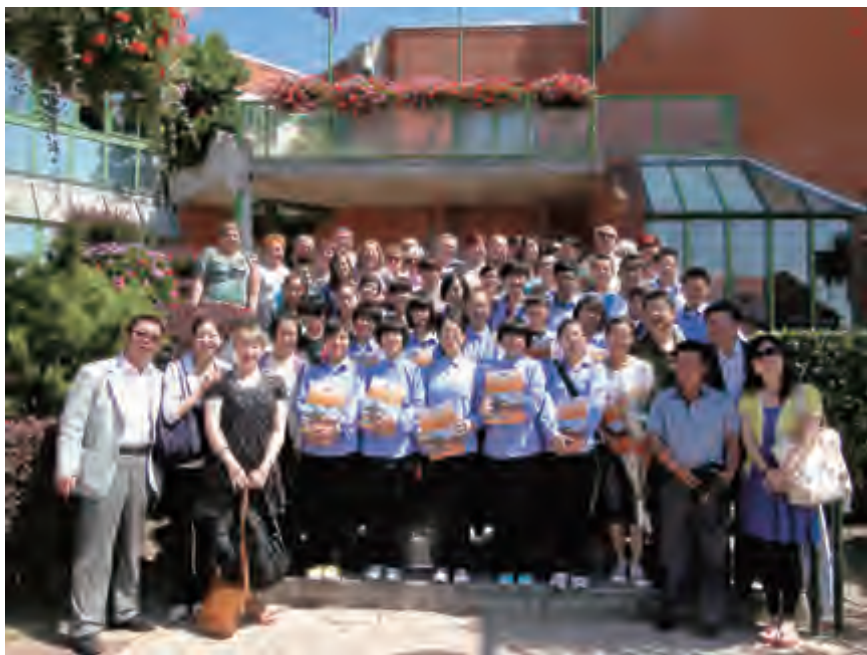
中国青少年代表团在杜西雷米纳市

基于 4 年来中法青年交流项目取得成功，加之此次中国青年代表团访法取得积极社会反响，援助会表示希望将两国青年的对话延续下去。■