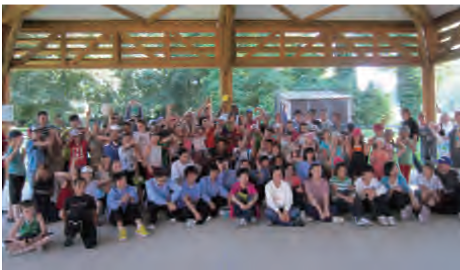
中国青少年代表团与法国无假期少年活动中心儿童联欢

作。脊梁协会一直作为援助会支持单位参与全国友协和法国人民援助会开展的各个项目，合作顺畅成功。此次该协会提出希望全国友协明年 5 月邀请 Manu Revol 乐队来华演出，形式为义演商演结合，义演旨在促进中法音乐交流，商演收入将继续