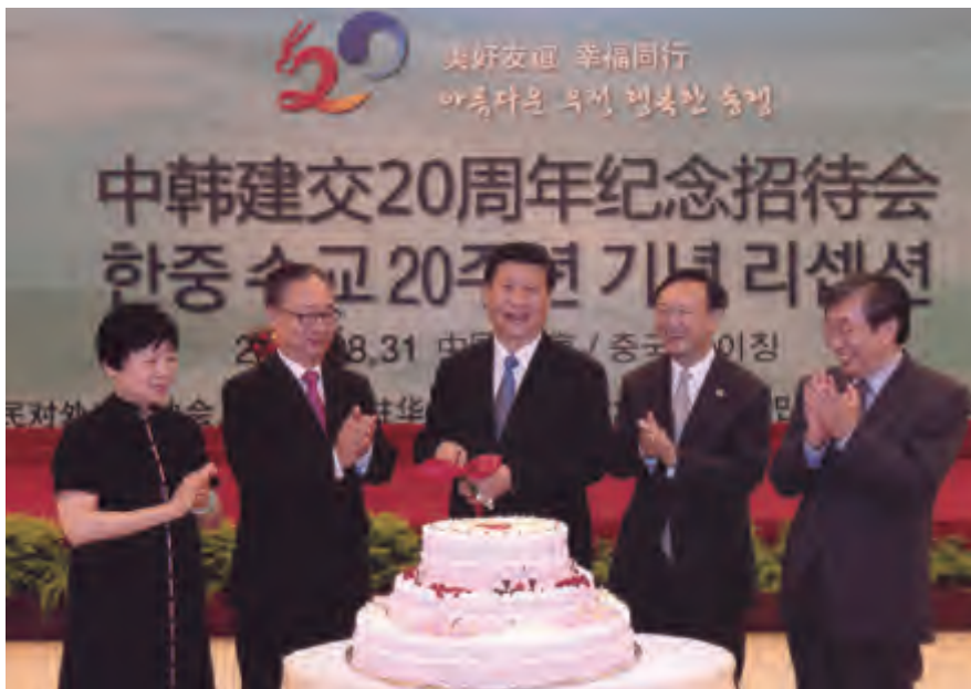
国家副主席习近平为纪念中韩建交 20 周年切蛋糕

中韩友协名誉会长罗豪才、外交部部长杨洁篪、中联部部长王家瑞、全国人大外事委员会主任委员李肇星、国务院侨办主任李海峰、