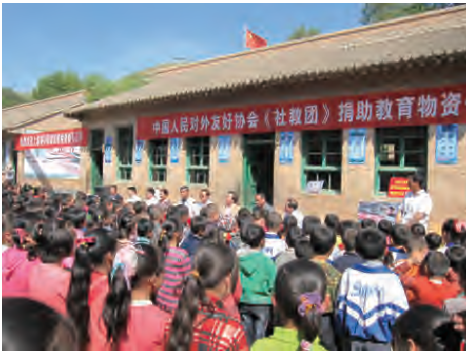
全国友协社调团在隆德县杨河乡小学向3所乡村小学捐赠学习用品

小的时候经常听母亲讲，我刚出生6个月就被送到别人家寄养，而妈妈作为一名党员，主动申请前往遥远的西海固开展“社会主义教育和社会主义改造运动”，和当地的农民同吃同住同劳动，一去就是好几年。当地自然条件十分艰苦，十年九旱，沟壑纵横，地无三尺平，无法种庄稼，所以能吃到的最好的东西就是土豆，每天喝的水要翻过两座山梁到谷底，用头顶着瓦罐运回来。当地有的人家十几口人只有一条土炕，一条破被子，全家只有一身像样的衣服，谁出远门谁穿；有的家里七八个孩子都衣不蔽体，锅台上的一个个小坑坑，就是他们吃饭的碗。