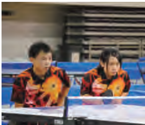
南昌市-高松市联队比赛中

8月20日上午，中日两国小选手们乘车前往居庸关，游览了中国最具代表性的世界文化遗产