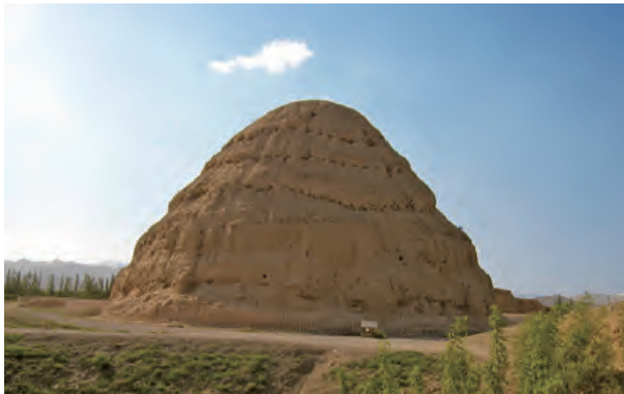
西夏王陵3号陵遗址

进入陵区，眼前出现了一座座高大的黄色陵台，在贺兰山下连绵展开，十分壮观。西夏王陵的设计非常考究，每座帝陵由阙台、神墙、碑亭、角楼、月城、内城、献殿、灵台等部分组成。党项人建造的陵台极为特别，呈八边七级、五级、九级塔式，却并不位于墓穴上方，丝毫没有封土防盗的作用。从出土的文物和陵墓的复原模型来看，建筑从设计上充分融合了汉族的华美大气，党项族的爽直彪悍和佛教的肃宁平和，实为建筑史上的奇葩。