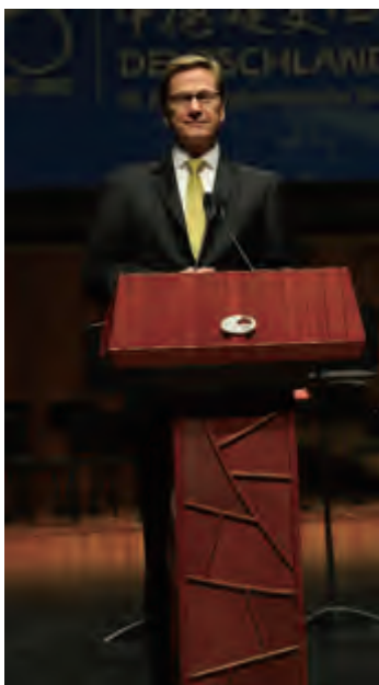
德国外长韦斯特维勒