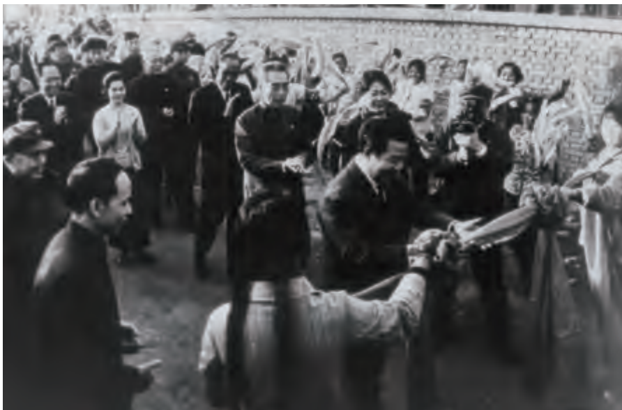
周恩来总理与西哈努克亲王亲临“长阳中柬友好人民公社”命名大会