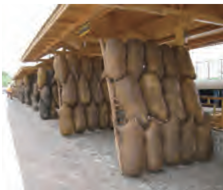
古老的运输工具——羊皮筏子