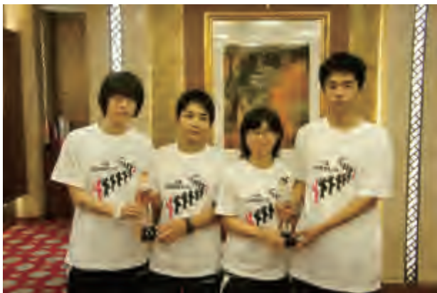
嘉定区—八尾市联队全体运动员合影

全国友协会长李小林、副会长井顿泉，中国乒协副主席于斌，日本乒协会长大林刚郎、副会长木村兴治，日本驻华使馆公使山田重夫等出席闭幕式，并为参赛队颁奖。