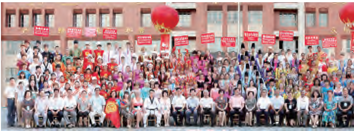
第三届中国新疆国际少儿艺术节上的中外少儿艺术团

23日下午，组委会在新疆人民会堂举办文艺汇演及闭幕式，自治区副主席靳诺在致辞时指出，新疆国际少儿艺术节是展示各国少年儿童聪明才智与艺术魅力的舞台，各国少儿朋友们以舞会友、以歌传情，用饱满