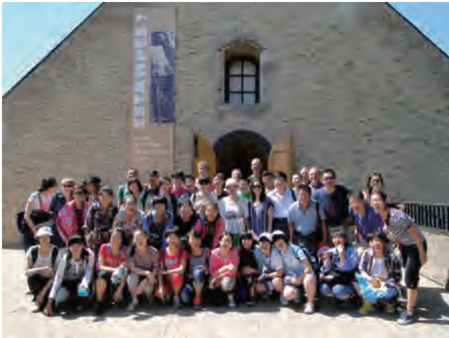
中国青少年代表团参观格拉夫利那市铜版画博物馆

此次中国青少年代表团访法，法国脊梁协会承担了在法期间所有政府招待会的安排及全程陪同。该