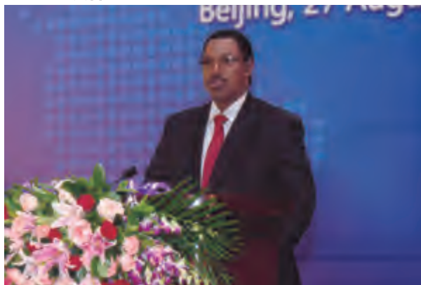
布隆迪第一副总统泰朗斯·西农古鲁扎在中非地方政府合作论坛上发言

论坛期间还举行了中非地方领导人峰会，与会嘉宾以推动地方政府合作，促进共同发展为主题，探讨双方共同关心的热点问题，如资源开发、基础设施建设、产业结构