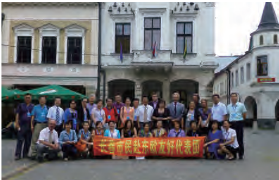
斯洛伐克日利纳市副市长会见代表团

代表团在斯洛伐克期间,日利纳市副市长布莱佐夫斯卡女士在市政府欢迎长春市民友好代表团来访。日利纳地区工商联合会会长米苏拉向代表团做了工商企业推介,希望不断加强与长春市的经贸合作,并与长春市企业代表进行了洽谈。■