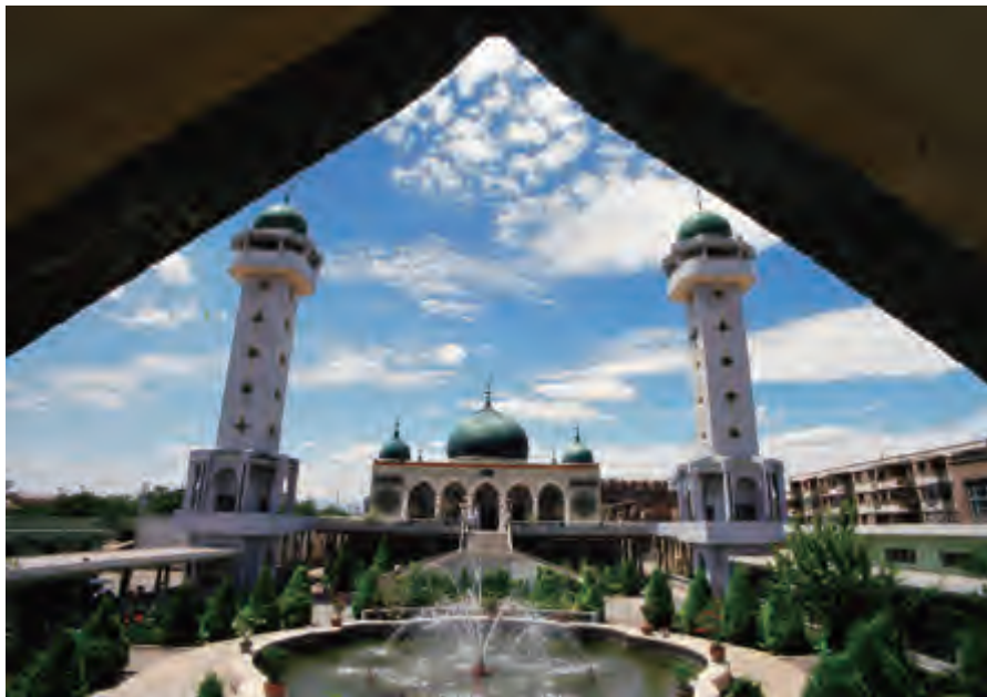
银川南关清真大寺

回族现有人口约982万（2000年人口普查数据），是中国少数民族中人口较多的民族之一，也是分布最广的少数民族。回族主要聚居于西北的宁夏、新疆、青海、甘肃，其他地区如山西、河北、天津、北京、上海、江苏、云南、河南、山东等地，也有不少回族聚居。回族的通用语为汉语。在日常交往及宗教活动中，回族也保留了大量的阿拉伯语和波斯语的词汇。回族信仰伊斯兰教，在居住较集中的地方都建有清真寺