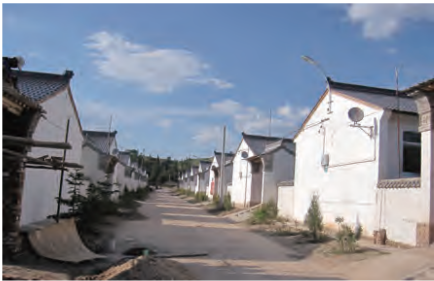
德隆县沙塘镇的移民新村——清泉村

扶贫移民大大提高了贫困群众的生活水平和家庭收入，农民收入 30 年增长了 90 倍，缓解了贫困地区