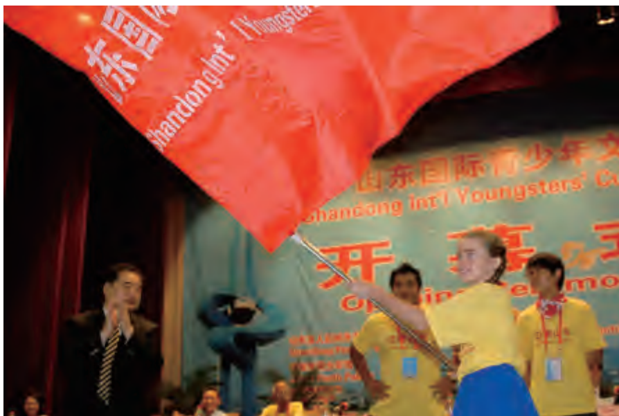
山东省人大常委会副主任于建成向青少年代表授旗

8月4日至9日，“2012山东国际文化交流周”先后在济南、广饶、青州、昌邑进行巡演活动。8月4日晚，各国艺术家在山东大厦进行了济南首演，各具特色的民族舞蹈、歌曲和乐器演奏为观众带来一场文化大餐。印度卡纳塔克邦民族艺术团的舞蹈《花祭》，华美的衣着、优雅的舞步掀开了印度祭祀舞蹈神秘的面纱；波兰民族舞蹈团载歌载舞的《波兰风情》表演，流露出浓