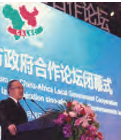
国务委员戴秉国在中非地方政府合作论坛闭幕式上讲话

每次论坛期间将举办中非工商企业界峰会，鼓励中非工商企业界之间建立联系，开展公益慈善活动。