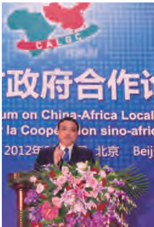
李克强副总理在中非地方政府合作论坛上致辞

8月27至28日，首届中非地方政府合作论坛在北京国家会议中心隆重召开，国务院副总理李克强出席开幕式并致辞，中国和来自非洲40多个国家及国际组织的地方政府官员、企业家代表1700多人与会。论坛还举办了中非地方领导人峰会及中非经贸论坛两个重要分论坛。国务委员戴秉国出席了闭幕式并致辞。