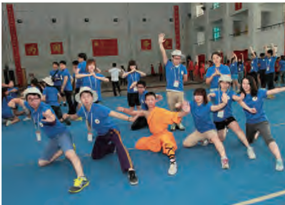
韩国青年在少林寺武校学习拳法

外交部副部长张志军在会见代表团时说，中韩两国各领域合作蓬勃发展的同时，青年交流日益增多，凸显良好势头。今年是中韩建交 20 周年，也是中韩友好交流年，第三批韩中青年友好使者代表团的到来意义重大。他说，青年是国家的希望和未来，肩负着国家建设和中韩友好事业的重任，是中韩友好的接力棒，必将代代相传。他鼓励韩国