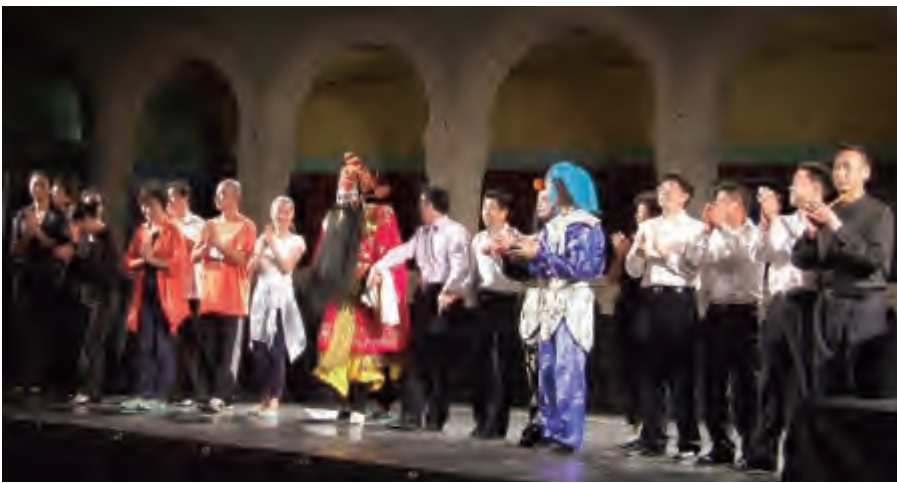
中国京剧代表团在法国米卢市演出结束时谢幕

代表团访问的最后一个城市——孔克市，被誉为“法国最美丽的村庄”。该市保护完好的老城区及富有文化气息的新城区每年夏天吸引来自欧洲各地上百万的游客，在法国和欧洲影响力都很大。孔克市长对华十分友好，经儒弗莱主任介绍得知全国友协主管中外友城事务后，立即表示，希望通过全国友协和法国经济文化国际合作发展协会的协助，在中国物色一个友好城市，以拓展中法两国地方政府在各领域的交流与合作。■