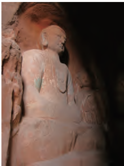
第 51 窟中一尊 6 米高坐佛

上，山间以梯桥连接，工程之浩大可见一斑。在古代，它是西出长安后第一个规模最大的佛教石窟寺，吸引着南来北往的旅人。须弥山现存石窟 150 多座，尤以第 5 窟、第 33 窟和第 51 窟最具代表性。