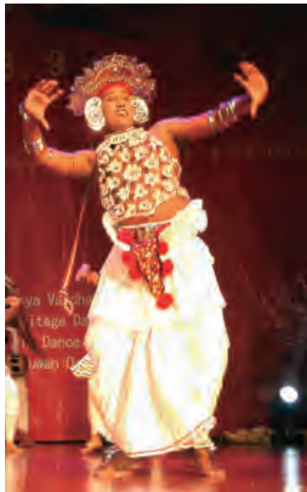
斯里兰卡民族舞蹈

心的沟通，情的碰撞，台前幕后，所到之地，友谊之花处处绽放。一周的时间转瞬即逝，仿佛山东与各国艺术家、青少年才刚刚相识，却又即将分别。在闭幕式上省友协领导指出：“青少年是世界的未来，肩负着促进世界和平与发展的重任，大家将来一定能为促进国际文化交流、维护世界和平与发展作出贡献。”他的讲话得到了各代表团的肯定和认可。韩国代表在讲话时用刚学到的中文高声喊道：“我们爱山东！”表达了各国青少年对山东的真挚情谊。分别之时，一张张挂着热泪的笑脸，一个个满带深情的拥抱，一句句“定会再见”的承诺，将美好的记忆定格在这一刻。而这些踏上返程的各国青少年，会将齐鲁大地的风景、文化、历史和山东人民的友好情谊印在脑海里，陪伴他们一路成长。■