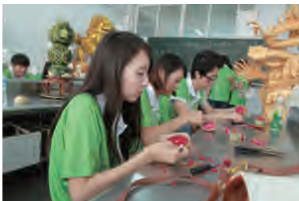
韩国青年学习水果雕刻

在欢送晚宴上，代表团、志愿者和郑州市旅游职业学院的同学们一起，精心准备了一场精彩的演出。太极拳、双节棍、中国京剧、韩国戏曲、歌舞串烧无不展示着年轻朋友们的朝气蓬勃，多才多艺，能歌善舞，舞台上演绎的是中韩文化的完美结合。志愿者天天熬夜排练的曳步舞调动