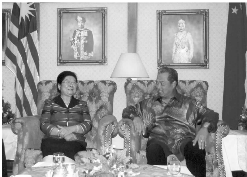
马来西亚副首相慕尤丁会见中国东盟协会会长顾秀莲

济领域,确定将中国东盟商品展和中国东盟经贸洽谈会作为大会内容,每年配合大会定期举办。同时欢迎在此机制下举办多边和双边的经贸活动,如:2009年将在柳州举办中国-东盟女企业家创业论坛,在上海世博会期间召开第12届中国-印尼经济研讨会。在文化与旅游领域,确定将中国东盟青少年展演纳入大会框架,与大会同期同地举办。与会成员组织一致认为,借双方庆祝建交周年之机,可大力推动双方在文化旅游方面的合作。在教育领域,确定将中国东盟教育论坛纳入大会框架,每年配合大会举办。同时鼓励开展彼此间的人