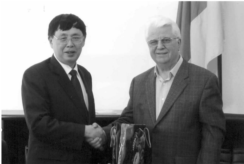
乌克兰前总统克拉夫丘克会见陈昊苏会长

代表团还会见了乌克兰地方政府协会。该协会负责乌克兰中央政府与地方政府的联系，协调中央与地方的关系，与国外地方政府组织开展合作，交流经验。陈会长表示愿与该组织建立联系，发展合作。