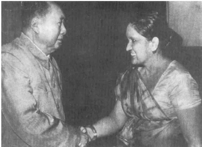
毛泽东主席热烈欢迎斯里兰卡总理班达拉奈克访华

中国是在多方面向斯里兰卡提供援助的主要国家之一。班达拉奈克会议中心及西丽玛沃·班达拉奈克展览中心就是两国良好关系的佐证。建成于 1971 年的会议中心耗资约 3500 万卢比。而应已故总统贾亚瓦德