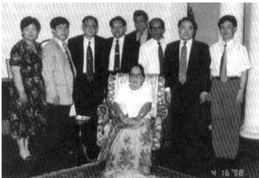
1998 年，斯里兰卡前总理班达拉奈克夫人会见对外友协代表团

月 1 日中国国庆，如学生作文比赛、座谈会、公众集会、摄影展等每年都举办。我们是斯里兰卡唯一的对华友好组织，在中国使馆的协助下，举办了 5 个中国电影节。两国建交 30 周年、40 周年和 50 周年纪念时，更举办了大型庆祝活动。为纪念外交关系 50 周年（2007），我们出版了一本僧伽罗语介绍中国的书。该书分发给全国所有学校。它是目前唯一的以僧伽罗语出版的有关中国的书籍。