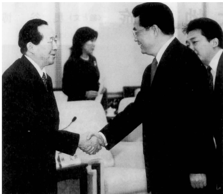
2006 年 3 月 31 日，胡锦涛主席会见日本日中友好七团体负责人时与辻井乔亲切握手

界一极独大的美国。在这样的指导思想支配下，企业为了盈利而随时可以裁减人员，使社会整体处于不稳定的状态之中，并最终导致国内市场显著萎缩。即便如此，执政的政治力量却几无能力觉察到人们的不安感日益加剧，贫富差距在不断扩大。于是，在选举时国民最终还是对这种政治势力动用了否决权，尽管这一权利运用得并不十分充分，但至少使我们看到了政治变化的迹象。恰逢此时，我们迎来了庆祝新中国成立 60 周年的时刻。