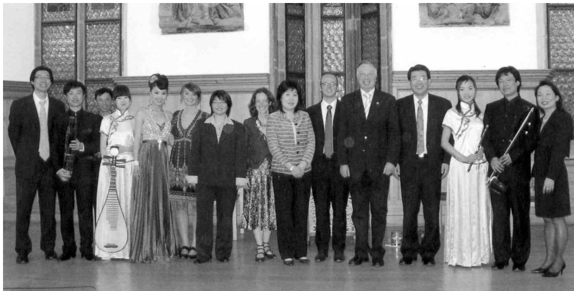
中国民乐小组与德国友人在德国纽伦堡市政厅

年来与东欧国家之间开展文化教育合作和交流的情况，介绍了对外友协的组织构成和工作范畴，并对中国东欧青年之间的交流提出了期望。中国驻匈牙利大使馆教育处官员、匈牙利教育文化部官员、孔子学院院长及与会学者、文化界代表 100 余人出席了研讨会开幕式。开幕式后，来自中国、东欧、日本等地的学者们以“汉学研究的理论、研究方法及中国形象”、“东欧汉学史”、“东欧汉学传播与文化交流”以及“中匈关系史”等为题进行研讨。晚上，中国民乐小组在