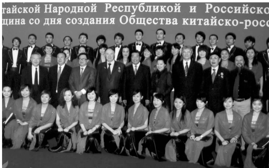
贾庆林主席及出席庆祝中俄建交 60 周年招待会的中俄嘉宾与合唱团合影