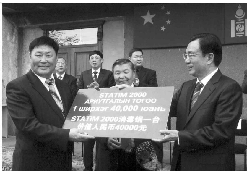
贺国强(右1)向蒙方捐赠医疗设备