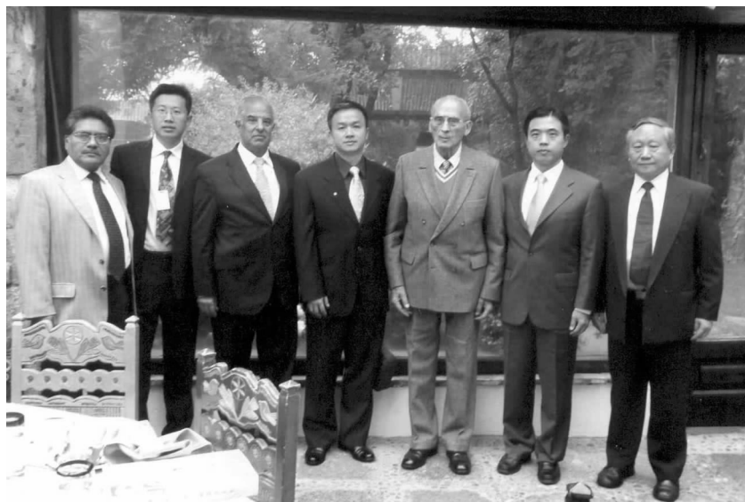
墨西哥前总统塞迪略(右3)会见对外友协代表团

对外友协代表出席了由墨西哥第三世界经济与社会研究中心承办的“和平与发展的新模式”和“回顾联合国宪章(第109条)全球发展和世界安全”两场座谈会。在座谈会上，该研究中心总干事努涅奥在发言中，盛赞中国特色的发展模式，称中国没有采取西方的发展模式，而是开辟了一条符合其自身国情的新道路，并取得了辉煌的成就。中国经验值得其他国家，特别是发展中国家借鉴。我代表团在与该研究中心工作会谈时，就推动青年人交流和共同举办研讨会等进行了商谈。□