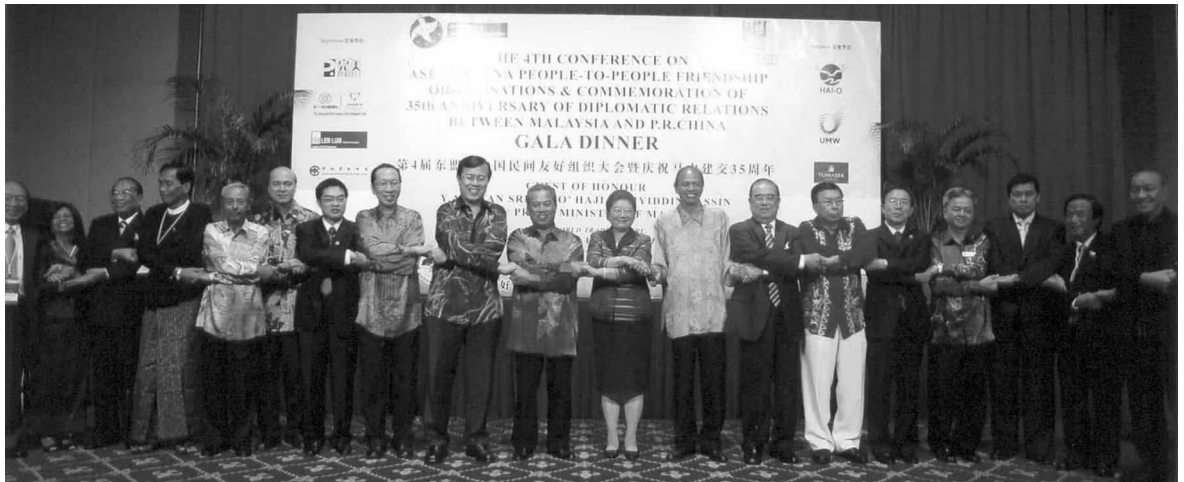
各国友好组织负责人在大会上

员交流培训。在卫生领域，各方高度评价“2008 中柬友好光明行”，希望中方在做好“2009 中越友好光明行”同时也在其他医疗卫生方面与东盟各国合作，如在初级保健和健康发展方面的合作。在体育与青少年方面，各方一致同意适时开展青少年体育比赛和夏令营等活动，加强青少年相互了解和沟通。通过本次大会，中国东盟民间友好合作更加务实，内容更加丰富，民间“10+1”合作机制得到进一步巩固与发展。