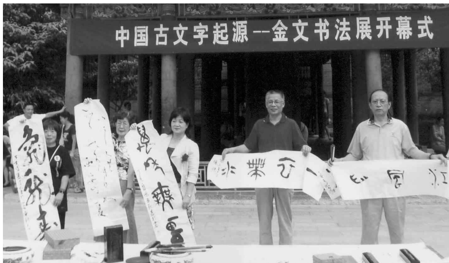
本文作者(中)与中国书法家交流