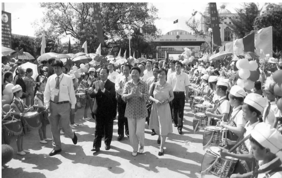
2009 中越边民友好大联欢闭幕式

黄担主席评价此次“大联欢”是生动体现两国人民友好情意的机会,并表示,越南祖国阵线愿和各友好组织和团体一起,大力宣传越中友好,为增进两国人民之间的了解和互信发挥积极作用。