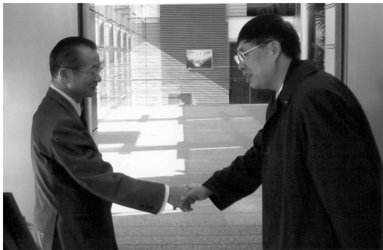
日本官房长官河村建夫(左)与陈昊苏会长(右)亲切握手

11月18日晚,为纪念中日和平友好条约缔结30周年,日本日中文化交流协会在东京举办题为“展望中日文化交流未来”的演讲会,日本文化界等各界人士约300人出席。