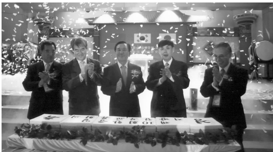
中日韩友好城市大会开幕式

专业演员、民间艺人和艺术爱好者从各地前来参加活动,与外国代表团以及南京市市民展开了近距离的接触与交流。13 个国家的艺术团体参加了“结谊五洲”文艺演出,在 2 个多小时的演出中,观众自始至终与演员形