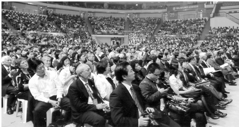
江苏省国际友好城市交流 30 周年纪念大会会场

这次纪念活动既包含了在经贸、教育、环保、现代服务业等领域对外合作这些实质性内容，还有精彩纷呈的文艺节目，以及市民交流这样贴近群众、互动性强的交流活动。在市民交流活动中参加人员达到 2000 多人。来自 11 个国家的文艺团体表演了各具特色的节目。有 5 个国家和省内 10 个市的友好团体在现场设置了 22 个互动展示区。南通市组织了杂技团、木偶团，宿迁市组织了武术队，徐州市组织了农民乐团，淮安、泰州、盐城等市组织了民间手工艺表演等。全省各市共有 300 多名