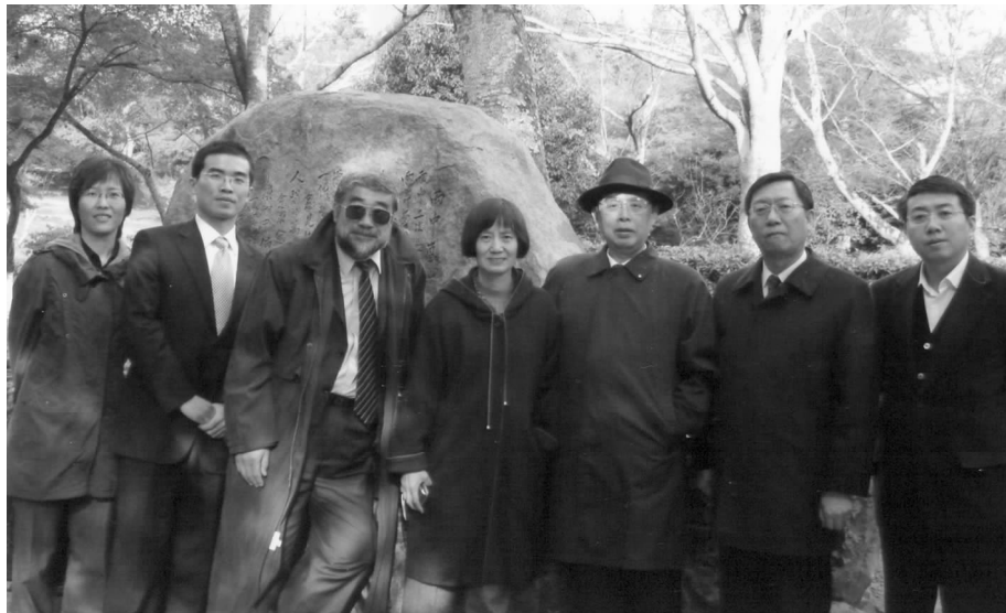
对外友协代表团一行在日本京都岚山周总理诗碑前

日中文化交流协会□井乔会长在演讲会上表示,近几年两国政治关系回暖令人倍 (下转第48页)