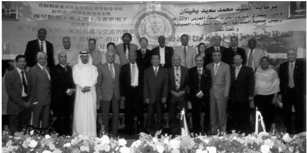
部分与会代表在开幕式上合影

会会长铁木尔·达瓦买提，东盟副秘书长希玛·布侯斯先后致词。大家对首届友好大会以来，中阿民间友好工作在加强中阿传统友谊，推动中阿政治、经贸、文化、教育及地方政府交流与合作方面所发挥的重要作用予以积极肯定和高度评价，对民间友好工作未来的发展寄予厚望。