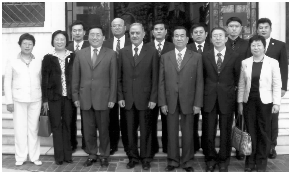
叙中友协主席穆罕默德·布希坦会见中方代表团部分成员

木卡姆是中华民族文艺百花园中的一朵奇葩,是中华民族灿烂文化宝库中的艺术瑰宝,是世界文化艺术发展史上不可多得的大型文艺百科全书。2005年11月25日,中国新疆维吾尔木卡姆艺术被联合国教科文组织正式批准为“人类口头与非物质文化遗产代表作”。由此,木卡姆以其完美的艺术结构和独特的艺术魅力日益受到世界的关注。□