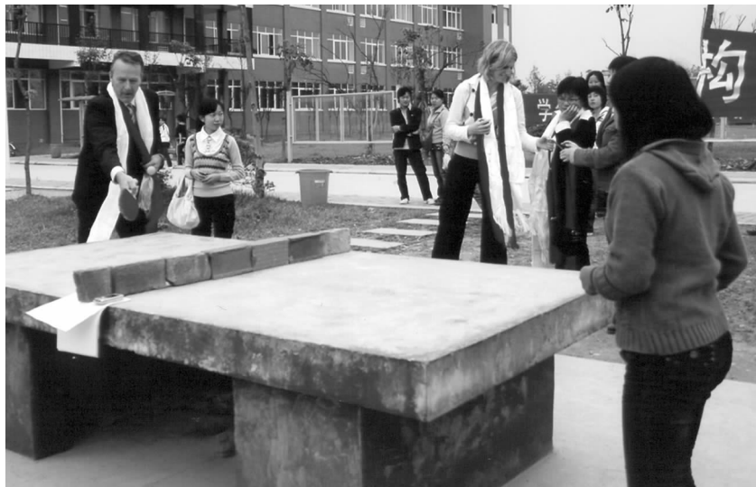
盖里马副省长在阿坝师专与学生一起打乒乓球

盖里马副省长对此次访问四川感到满意,他说:“我是第一次访问中国,来到四川,没有想到中国西部的经济如此充满活力,地震之后的四川如此快速地得到恢复,当欧洲经济陷入困难的时候,我在中国四川看到了生机和希望,真舍不得离开,我一定会再来。” □