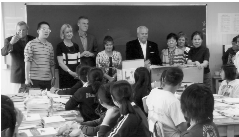
代表团访问北川中学

代表团一致认为中美关系是世界上最重要的双边关系之一,此次亲身访问使他们对两国关系有了更加深刻的认识。他们表示支持自由贸易和全球化,认为中美贸易给双方都带来实惠,美国内反对中美贸易的声音主要是出于政治目的。劳顿表示,目前的中美两国关系比历史上任何时候都重要。无论是在贸易、投资、金融领域还是在环保、教育、能源方面,两国都拥有广泛的共同利益。两国的未来是紧密联系在一起。除负责经济、环境等事务外,副州长的重要工作之一就是发展民间交往。中美民间交往是两国友好的基础,使两国的友谊合作延伸到社会各个层面。感谢中国政府和人民邀请他们访华,得以接触中国普通民众,增进他们对中国的友谊与了解。在美国处于困境的时候,来自中国的友谊显得格外珍贵。费德勒副州