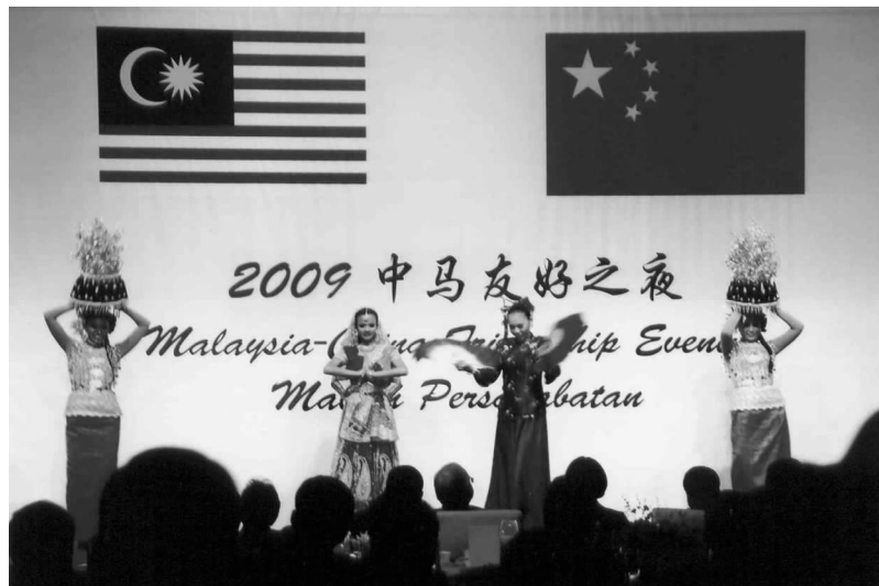
马来西亚艺术家在宴会上表演节目