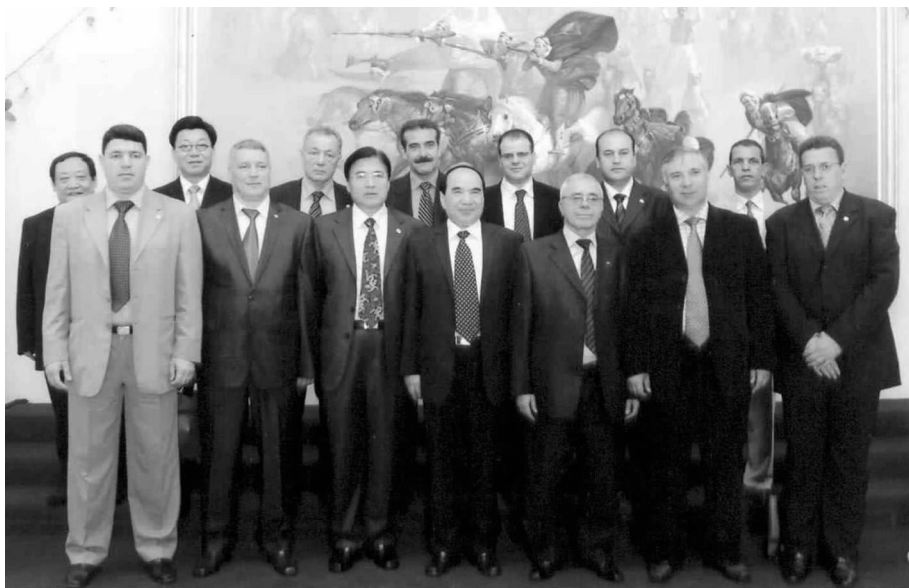
阿尔及利亚国民议会阿中友好小组主席赛义德·布哈贾及成员与代表团在一起

阿尔及利亚齐阿里议长表示，阿中友谊源远流长，可追溯到阿独立战争时期。阿尔及利亚各政党虽然政见或有不同，但对发展对华关系是完全一致的，都对中国在阿独立