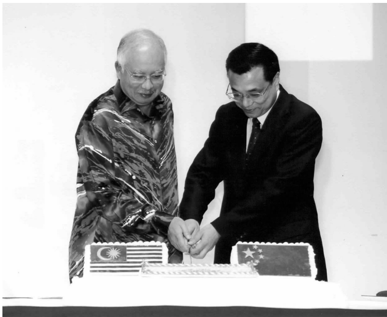
李克强副总理和马来西亚总理纳吉布在宴会上共切蛋糕

纳吉布总理说，我们对35年前两国老一辈领导人开创的马中关系新历程充满敬意，对马来西亚因此成为第一个与中国建交的东盟国家感到自豪。目前马中两国都在加速发展，双方务实合作存在巨大空间。马新一届政府愿全面加强对华合作，与中方一道