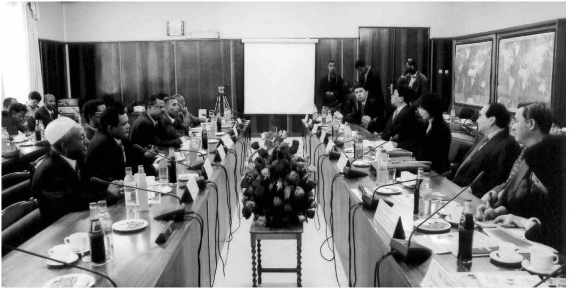
全国政协副主席、中非友协会长阿不来提·阿不都热西提一行与埃塞俄比亚联邦院议长德盖菲举行会谈