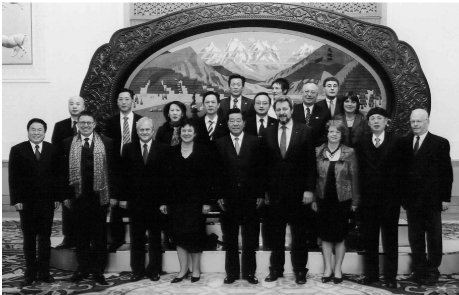
全国政协主席贾庆林会见奥地利联邦议会议长一行