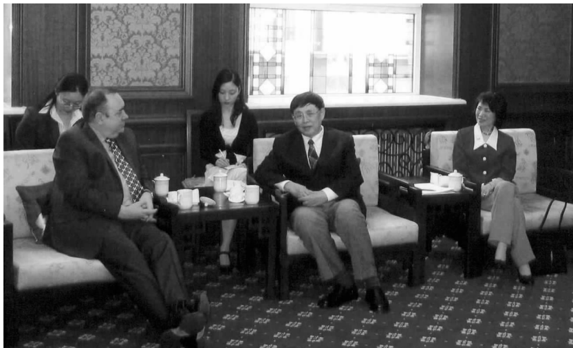
陈昊苏会长与萨蒙德首席部长亲切交谈。右1为中国驻爱丁堡总领事谭秀甜

4月10日上午,国家质检总局局长王勇会见了首席部长一行,双方就马铃薯等农产品、食品检验检疫及威士忌酒等产品的地理标志注册登记等问题进行了实质性沟通与交流。