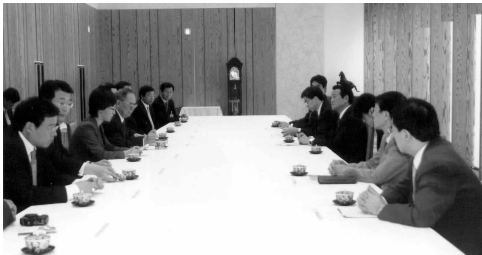
日本首相麻生太郎会见宋健会长一行