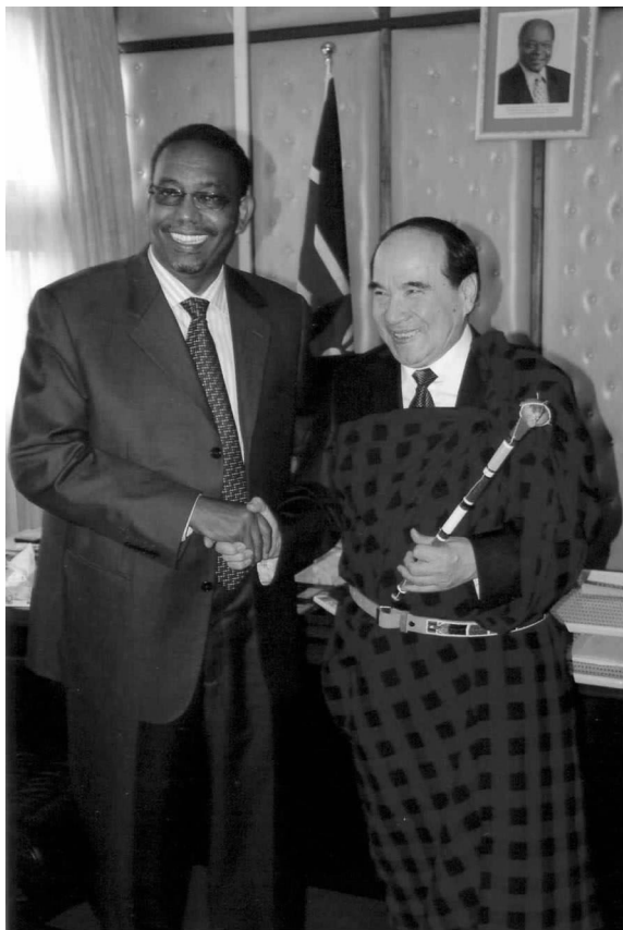
肯尼亚国民议会副议长法拉会见全国政协副主席、中非友协会长阿不来提·阿不都热西提

形势下,埃中双方应加强协调与合作,寻求解决危机的途径。中国对非洲的关注将有利于非洲经济的发展,中非合作论坛和中国在埃塞俄比亚的投资为埃塞俄比亚带来了许多实际利益。埃方将会在论坛框架下继续深化双方的务实合作,进一步加强埃中地方政