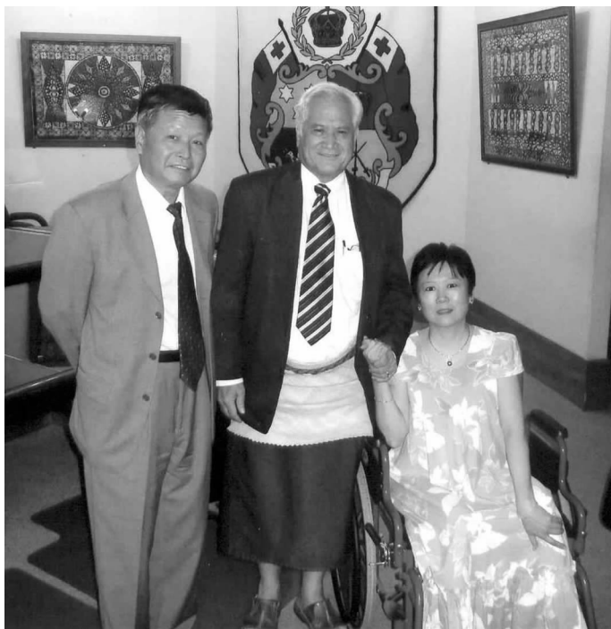
左 1 为中国驻汤加大使樊桂金