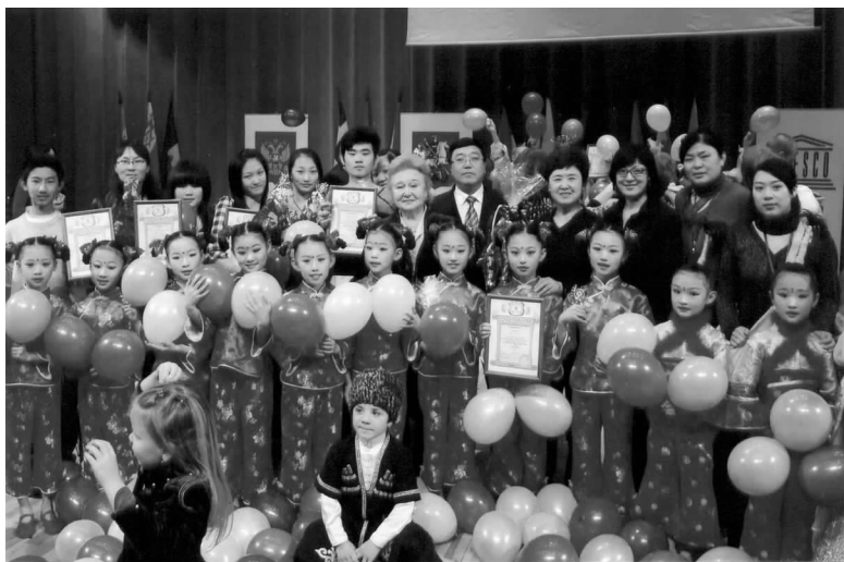
大连青少年艺术代表团在莫斯科国际青少年艺术创作节上

参加第 6 届“开放的欧洲”莫斯科国际青少年艺术创作节。 “开放的欧洲”莫斯科国际青少年创作节每年举行一次,由俄联邦议会联盟委员会、俄联邦文化部和俄联邦联合国教科文组织事务委员会主办,俄中友协、俄罗斯国际文化促进会共同承办,来自世界 18 个国家的