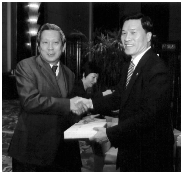
青岛市长夏耕与泰国前副总理披尼交换纪念品

等行业的知名企业赴泰国进行对接,为其赴泰拓展业务提供便利和必要的支持。泰国商务部拟于今年6月份在青岛举办“水果节”,将青岛作为泰国商品在中国北方的物流中心;依托青岛市对外友协与泰中文化经济协会,互设合作促进机构,推进合作事项。泰国清迈府新任府尹将于近期率团来访,探讨并深化各领域合作,进一步加强双方的友好关系;探讨建立高等学校教育交流机制,加强双方在师资、交流学生等方面的合作。