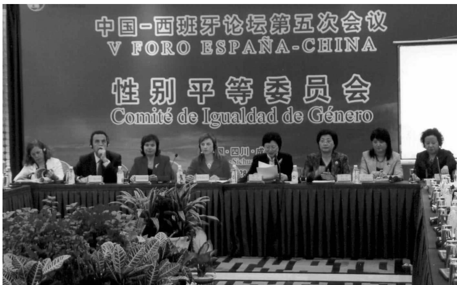
性别平等委员会成立并举行会议