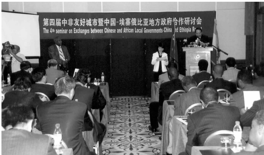
全国政协副主席阿不来提·阿不都热西提在第四届中非友好城市暨中埃地方政府合作研讨会上致词