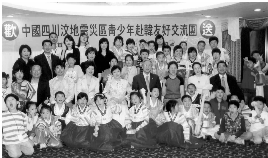
代表团在韩中文化经济友好协会举行的欢送会上

韩中文化经济友好协会还特意为来自中国南方内陆省份的孩子们安排去室内滑雪馆体验滑雪、参观儿童公园接触各种小动物、参观科技馆增强孩子们探索科学的热情、游汉江和游览世界上最大的室内游乐园之一——乐天游乐园等活动。孩子们乐观向上的生活态度和超强的自理能力、相互间关爱和团结协作精神感动了韩方的各界人士。“感恩之旅”不知不觉演变成“感动之旅”。中韩两国少年儿童用他们自然朴实、纯洁的心灵，感动着对方，感动着上至总统、下至普通百姓。□