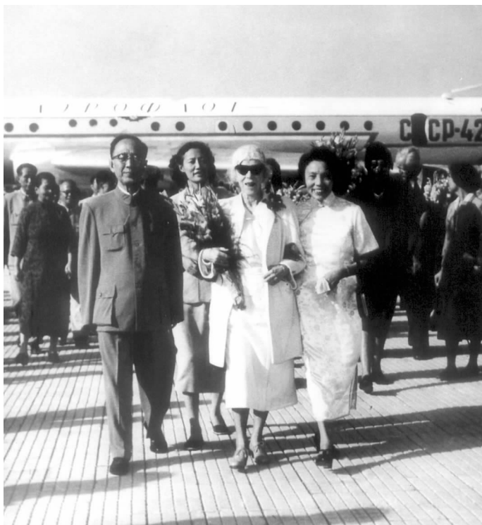
全国人大常委会副委员长郭沫若(左1)、全国妇女联合会主席蔡畅(右1)到机场迎接比利时王太后伊丽莎白

西欧和北欧的许多国家至今保留王室,作为其国家的象征,在所在国家的社会和人民群众中有相当的影响,而且各国王室之间的交往也比较活跃。因此中国和这些王室中的一个有了来往,则很可能和其他王室的关系也会有缓和和改善。但是在欧洲这么多的王室中选择和谁打交道呢?对外友协后来将目光锁定在比利时。比利时是欧洲比较古老的王国,而且与其相邻的另外两个国家——荷兰王国和卢森堡大公爵在经济上和政治上结成联盟,在西欧有一定的影响;二战以后,虽然也是北大西洋公约组织的成员,但是与世界上不同社会制度的国家都有较多来往和友好的关系;比利时历来国内的民主气氛比较浓烈,各种不同的思想、观点能够得到表述的机会:马克思和恩格斯所著的《共产党宣言》就是在比利时首都布鲁