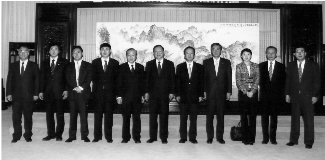
唐家璇国务委员会见日本国会年轻议员代表团

的使命。中国政府始终高度重视中日关系,愿本着“以史为鉴、面向未来”的精神,发展中日睦邻友好合作关系。虽然近年来两国关系遇到严重困难,但中方致力于中日和平共处、世代友好、互利合作、共同发展这个崇高目标的决心是坚定不移的。