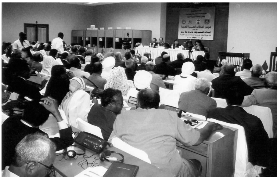
中阿友好大会会场

全体与会代表还一致同意建立中阿友好大会机制，确定每两年召开一次大会，由中阿各国有条件的组织承办。在大会最后一次全体会议上，与会代表一致同意下届中阿友好大会由叙利亚承办。