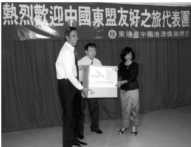
柬埔寨中国友好协会会长帕花黛薇公主接受代表团捐赠

2006年5月17日，对外友协在北京举办了“中国－东盟民间友好组织大会”，邀请东盟10国的友好组织与会，发表了《中国－东盟民间友好合作宣言》。此次“友好之旅”活动是宣言的落实。各国友好组织将此活动看作大会后的统一行动，尽心尽力地安排好访问日程，并根据本国国情和自身能力安排形式多样的活动。老挝副总理、外交部部长、中联部部长通伦·西苏里，工业和贸易部副部长绍沙瓦会见并接受代表团捐赠。老中友协会长、老挝能源和矿产部部长伯塞康毫不介意代表团由于车辆故障而迟到4小时，在代表团抵达老