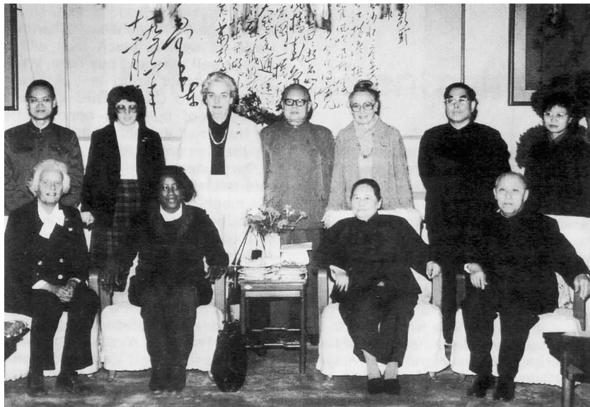
1980年,国家副主席宋庆龄会见尤尼塔·布莱克维尔一行

惊,也很快传遍了她的家乡。为之兴奋不已的尤尼塔见人就說:“我要去共产党中国了!在我们州里,这些年来不是有些人早就说我是‘共产党’吗?我去登记参加选举,他们说我是共产党。我努力想让我们的小孩受到更好的教育,他们也说我是共产党。当我想方设法帮助大家吃饱肚子、有地方住、并且让大家能从政府的规定项目中得到更多的好处,他们又说我是共产党。好吧,这次,我真要到中国去亲眼看一看,共产党究竟是个什么模样?”