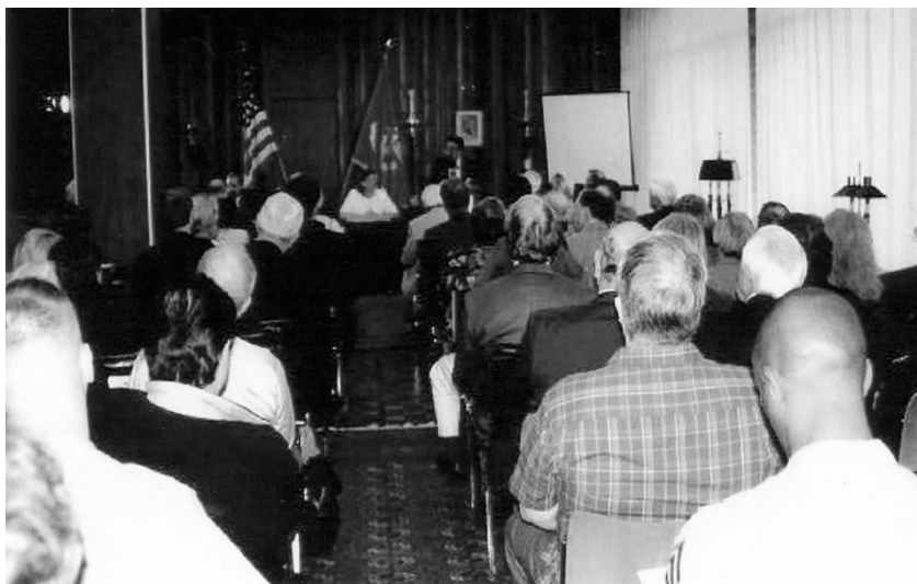
纪念卡尔逊诞辰 110 周年大会

尔逊当年在中国的几位老朋友的后代，这说明我们的事业后继有人。中国驻美使馆参赞周永明在会上宣读了周文重大使的贺信。南卡大学亚洲研究中心帕特里克斯·梅尼教授讲述了卡尔逊与罗斯福总统的特殊关系，她说他们的共同点是“重视有悠久历史和文化的中国和对中国人民的尊重”。她讲道：卡尔逊到中国八路军领导下的游击队活动的敌后根据地考察，行程 2000 多英里，学习了中国的游击战略战术，二战中成功地利用中国的游