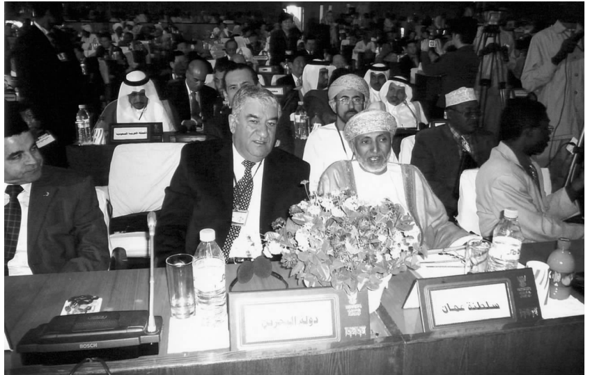
阿拉伯国家友好组织代表 在中阿友好大会开幕式上

秘书长南希分别代表中阿双方围绕会议主题作基调报告；中国驻阿盟全权代表吴思科大使作题为“中阿关系和中国在中东问题上的立场”的演讲。4位中方代表及22位与会阿拉伯国家代表在此后的会议上发言，畅谈中阿友谊，展望中阿民间友好关系发展的广阔前景，交流了各方在开展对华民间友好交往方面的经验和体会，探讨了进一步发展中