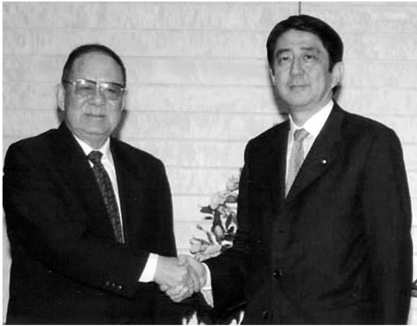
中日友协会长宋健拜会日本首相安倍晋三