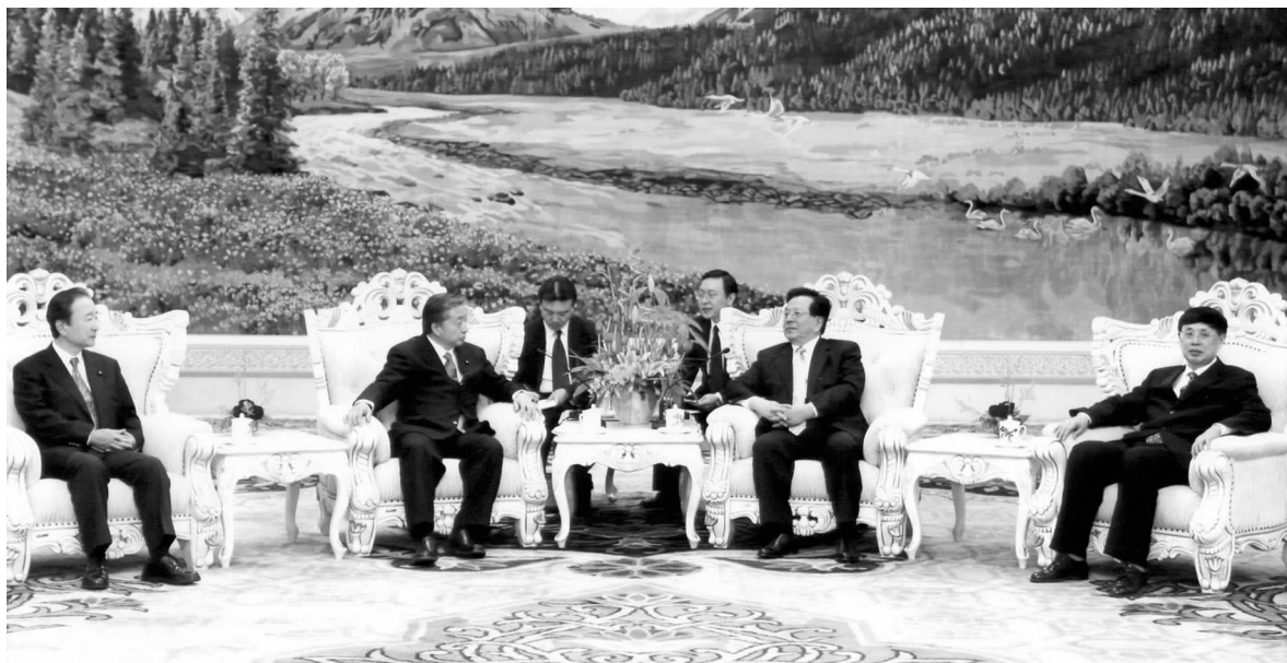
曾庆红副主席会见日本国会年轻议员代表团

应中日友协邀请，日本国会年轻议员代表团一行7人于1月11日至14日访华。国家副主席曾庆红、国务委员唐家璇分别会见代表团；对外友协会长陈昊苏会见并宴请代表团。