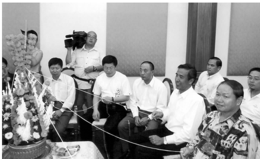
老挝中国友好协会为代表团举行拴线祝福仪式

2006 年是中国东盟建立对话关系 15 周年,政府和民间都对此给予了高度重视,举办了各种庆祝活动。此次“友好之旅”活动在 10 月 30 日“中国 - 东盟纪念峰会”当天在南宁举行出关仪式,并经广西友谊关出访 6 国,意义重大、影响深远。一方面烘托峰会的召开,以民间形式配合官方表达中国人民愿与周边邻国永做“好邻居、好朋友、好伙伴”的强烈愿望。另一方面,以民间外交的灵活性,向越、老、柬等新东盟成员国捐赠文化学习用品,与泰、马、新等老东盟成员国人民举行联欢和文化、商贸交流活动等来落实峰会的精神。随团媒体在所经各国采访中国驻外大使、各国王室成员、政府和地方官员、友好团体代表、海外华人、中资企业代表、老师、学生和普通百姓,不断加深双方友好的信息和中国东盟友好合作的理念。“友好之旅”活动“以多边促双边”,达到了以民促官的目的。