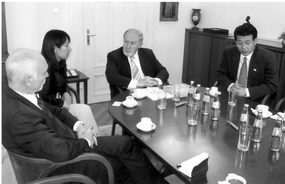
梅特斯局长会见到访的中国客人