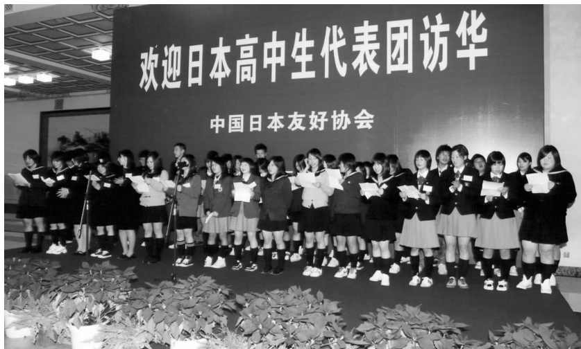
日本高中生代表团在与北京高中生联欢时表演合唱

由于气温变化，水土不服，多名日本学生相继出现身体不适症状。省友协马上采取措施，在中方学生和家长配合下，及时送医院紧急处置，并一直在医院守护至深夜，保证了日方学生很快恢复正常，安全愉快地离开成都。□