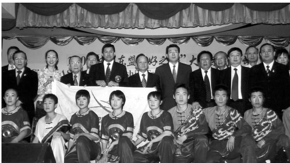
泰中友协会长功·塔帕朗西、中国驻泰国大使张九桓、对外友协副会长井顿泉等在演出结束后与演员合影

挝当晚10点多仍举行隆重的欢迎宴会。在柬埔寨，柬中友协会长帕花黛薇公主接受代表团捐赠和媒体采访，并出席柬中港澳侨商总会的宴请。在泰国，泰中友协会长、前副总理功·塔帕朗西出席代表团多场活动，泰国防部副次长、泰中文化经济协会副会长巴那威上将会见。在马来西亚，马中友协会长、前驻华大使马吉德参加代表团多场活动，马青年及体育部副部长拿督廖中莱会见并为代表团举行挥旗礼。由于代表团有强大的主流媒体参与，泰、马的国家旅游局都给予足够重视，参与了接待代表团的工作，并通过媒体推介本国的旅游，