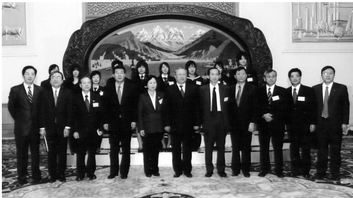
全国人大常委会副委员长路甬祥会见日本高中生代表团主要成员及部分学生代表

应中日友协邀请,由日本千叶县、茨城县 4 所高中学生组成的代表团一行 75 人于 2006 年 11 月 24 日至 26 日访问四川。