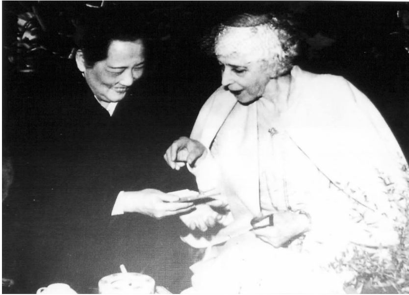
国家副主席宋庆龄会见比利时王太后

第一次世界大战结束,战后又要求废除 1839 年欧洲各国关于比利时地位的一些条约,宣布比利时永久中立,并在战后领导比利时的重建。1934 年去世,由他和伊丽莎白王后的儿子即位,是为利奥波德三世。