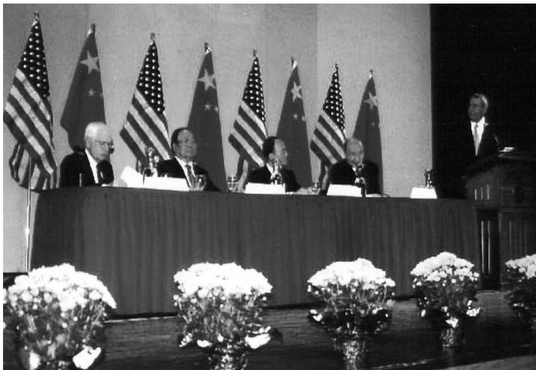
第 12 届斯诺研讨会主席台

第二个项目是在洲际旅馆宴会大厅举行的晚宴，约 400 人参加，也由丹·拉瑟尔主持，中国驻美大使周文重发表了《促进中美伙伴关系》的主旨讲话。他回顾了近几年来中美高层次的交往，说明在双方的共同努力下，