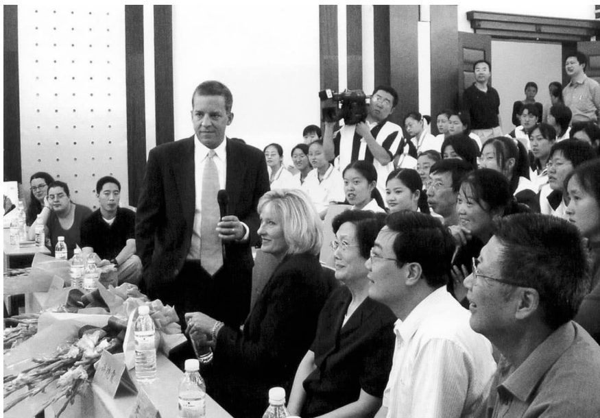
赛珍珠国际董事长约翰·朗鼓励赛珍珠国际班的学生好好学习

在镇江古运河畔有一座社会福利院,这里收养着70多名弃婴、孤残、智障儿童。一天他们迎来了一位特殊的客人——赛珍珠国际总裁珍妮特女士。在活动室小朋友们拍着小手唱着歌,欢迎这位来自大洋彼岸的洋阿姨。珍妮特女士像一位慈祥的母亲,抱着小朋友亲了又亲。她详细了解了这些特殊儿童的收养过程,察看了儿童护理区的设施、