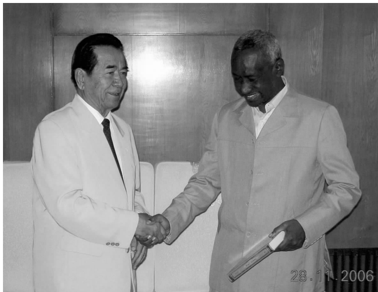
苏丹副总统塔哈会见中阿友协会会长铁木尔·达瓦买提

由中国阿拉伯友好协会、阿拉伯国家联盟主办，中国和阿拉伯各国外交部协办，苏丹世界人民友好理事会承办的首届“中国—阿拉伯友好大会”于2006年11月28日至29日在苏丹首都喀土穆召开。这是中阿民间友好组织的首次聚会，具有重要意义，堪称中阿民间友好交流史上的一座新的里程碑。