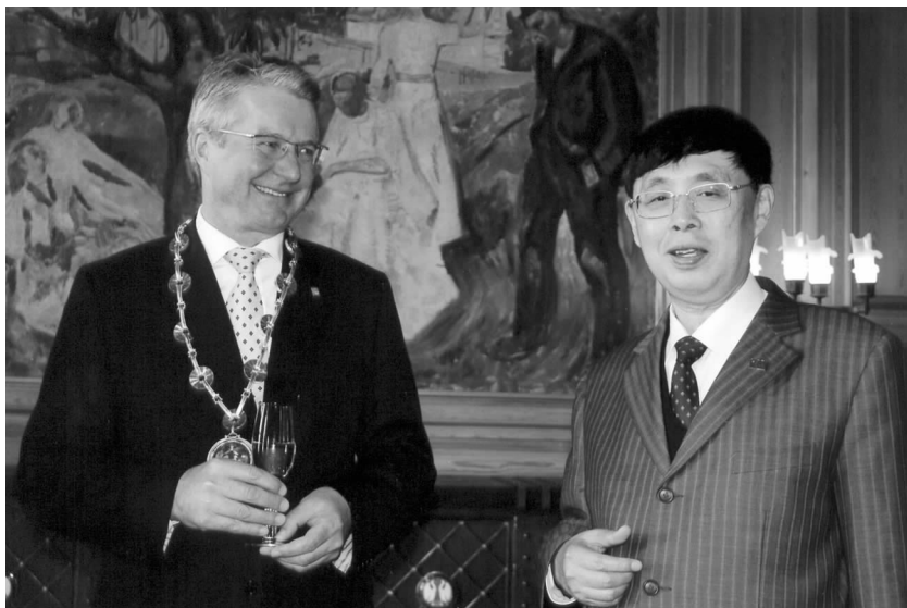
陈昊苏会长拜会奥斯陆市长费比恩·斯汤

中国一定能举办一届让世界瞩目的奥运会。陈昊苏会长向两国的朋友们表示,奥运会是全人类的体育盛会,中国人民希望通过北京奥运会表达对世界各国人民的友好和善意,加深相互了解和信任,增进友谊,为世界和平作出贡献。中国人民将以出色的工作迎接奥运会的召开。