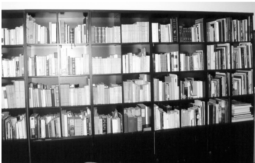
倪波路家中藏书三千余册的大书橱