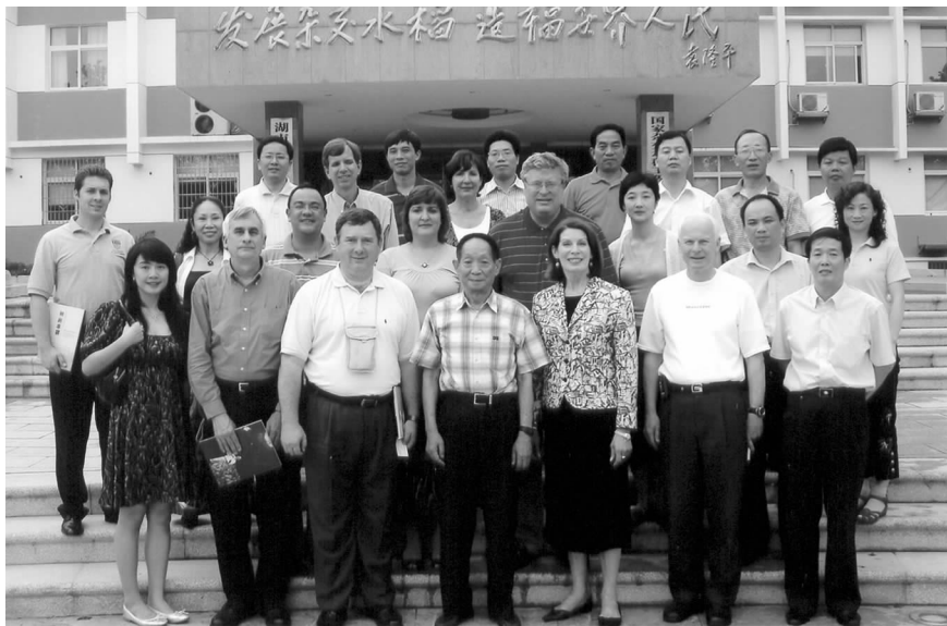
代表团参观湖南杂交水稻研究中心后与“杂交水稻之父”袁隆平院士(前排中)合影