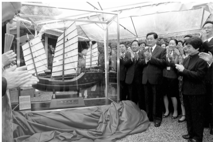
胡锦涛主席为国礼“友谊之舟”揭幕

鉴真精神论坛细释“鉴真精神”：百折不挠的执著精神，普济众生的奉献精神，传播文明的仁爱精神，合和共进的和谐精神。 10日上午，唐招提寺内，由扬州市和奈良市联