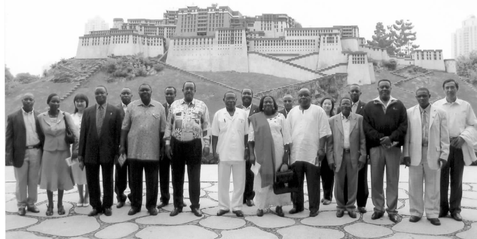
代表团在深圳锦绣中华园中的布达拉宫前合影

但还未落实具体细节，希望网的建设做实地考察，完善的建设。东共体与葛洲坝集团签署了《能源和基础设施建设合作框架备忘录》。□