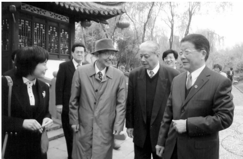
冈村初博(右3)与镇江老领导钱永波(右1)和黄选能(右2)相聚在镇江南山文苑

中心,是一座风景旖旎的海港城市。自1974年即担任津市市长的冈村初博,有着清明的政治意识,对中国怀有强烈的友好情感,在两国恢复邦交正常化后,即萌发了与中国城市缔结友好城市关系的意愿。此前,坐落于镇江的江苏大学的前身江苏农机学院与坐落于津市的日本国立三重大学已有学术交流关系;冈村委托冈本文男访问北京时向廖承志递交了信件,中日友协副会长孙平化在会见冈本文男时向他介绍了同为港口城市的中国镇江市。如此,两座隔海相望的城市渐渐走到了一起。三重县民会议访华团经考察镇江回国后,冈村市长旋即向镇江地区外办发来信函,正式提出与镇江市结好。1984年2月,黄选能副市长率首个镇江市代表团访问津市,得到冈村市长的热情接待。同年6月9日,冈村初博市长、安藤正男议长率津市政府友好代表团,以及由津市各界人士组成的友好访华团一行35人专程来到镇江,与镇江市共同举行缔结友好城市关系签字仪式活动。6月11日,冈村初博市长与镇江市市长邓鸿勋在结好协议书上签字,使津市成为镇江市第一对国际友城。当日,镇江市举行了有千余人出席的隆重集会庆祝这一盛事,江苏省省长顾秀莲、日本三重县知事田川亮三等致电祝贺。