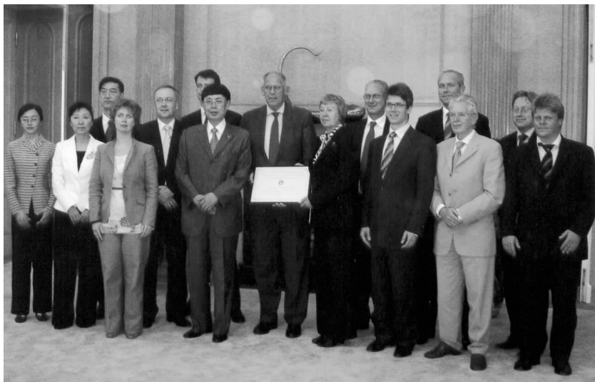
陈昊苏会长会见荷兰前副首相戴克斯特尔率领的友好代表团

能得到来自对外友协纪念该署成立 25 周年的友好祝贺感到骄傲。他表示,陈昊苏会长 1991 年率团访问荷兰同该署建立合作关系以来,双方的合作成果显著,令人满意,表示该署愿同对外友协保持长期合作关系,为荷中之间开展各领域里的交流与合作再作贡献。戴克斯特尔主席认为,世界存在彼此竞争,但要在和平方式下进行。中国在过去几十年中取得的发展及其不断增强的社会活动能力不仅对中国、对亚洲甚至整个世界都会产生积极的影响。他衷