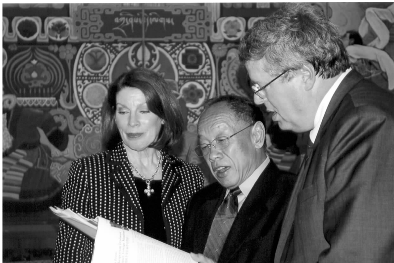
李肇星(中)与美国全国州议会会议主席唐纳·斯通(左)和副主席唐纳德·鲍尔弗(右)在一起

关注的中美贸易逆差问题,马秀红副部长表示理解美方的关切,这些年中方已在逐步积极地扩大从美进口,并鼓励中资企业赴美考察投资。同时她指出由于中国企业国际经验不足,对美各州立法情况的了解不够,走出国门还面临许多困难和挑战,她希望美国全国州议会会议和各州议员今后能提供更多的支持,为发展互利双赢的中美经贸关系作出贡献。