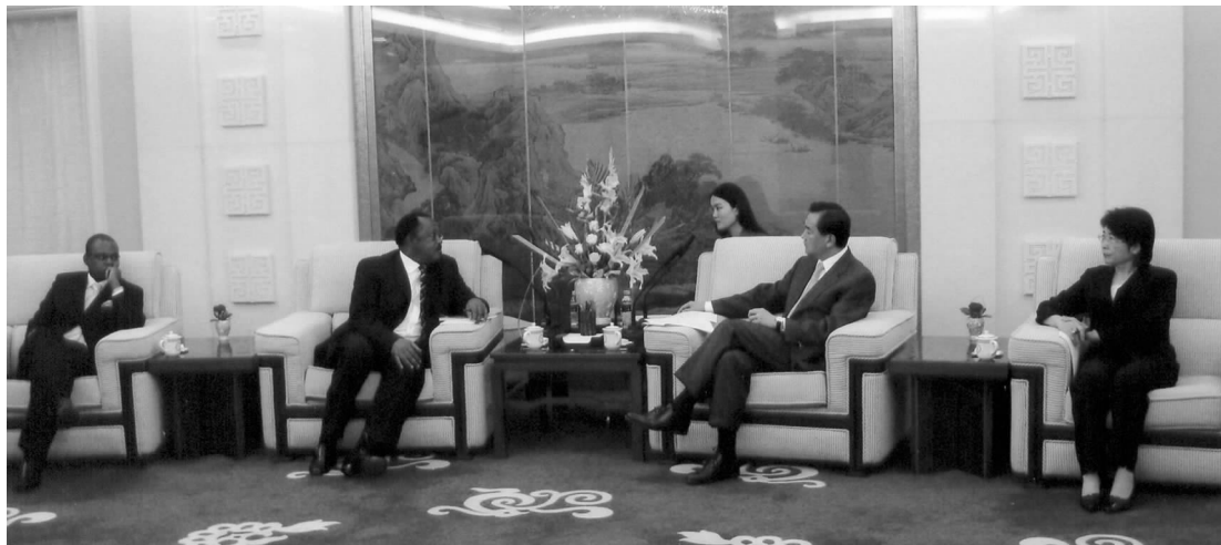
外交部副部长王毅会见代表团

埃里亚指出，中国和东共体五个成员国都保持了友好关系和密切合作。此次访华是五国作为一个整体，希望深化与中国的合作。他认为，单个国家不利于吸引大规模的投资，而东共体联合五个国家，为五国的共同发展搭建平台，将利于大规模的投资建设和五国的共同发展。东共体资源丰富，投资机会多，欢迎中国的大公司和企业家开发投资。在北京代表团与中国路桥公司，在宜昌与葛洲坝集团，在深圳与华为公司分别举行了会谈，