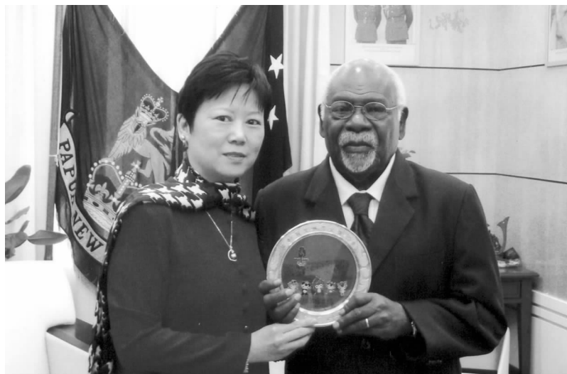
巴新总督马塔内(右)会见李小林副会长