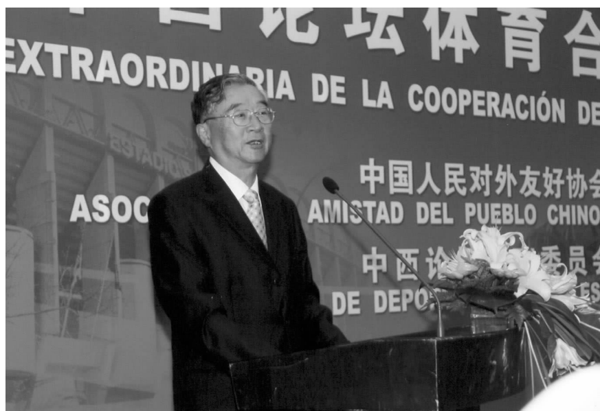
中西论坛中国委员会主席 胡启立在开幕式上讲话

会议以奥运为中心,围绕着北京奥运筹备情况、西班牙奥运代表团情况、中西体育合作等议题广泛交流,交换意见。双方对于论坛在包括体育的各个领域内,为促进中西友好合作发挥的重要作用给予充分肯定,并对体育合作所能带来的积极影响,特别是在促进世界和平方面具备的巨大潜能达成高度共识,期待在未来进行更加深入、形式更加多样的合作。正如萨马兰奇主席说过的那样,“奥运精神代表人类追求友谊、和平、合作的美好愿望”,“不受种族、宗教和政治的影响”。陈昊苏会长在开幕式致辞中提到:“体育是无声的语言,是世界性的语言,它在促进不同民族、文化和文明之间的和平对话,提高人类社会的自我调节能力等方面发挥着独特的作用”,它“拥有超越语言障碍和非国界的特征,使得奥林匹克运动会成为世界和平运动的一个极其重要的组成部分”。秉