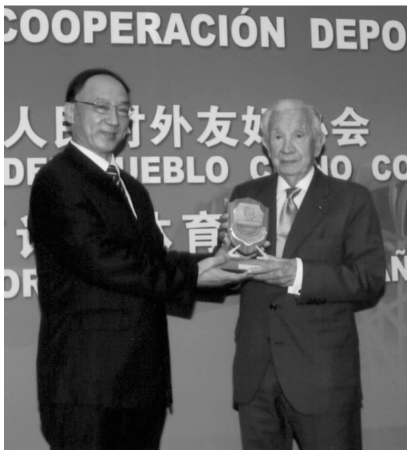
中国奥委会主席、国家体育总局局长刘鹏向中西论坛西班牙委员会主席、国际奥委会终身荣誉主席萨马兰奇授予中国奥委会最高荣誉勋章

在此次会议上,中国奥委会主席刘鹏代表中国奥委会授予萨马兰奇中国奥委会最高荣誉勋章。这是中国奥委会第一次颁发最高荣誉勋章,以表达对萨马兰奇的诚挚谢意和崇高敬意。萨马兰奇关心、支持中国体育事业的发展,为中国能够回到奥林匹克大家庭发挥了巨大作用,为推动中西体育合作作出了巨大贡献。是他点亮了中国人心中的奥运梦,他是孩子们永远的萨马兰奇爷爷;是他宣布了北京申办奥运成功的喜讯,欢腾了天安门广场翘首企盼的人群;是他在世界上一部分不友好的声音抵制北京奥运的时刻挺身而出,坚定地反对奥运政治化,告诉世界和平才是永恒的主题。胡启立主席在开幕式致词中评价道:“萨马兰奇先生对中国人民有着一颗金子般的心,有着海一样深的情,他的讲话,他的行动,他的人格,就是对奥运精神最生动、最精确的诠释。”他是中国