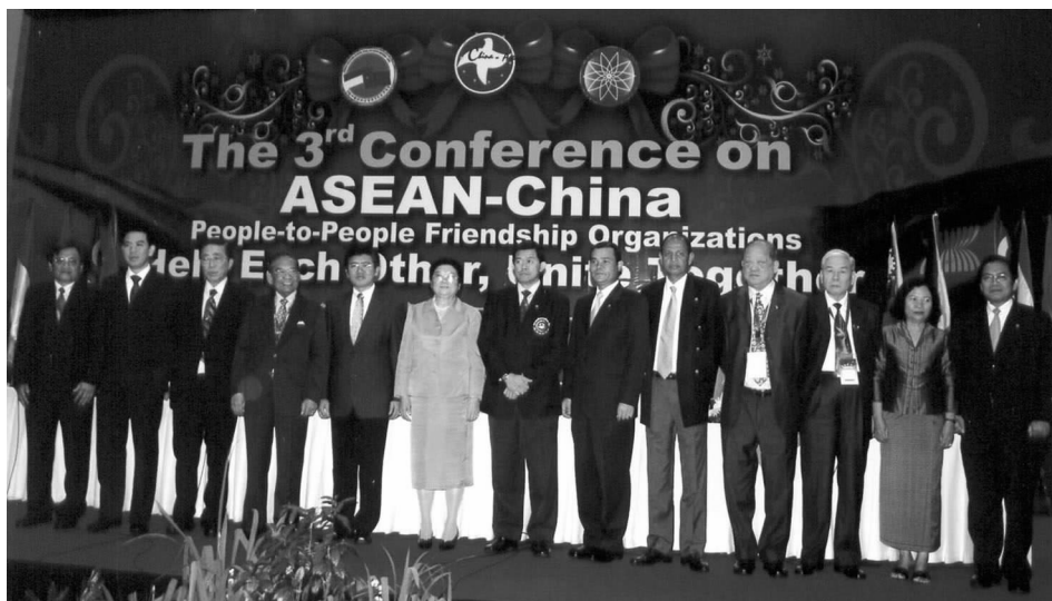
出席第三届中国东盟民间友好组织大会的各代表团团长在开幕式上

解与信任；经贸合作方面，各国经贸团组往来频繁，浙江义乌商品城内“东盟馆”初具规模，推动了互利合作与共赢；慈善捐助方面，各友好组织在缅甸热带风暴和四川地震后积极伸出援手，新中友协对中国贫困地区捐资助学，体现了民间力量的壮大与成熟。与会各方认为：过去一年，成果显著，各方合作基础更加坚实，前进方向更加明确，为从民间层面促进中国与东盟间的关系发展作出了积极贡献；今后各方应进一步强化现有机制，更加注重务实合作，不断扩大民间