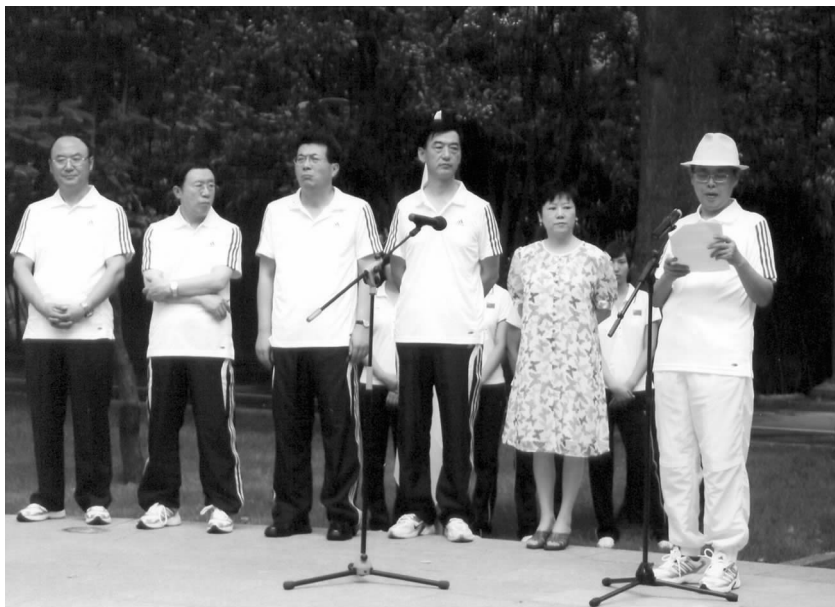
陈昊苏会长在敲钟仪式上致词

随后，泰国中国友好协会主席、泰国前副总理功·塔帕朗西作为外宾代表在敲钟仪式上致词。他表示第29届奥运会在北京召开，是对中国经济社会发展的高度肯定，相信在中国人民的团结努力下，奥运会必将取得前