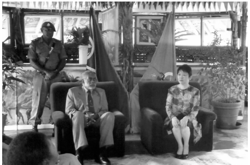
瓦努阿图总统马塔斯凯莱会见李小林副会长一行