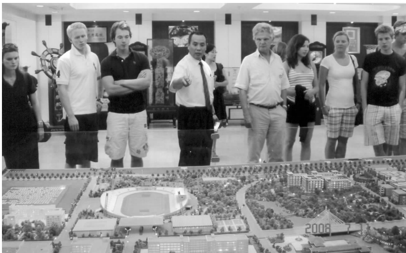
代表团参观泰山医学院

推动了交流，促成了合作。 7年来，学生团来访带来的后续效应，推动了双方各个方面的交流，促成了许多领域的合作。在官方交流方面，促成了山东省多位领导访问挪威，并首次促成山东省人大与挪威议会建立了长期稳定的联系。在经济合作方面，有些学生参加工作后，带着项目来到山东，寻求合作机会，例如COCOPEL公司在山东省农科院进行椰子纤维培养基种植试验，试验成功后即可在山东省推广，将大大提高山东省大棚种植培养基的质量并降低成本，提升山东省农业科技含量。在文化交流方面，挪威国家广播电台的记者拟到山东采访，是从学生团来访中获得的灵感；山东省一直受邀参加挪威中国文化节，也是代