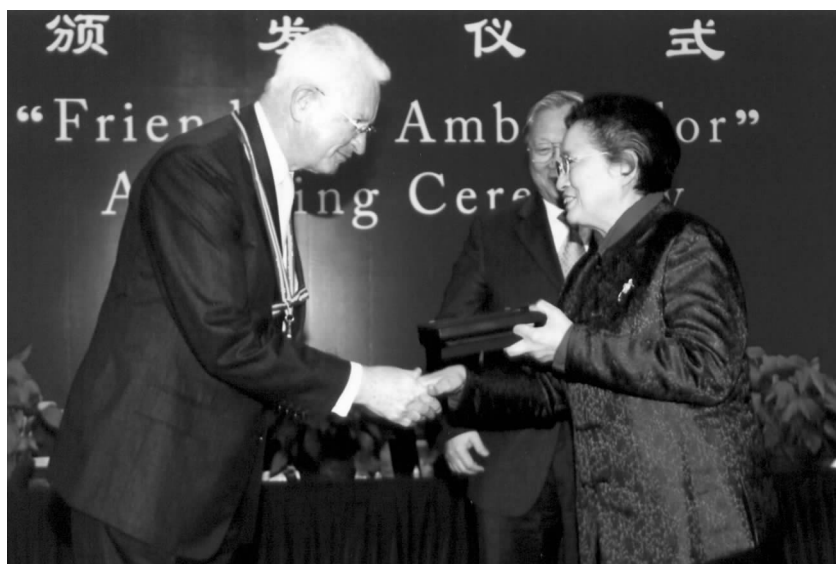
全国人大常委会前前委员长、中欧协会名誉会长何鲁丽向奥中友协名誉主席苏海文颁发“人民友好使者”证书

苏海文博士出资并亲自参与了许多奥中双边研讨会,如1995年的奥中经济研讨会,2007年的和谐社会与