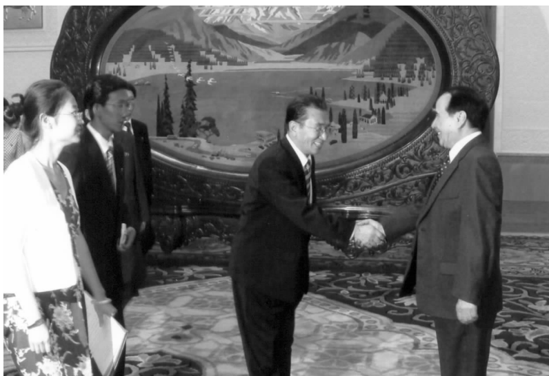
全国政协副主席阿不来提·阿不都热西提在人民大会堂会见朝中友协会会长崔昌植一行

友谊是两国老一辈领导人亲手缔造和培育的。进入新世纪,中朝关系继续快速发展,有力地维护了两国人民共同利益,促进了本地区和平与发展。他对两国友好协会为巩固和发展两国人民间的友谊所作出的积极贡献予以高度评价,希望双方友协今后继续发挥重要作用。崔昌植团长对中国政府和人民长期以来给予朝鲜的支持和帮助表示感谢。他说,当前,朝鲜军队和人民正在金正日将军的领导下,团结一心,为实现到 2012 年将祖国建设成为繁荣国家而努力奋斗。