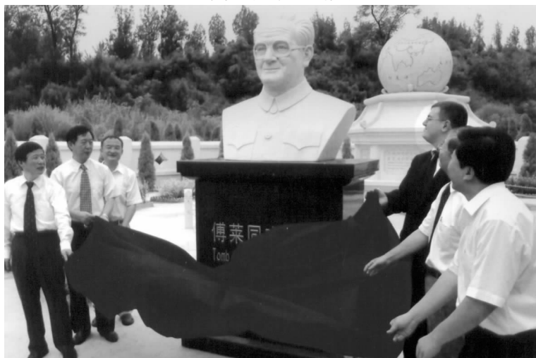
傅莱大夫的墓地落成

傅莱大夫是在白求恩卫校逗留时间最长的三位大夫之一：先是白求恩、再是柯棣华、第三就是傅莱。1944年傅莱大夫到延安，翌年初见到美国提供陕甘宁边区的青霉素菌种和部分资料。在军区卫生部支持下，于张家口建立一个实验室，开始研究试制青霉素，而且取得了成果。1945年5月31日，《解放日报》发表了《留延国际友人傅莱医生试制成功粗制青霉菌素》的消息：“本月20日（星期日）上午9时在边区参议会大礼堂举行首次医药学术报告，特请该会顾问、国际友人傅莱医生，报告怎样运用边区现有条件制造青霉菌素，并展览所需器材，具体说明制造过程。青霉菌素，是世界灵药之一，有杀灭病菌的特效，是美国医药界发明的，经过傅莱医生苦心研究，竟