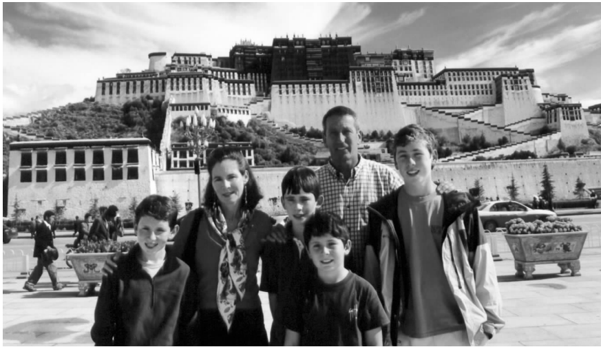
桑福德州长一家在西藏布达拉宫前

教信仰自由，部分西方媒体的报道严重失真。他认为，对中国存在偏见的美国国会议员、政府官员及媒体应该到中国看看，感受和了解改革开放带给中国的进步与发展。