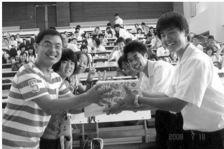
中日学生开心交流

本次访问特地安排青少年们参观了日本有代表性的大企业和有代表性的名胜古迹,如通过参观丰田产业纪念馆,青少年们深入了解了以丰田为代表的日本工业的发展历史和发达程度;通过参观皇宫外苑、浅草寺、箱根活火山等名胜古迹,大家充分领略了日本的美丽风光和风土人情;通过参观大城市,感受到了日本社会的高效和秩序以及日本国民的高素质。大家一致反映,日本国民彬彬有礼的言谈举止,友好谦和的国民素质,发达的科学技术,美丽的自然环境都让人印象深刻。同学们感慨很多,在对比中激发了强烈的爱国主义精神,认为日本有很多好的东西值得我们学习。作为未来的主人,大家应当努力奋斗,有信心把自己的祖国建设得越来越美好。□