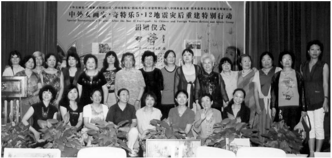
中外女画家在5.12地震灾害重建特别行动捐赠仪式上

到了国内外女艺术家的响应，她们用画笔表达自己对灾区人民的关爱，她们的爱心与捐画跨过山川海洋运送到了“特别行动”组织者手中。