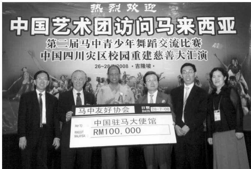
马来西亚中国友好协会将义演所得10万马来西亚林吉特捐给四川灾区

19时30分，主持人宣布演出正式开始。在如潮的掌声中，中国小演员成了全场推崇的明星，他们用精湛的舞蹈语言，展现出与地震灾害作斗争的顽强精神。来自四川灾区小朋友和歌唱家的诗朗诵《孩子，快抓紧妈妈的手》、表现灾区的舞蹈《5.12之回家》以及马来西亚筷子学堂为了赈灾而专门谱写的歌曲《为了你》等节目深深地感动了在场的观众。主持人现场采访了