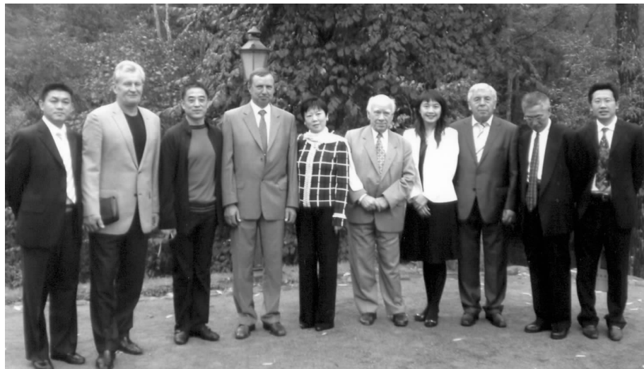
代表团与立陶宛副议长派凯留纳斯(左4)、议会立中友好小组主席格拉凡卡斯(左2)、外委会主席卡洛萨斯(右3)、立中友协主席根贾利斯(右5)在一起

李副会长感谢立方的建议,表示愿与立方相关友好组织紧密合作,举办丰富多彩的活动,进一步增进中立两国人民的了解和友谊。□