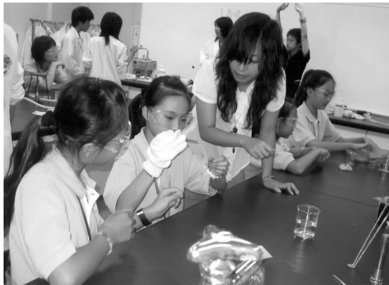
中国少年友好交流代表团的小团员们在与日本立命馆大学附属中学的同学们进行交流

7月13日至21日,由中日友好协会组派的第11届中国少年友好交流代表团一行48人,应日本著名企业京瓷公司的邀请,赴日本进行了友好访问。中国少年友好交流访日团是在京瓷公司创始人稻盛和夫先生的倡议和关心下开展的一项对华友好交流