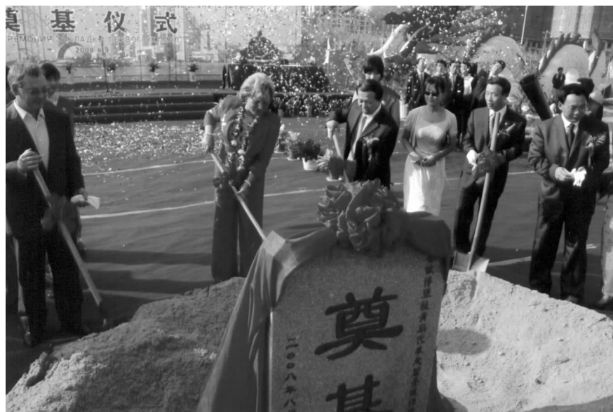
青岛市领导和玛特维延科市长出席圣彼得堡大厦奠基仪式

作为圣彼得堡市的友好使者，玛特维延科市长于 8 月 9 日上午乘专机抵达青岛，对青岛进行了 5 个小时的短暂访问。在因俄罗斯与邻国突发冲突需提前回国的情况下，这位曾任俄罗斯副总理的女市长以坚持访青的诚心彰显了圣彼得堡与青岛相隔遥远却心手相连的姐妹情谊。在抵达青岛后，玛特维延科市长没有因长途跋涉而休息一分一秒，在刚刚抵达香格里拉大饭店后，就直接