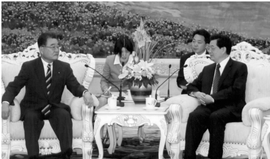
胡锦涛主席会见加藤纮一会长