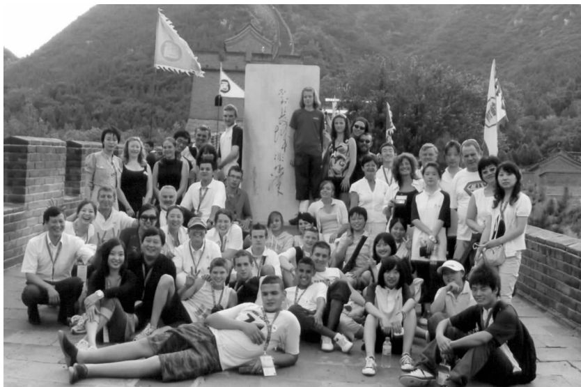
中法学生在长城上