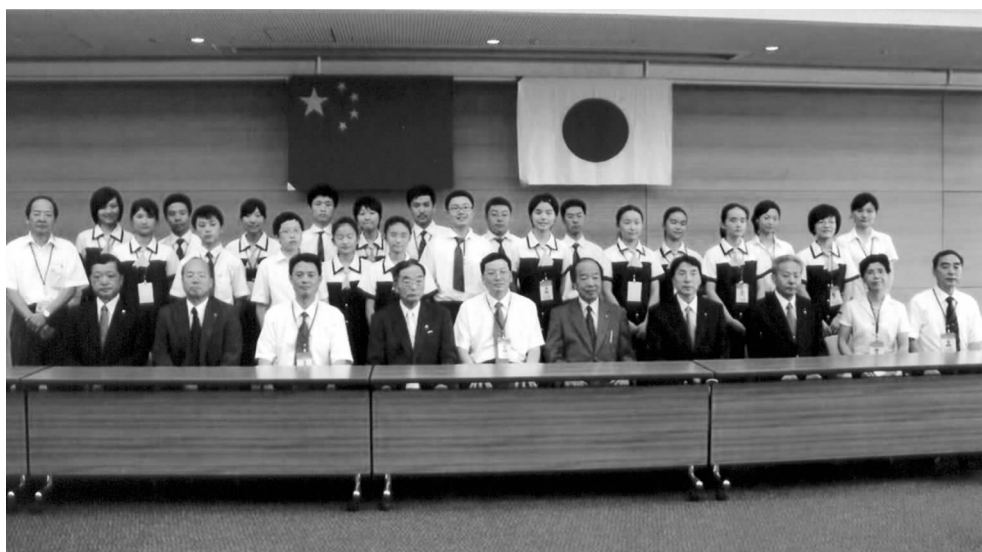
日本茨木市市长野村宣一和议长田中総司会见代表团