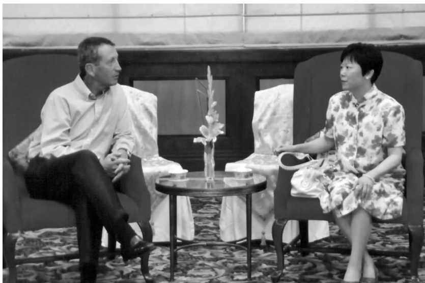
李小林副会长与桑福德州长亲切交谈