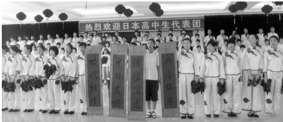
长春市第二实验中学的同学们欢迎日本高中生代表团来校联欢

京瓷公司鹿儿岛工厂。同学们还受到京瓷公司职员们的盛情邀请，分别深入到各个家庭，与日本的“爸爸、妈妈、兄弟姐妹”一起度过了愉快而难忘的两整天。在访问中，中国的少年儿童们学到了鲜活的知识，开阔了眼界，增长了见识，加深了对邻国日本的了解，更与日本的小伙伴们结下了深厚的友谊。他