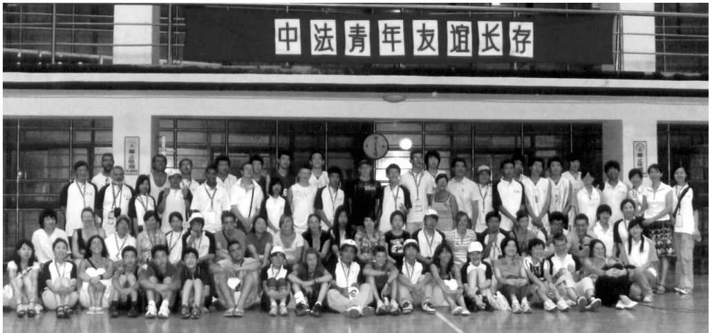
法国青年代表团与北京 22 中学生联欢

好的世界。记得布莱斯团长说了这样一句话：他们现在也许还不能真正理解我们所说的法中友谊的全部含义，但他们现在已经自觉不自觉地成为其中的一员。