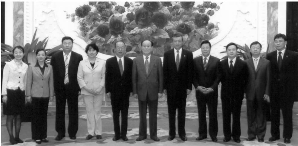
朝鲜最高人民会议常任委员会委员长金永南会见中朝友协代表团

金永南委员长在会见时说，朝中友谊是两国老一辈领导人留下的宝贵遗产，这一友谊在两国当代领导人的精心呵护下正得到进一步巩