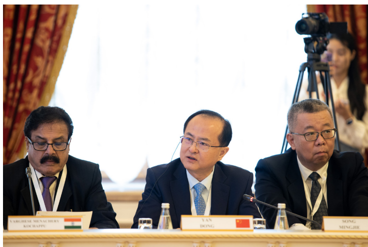
鄯东副会长出席活动并致辞。

鄯东表示，7年前，金砖国家领导人厦门会晤期间，习近平主席开创性提出“金砖+”合作理念。近年来，“金砖+”模式不断深化拓展，成为新兴市场国家和发展中国家开展南南合作、实现联合自强的典范。地方合作是深化“金砖+”国家人民友谊、实现互利共赢的重要方式。