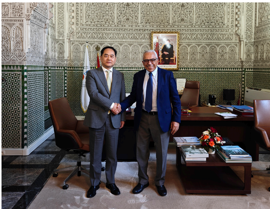
杨万明会长会见卡萨布兰卡—塞塔特大区议会主席马祖兹。

利合作，为构建新时代中阿命运共同体作出持续贡献。我会愿同摩中友协一道，巩固现有合作机制，不断增进两国人民之间相互了解和友谊，进一步夯实两国友好的民意基础。