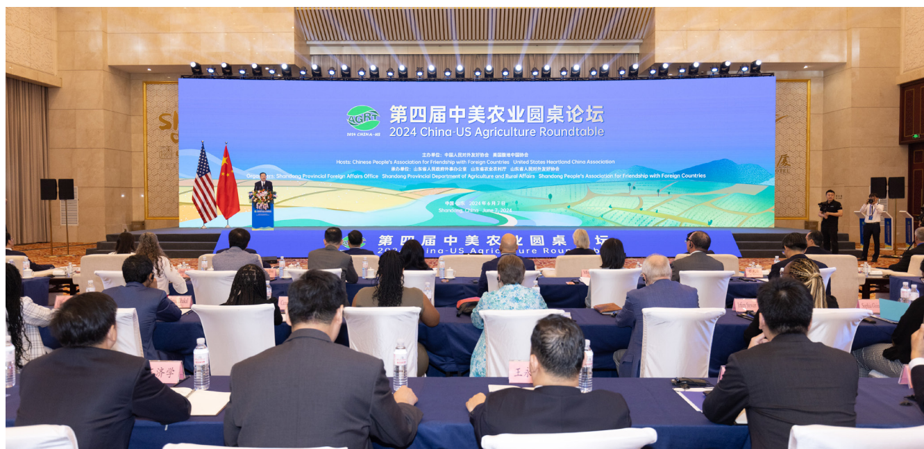
第四届中美农业圆桌论坛在山东省成功举办。

中美农业圆桌论坛由中国人民对外友好协会与美国腹地中国协会于2021年创办，已连续举办三届。今年系该论坛首次在中国举办，主题为“粮食安全与农业合作”。■