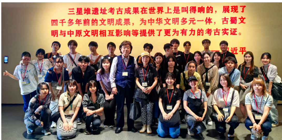
代表团参观三星堆博物馆。

成都是历史文化名城、雪山下的公园城市，去年成功举办了第 31 届世界大学生夏季运动会。代表团