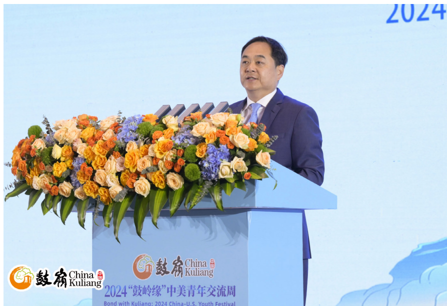
杨万明会长出席活动并在开幕式上致辞。

国人民对外友好协会会长杨万明、全国青联负责人胡盛、美国“鼓岭之友”代表穆言灵、美国驻广州总领事耿欣、俄勒冈州副州务卿迈尔