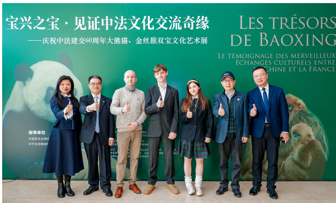
中法嘉宾在展览开幕式上合影。

敏督，来京交流参访的荷兰、法国、德国友人以及在京近 10 所国际学校的外籍教师和学生。人们纷纷前来观展，亲身感受大熊猫、金丝猴“双宝”的生态价值和人文价值。央视新闻、人民日报、中国科学报、四川观察等在内的近 50 家国内主流媒体，丝路新观察和华人等海外媒体对本次活动进行了深入报道。