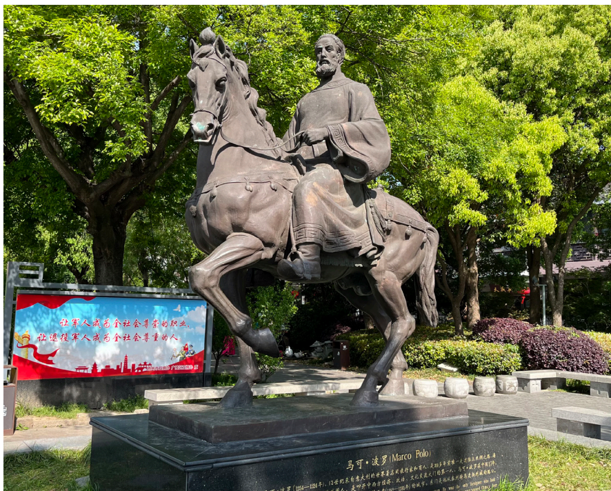
扬州东城门广场上的马可·波罗骑马入城雕塑。

元朝时，随着丝绸之路的发展，西方各国传教者、商人等纷纷来到中国。当时“东方著名港口”的扬州，依托优越的地理位置和在古代经济版图中所占的重要地位，成为他们北上大都(今北京)或南下沿海诸省的必经之地。元世祖至元八年(公元1271)，马可·波罗随其父亲、叔叔自威尼斯前往东方游历，他们横跨了整个亚洲并在中国留驻多年。至元十二年(公元1275年)，马可·波罗来到大都，因得到元世祖忽必烈信任而出使各地，足迹遍及山西、陕西、四川、云南、山东、江苏、浙江、福建诸省。马可·波罗在中国共计生活了十七年，根据其著名的《马可·波罗游记》记载，公元1282年，他来到“一个重要的城市”——扬州，在这里一呆就是3年，并自称奉“大