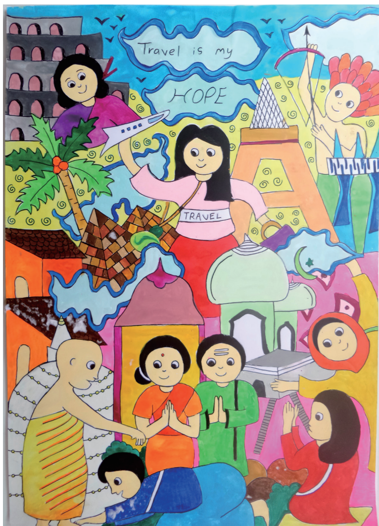
图为“守望相助，童绘未来”画展斯里兰卡作品《旅行即希望》。

俄罗斯驻华使馆公使衔参赞德米特里·卢基扬采夫在参观画展后，称赞其为“小项目，大善举（a tiny exhibition with a big heart）”。太平洋中国友好协会主席易立亚·奥提诺代表太中友协终身荣誉主席、汤加王国公主萨洛特·皮洛莱乌·图伊塔致贺，表示活动“激励下一代