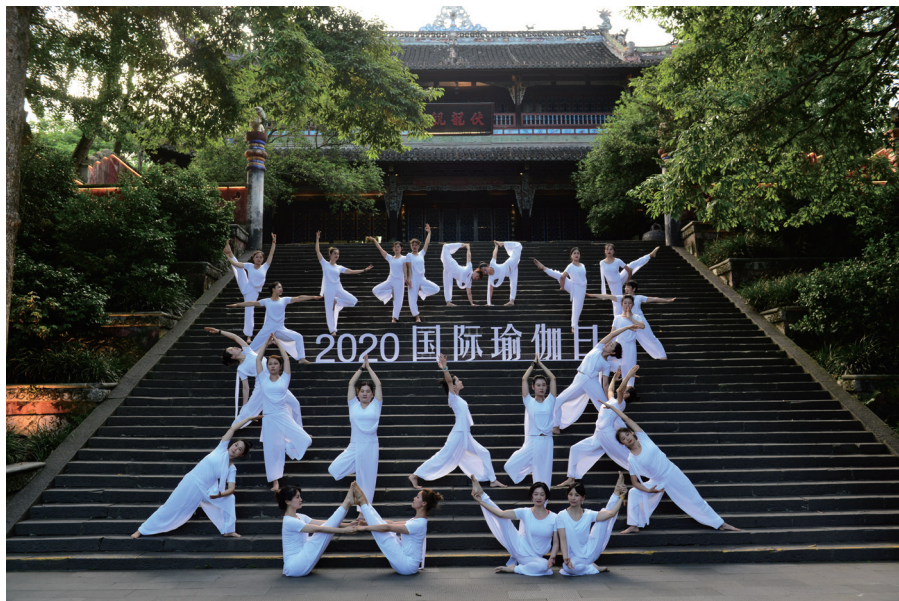
图为2020年6月，都江堰市举办2020国际瑜伽日活动。

式，采用“线上+线下”“国内+国外”等方式，坚持举办了2020中印国际瑜伽节、“2020成都国际友城青年音乐周”都江堰分会场等国际活动。2020中印国际瑜伽节以“疗愈身心，回归自然”为主题，在都江堰地标性地点进行全球同步授课直播，同时还举办友城瑜伽“云”对话、国际瑜伽日活动、瑜伽网络集市等系列活动，强化都江堰瑜伽文化IP的建设，助推城市康养产业发展。“2020成都国际友城青年音乐周”都江堰分会场活动是疫情后都江堰市今年规模最大的国际文化活动，成功举办并吸纳本地观众及游客约4000余人。活动地点选择在南桥广场举办，临近景区，为景区聚集人气，为重振市民和游客的信心起到了积极作用。