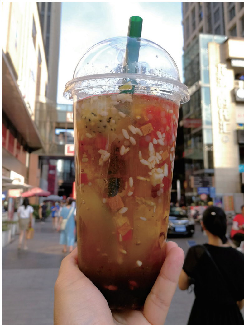
醪糟冰粉，口舌生津。

歌乐山、南山、黄葛古道、照母山、铁山坪、缙云山，抬脚便是山的城市里，苍翠浮眼，绿嶂环身。重庆人下班后或周末约上一二好友，去山里走走，神清气爽，只是口舌渐乏，正想打听哪有消暑饮食时，一个不起眼的挑夫蹿了上来，一张殷情备至的脸，“冰粉，冰粉凉快，红糖养身。”挑夫一边说着，一边揭开捂得严严实实的背篓，果真是冰粉呢。于是率性要上一碗，“不贵，才 5 元。”