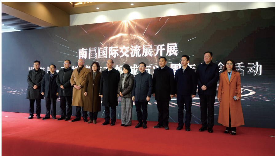
图为南昌国际交流展开展仪式暨南昌·高松缔结友好城市 30 周年纪念活动现场。

南昌大学外国语学院、江西财经大学外国语学院、南昌市外国语学校等在昌院校签约，共建校外实践教育基地。