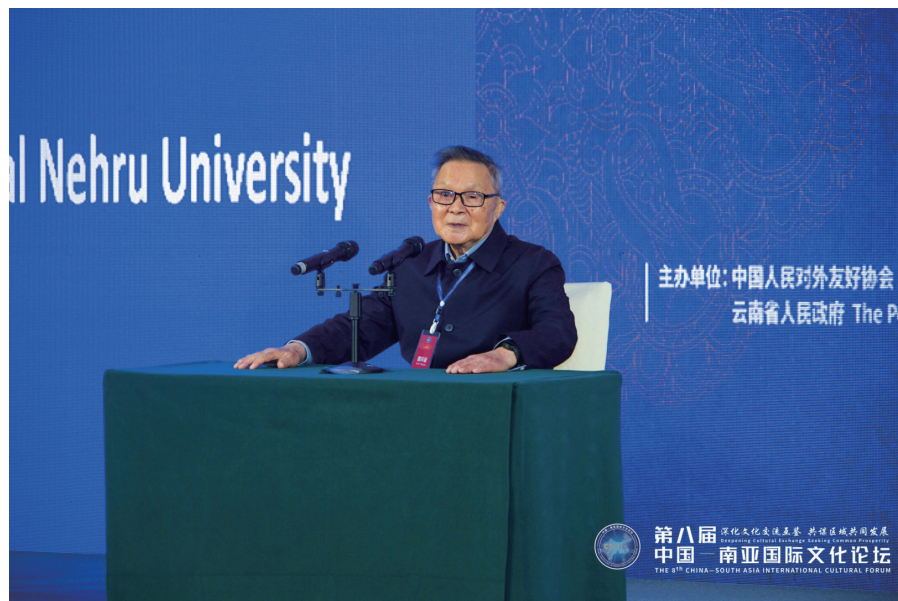
2019年11月6日，谭中在云南省昆明市出席由中国人民对外友好协会和云南省人民政府共同主办的第八届中国—南亚国际文化论坛并发表演讲。

去年在全世界暴发的新冠肺炎疫情，打乱了各国的日常生活和经济发展。一年过去了，世界形势发生了根本的变化，世界上没有一个国家能独善其身，关起门来搞建设。世界新形势要求所有国家团结一致，结成一个卫生健康共同体，更进一