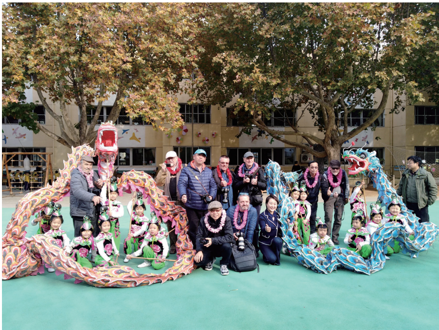
图为在大连采风期间与幼儿园小朋友们合影。

随着辽宁与中东欧国家之间的交流不断深化，地区之间的民间交往也不断加深。2018年以来，经省政府批准，辽宁省对外友协先后成功组织承办了两届“中东欧代表团辽宁行”活动。累计邀请来自阿尔巴尼亚、保加利亚、匈牙利、罗马尼亚、塞尔维亚等12个中东欧国家的驻华使节、省州长、市长访问辽宁，推动了中东欧相关国家地方政府首