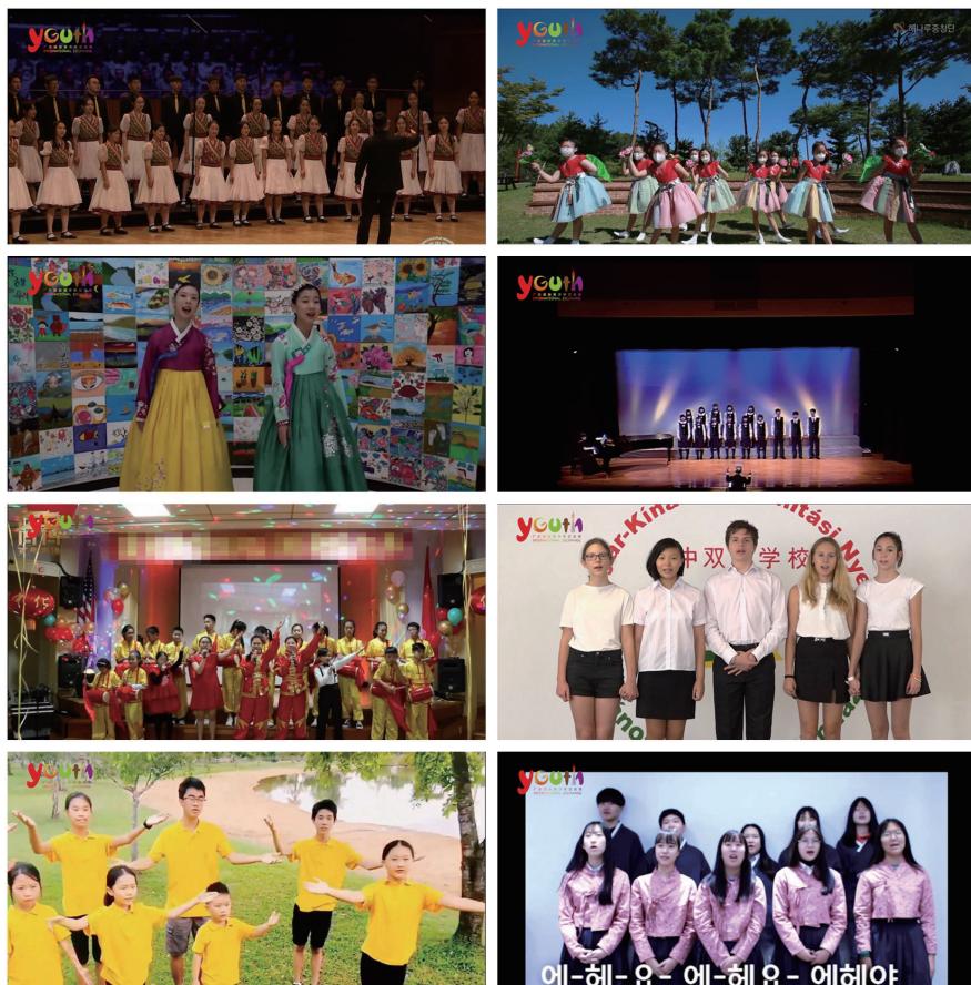
图为“云上的问候”合唱音乐会片段。

性超出预期。来自五大洲 12 个国家和广东省 13 个地市共 500 多位青少年参与画展作品创作和音乐会视频拍摄，其中，亚洲地区特别是日韩友城青少年尤为积极，仅日本兵库