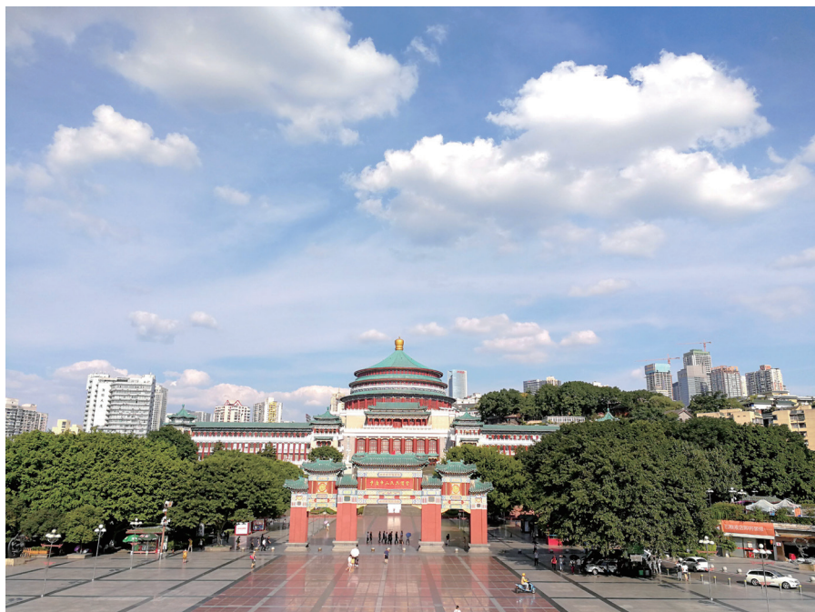
夏日里的重庆人民大礼堂，人来人往，来一碗冰粉，真爽。