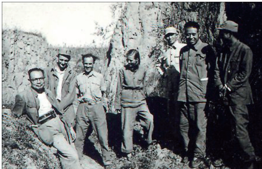
图为1948年夏，在河北石家庄南海山村，叶剑英（左1）到访视察时，防空疏散到野地里，与韩丁（左2）、戴维（左3）、伊莎白（左4）、浦化人（左6）等合影。