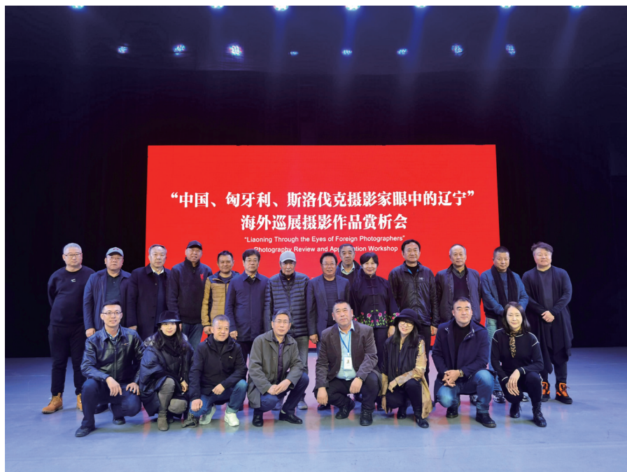
图为活动现场与会嘉宾合影。

天有不测风云。突如其来的新冠肺炎疫情，给中国和全世界人民带来了深重灾难，国际间的往来交流一度陷入停滞。与其他国际交流活动一样，三地摄影家们共同期盼的“布达佩斯采风之约”也被迫推迟。然而，疫情阻挡不了心灵的沟通。借助网络，辽宁省对外友协和三地摄影家们一直保持着密切的沟通联络，互相交流创作心得，互致问候和鼓励。远在匈牙利的魏翔老师更是始终关注着疫情防控政策，精心准备着展览作品，争取疫情好转之后第一时间在匈牙利和斯洛伐克举办展览。正当三地摄影家们为即将举办的海外摄影巡展紧锣密鼓筹备之际，一个坏消息传来：辽宁联合采风活动的一员，匈牙利摄影家拉伊·乔治·拉斯洛不幸离世。辽宁采风之行的摄影作品，成为这位63