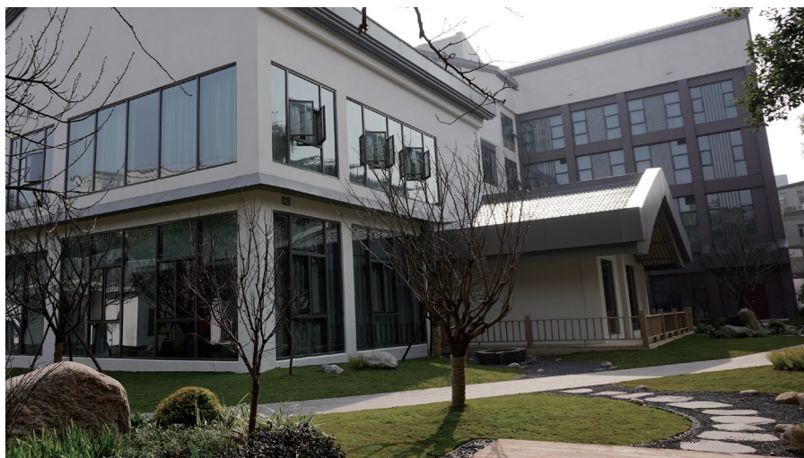
图为南昌高松中日友好会馆。

相知无远近，万里尚为邻。南昌将以更大的力度、更优的举措，与高松市共建友谊之桥，共谋发展之路，共享合作之果。■