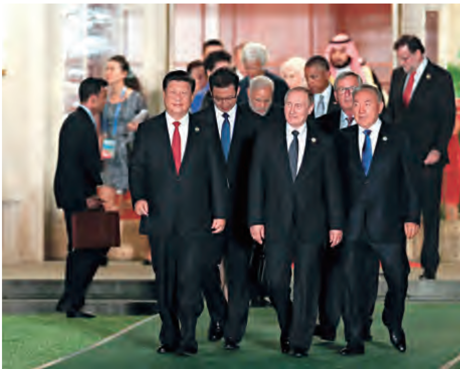
2016 年 9 月 4 日，中国国家主席习近平在杭州西子宾馆欢迎出席二十国集团领导人杭州峰会的外方代表团团长及所有嘉宾

回望 2016 年的国际形势，真可谓变幻莫测、出人意料。即使临近年终岁末，爆炸性消息依然层出不穷。在圣诞新年假期前夕，对极端恐怖势力不堪其扰的欧洲再次遭遇骇人听闻的恐怖袭击。作为欧洲政治中心之一的柏林成为了此番袭击的对象，一辆卡车竟然冲入了柏林市中心的圣诞集市，造成数十人伤亡的惨剧，随后“伊斯兰国”恐怖