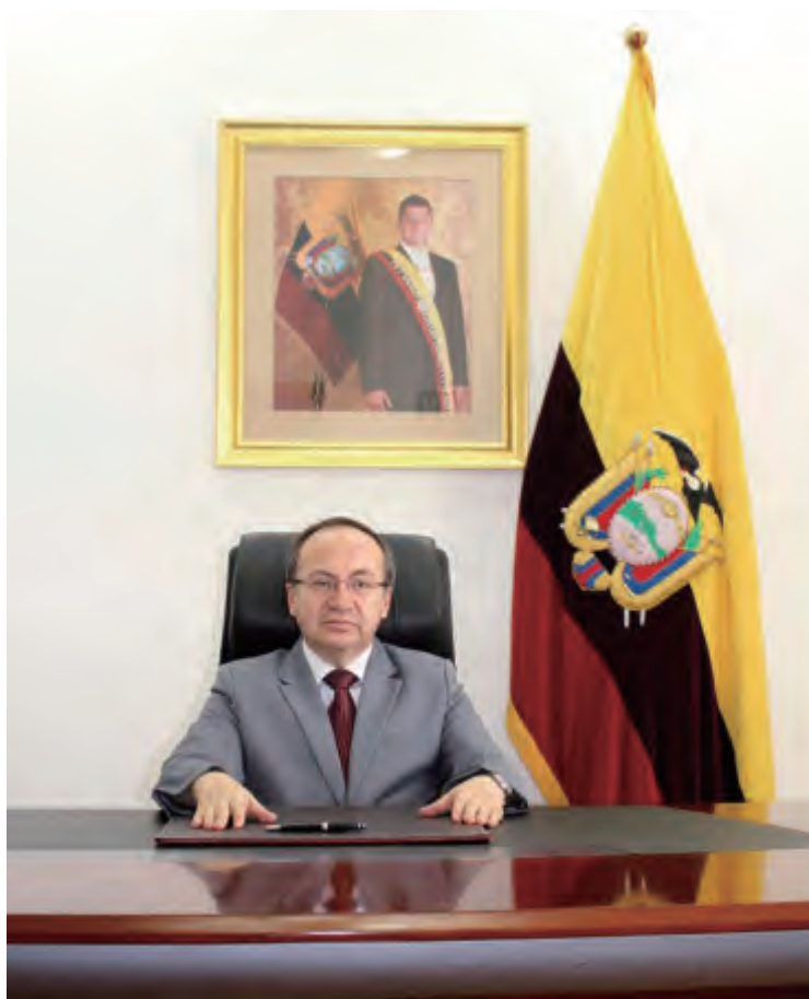
厄瓜多尔驻华大使何塞·博尔哈

在战略领域，由于厄瓜多尔人民的努力、政府的领导以及中国的合作与参与，国家需要的基础设施建设得以实现。最重大的项目有：位于纳波和苏昆比奥斯省的科卡科多新克雷水电站；阿苏艾省和瓜亚斯省的索普拉