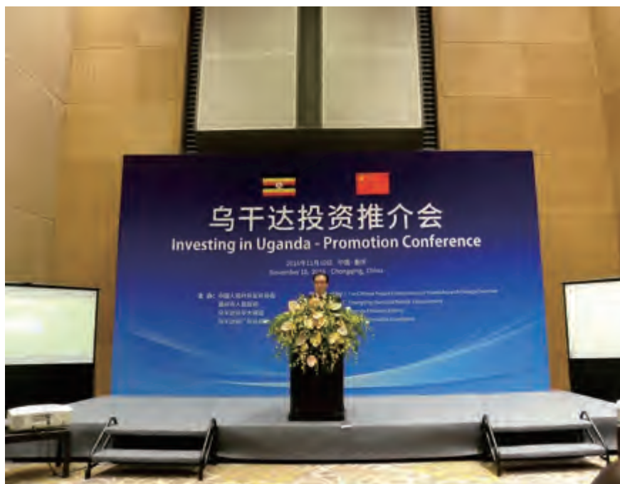
重庆市副市长刘桂平在乌干达投资推介会上致辞

乌干达投资局执行主任哈姆扎介绍了乌干达的优势条件。“我们拥有发达的交通运输网络，航空、铁路、公路等基础设施相当完善。”哈姆扎介绍了乌干达也是一个资源丰富的国家，例如太阳能、矿产、水利等领域蕴藏着许多机会，期望