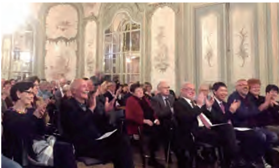
《莉莉玛莲》旋律响起时，观众们会心一笑

高。面对观众的专注和高度鉴赏力，中国音乐家演出比平时更加卖力，每一个细微的技术手法都处理得格外用心。艺术家与观众们保有这份珍贵的默契，让音乐会每场都很精彩。