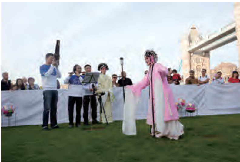
在伦敦塔桥下面表演昆曲快闪

2016年9月19日至25日，南京市人民政府主办、英国驻上海总领事馆支持的2016伦敦设计节“南京周”活动在英国伦敦成功举办。这是继2015米兰世博会南京周后，南京文化走出去，提升城市国际化水平的又一次主动探索和全新亮相。组委会按照市委市政府要求，围绕“创意好东·西——东方文化名城邂逅西方创意之都”主题，精心组织了一场戏“邯郸梦”，一个馆“宝庆银楼南京馆”，一间厅“伦敦—南京双城文化客厅”，一盏灯“秦淮灯彩”，一本书“虫子书”，一