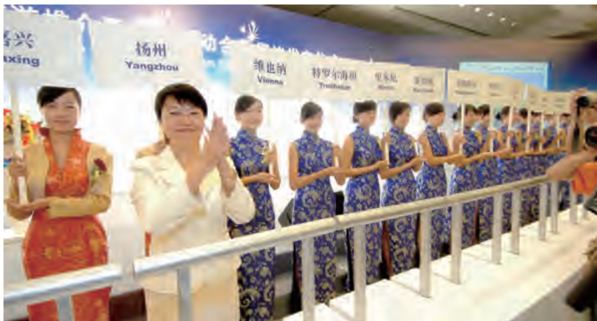
2007 首届运博会市长论坛

古运河，是扬州千年繁华的母亲河；扬州城，是名副其实的运河城。如果从中国大运河的起始段——“邗沟”在扬州开挖算起，大运河已与扬州同生共长了 2500 年。