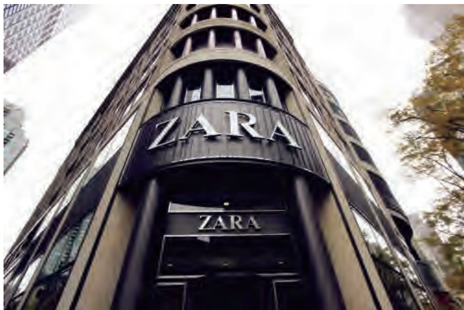
ZARA 已经成长为全球快时尚服饰领先品牌

于其他服装企业，阿曼西奥·奥尔特加依旧坚持把绝大部分的设计与生产放在西班牙，而非转移到第三世界国家；ZARA 在西班牙有 22 间科技化大工厂，500 多间联盟小工厂。22 间大工厂只做染色和裁剪，500 家小工厂负责款式。虽然 ZARA 在海外其他国家与 1200 多家生产企业建立了战略联盟，但是海外工厂一般只生产相对少量的基本款式。这种将设计、生产、销售全由总部控制的模式，即使增加了生产成本，但其压缩了供应商的前导时间，也使得企业能够第一时间掌握市场的信息，加快应变和协调速度，真正做到“极速”。