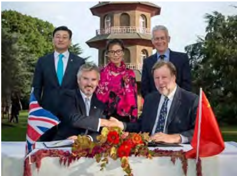
三胞集团斥巨资修缮南京大报恩寺塔“伦敦兄弟”

作相并重。独立自主，是指企业主动策划，直接对接，开展点对点的公共外交。这方面，作为国际化的企业，三胞集团有着清晰的考虑，专门组建了负责公共外交的部门，如对外合作管理中心、国际事务管理中心等，直接参与、策划、组织开展公共外交。同时，三胞集团又重视多方合作，集聚资源，整合力量，合作共赢，共同开展公共外交。主要体现在：第一，集团借助与政界合作机会，开展公共外交。如，利用统战部、外办等部门积极贯彻“一带一路”战略的机遇，积极与外商以及外国政要展开商务交往；第二，集团借助与工商联、公共外交协会等非政府组织合作机会，开展公共外交，取得了良好效果；第三，集团借助与国际非政府组织合作机会开展公共外交。如，担任全球野生动物保护联盟形象大使就是典型