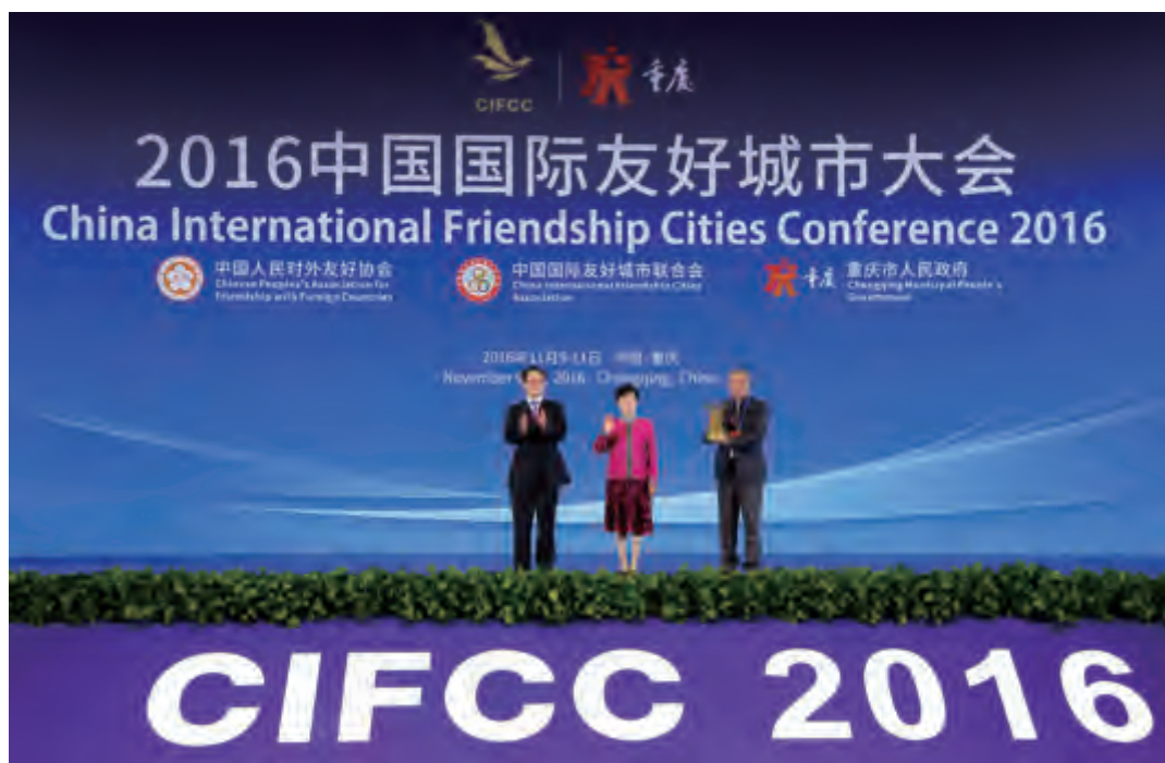
传承物交接仪式 重庆市副市长刘桂平（左）在李小林会长（中）的见证下，向武汉市副市长邵为民（右）移交大会传承物

2016年11月11日上午，2016中国国际友好城市大会闭幕。会议通过了《重庆倡议》，确定了下一次会议将于2018年在湖北武汉市举行。中国人民对外友好协会、中国国际友好城市联合会会长李小林，重庆市副市长刘桂平出席闭幕式。