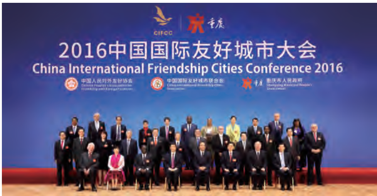
2016 友城大会开幕式前中外嘉宾代表合影

2016年11月10日，由中国人民对外友好协会、中国国际友好城市联合会、重庆市人民政府主办，重庆市人民政府外事办公室承办的2016中国国际友好城市大会在重庆成功举办。重庆市委书记孙政才、国家副主席李源潮、重庆市长黄奇帆、中国人民对外友好协会会长、中国国际友好城市联合会会长李小林、外交部副部长张明、乌干达副总统爱德华·塞坎迪、日本前首相鸠山由纪夫、荷兰前首相维姆·科克等出席并致辞。