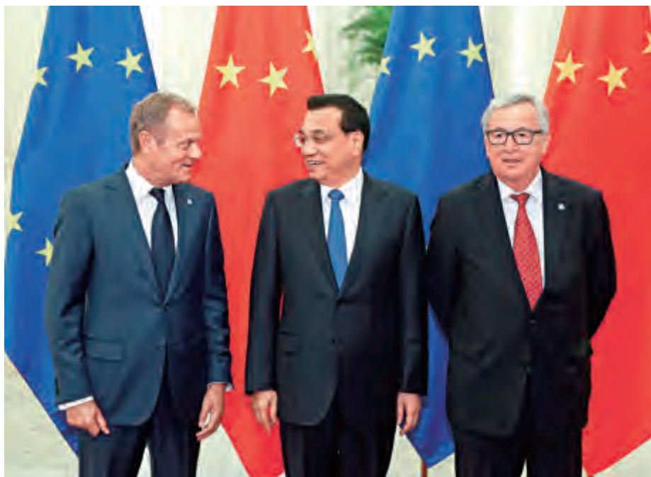
2016 年 7 月 12 日，中国国务院总理李克强与欧洲理事会主席图斯克、欧盟委员会主席容克在北京人民大会堂共同主持第十八次中国欧盟领导人会晤

首当其冲的便是，围绕所谓贸易救济反倾销和反补贴中运用“市场经济地位”确定价格引发的持续博弈，具体内容参见《中国加入世界贸易组织议定书》第 15 条款。在 2001 年 12 月 11 日，中国签订入世议定书，正式加入世界贸易组织。由于当时一些成员体认为中国的市场经济尚在发展成熟之中，因此协商决定设立为期 15 年时间的过渡期，至 2016 年 12 月 11 日，按照通俗的理解，中国便“自动”获得所谓“市场经济地位”。实际上，欧盟等滥用贸易救济措施，特别是反倾销和反补贴立案调查，无视按照市场经济运行中国企业的价格与成本，人为任意选择第三方替代国，确定倾销幅度或补贴幅度、同类产品遭受实质性损害或威胁、以及二者之间是否存在因果关系。欧盟等国家这