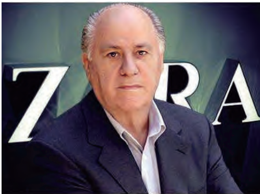
Zara 集团创始人阿曼西奥·奥尔特加

而今，ZARA 已经成长为全球快时尚服饰领先品牌，店面遍布全球 88 个国家和地区，线上线下门店总数已超 2000 家。而它的创始人——现年 80 岁的奥尔特加——也在今年 9 月初实现了“传统服装业大佬对科技大佬的逆袭”——以 795 亿美元的纯资产超过了比尔·盖茨（785 亿美元），成为世界上最富有的人。奥尔特加的 Inditex 集团旗下拥有包括 ZARA、Massimo Dutti、Pull & Bear、Bershka 和 Stradivarius 等八大服装品牌，2015 财年的净销售额达 209 亿欧元，年均复合增长率为 14.2%；净利润 28.8 亿欧元，年均复合增长率 16.5%，ZARA 对集团贡献率达 70%。虽然奥尔特加的投资还涉及地产、体育（足球俱乐部）、能源、