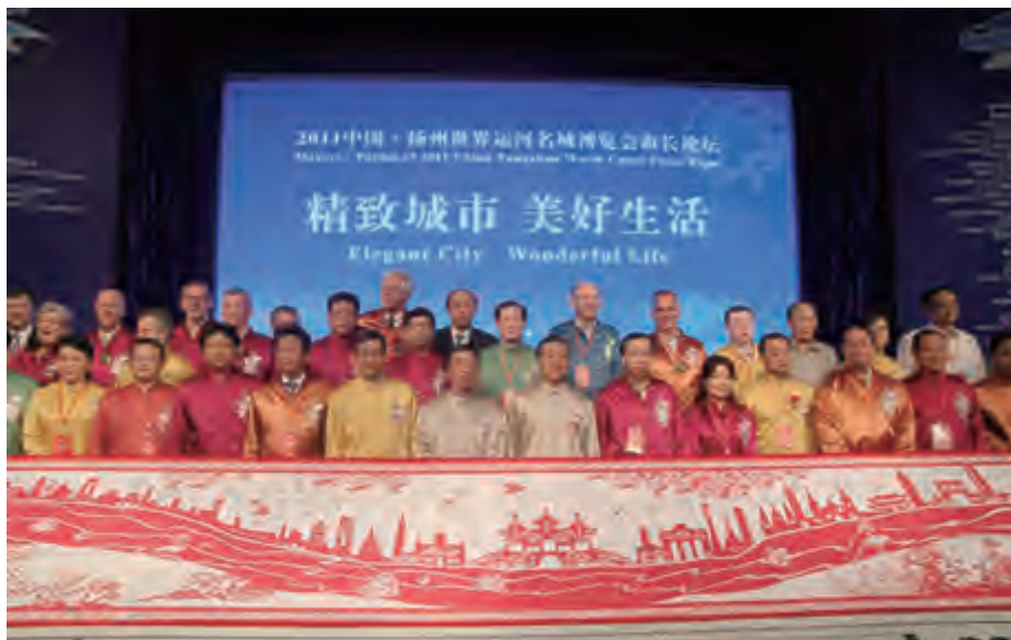
2011年,扬州市长谢正义在“精致城市、美好生活”市长论坛与参会中外嘉宾合影

运河沿线35个城市的市长或政府代表齐聚扬州,同庆中国大运河申遗成功,并以“大运河成为世界文化遗产后的保护与利用”为主题,共商世界遗产保护大计,深化世界运河城市间的交流与合作。会上通过了《大运河遗产保护管理城市联盟章程》。