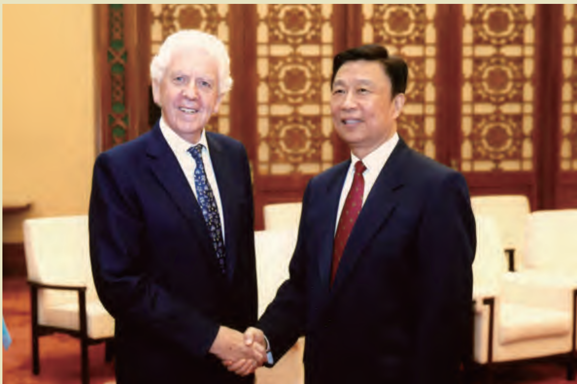
国家副主席李源潮会见英国议员鲍威尔勋爵