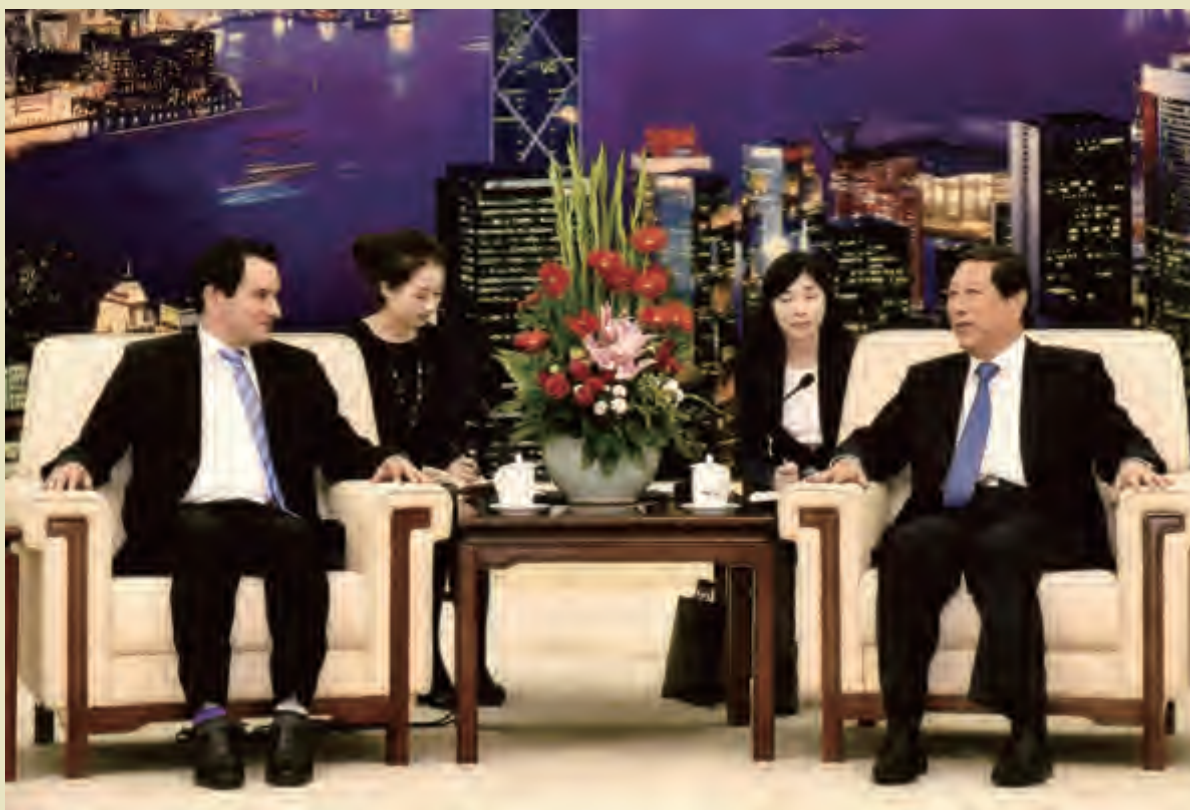
全国人大常委会副委员长张平会见美国加州众议长兰登