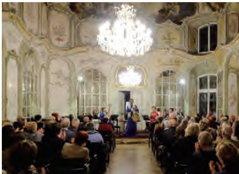
德国莱法州昂格斯宫的中国民乐音乐会现场

波浪线条的雕花窗框蜿蜒在音乐大厅内壁，仿佛窗外莱茵河的碧波在屋里荡漾。此刻，德国观众的心里，也许正荡漾着中国赫哲族人捕鱼晚归的波光。