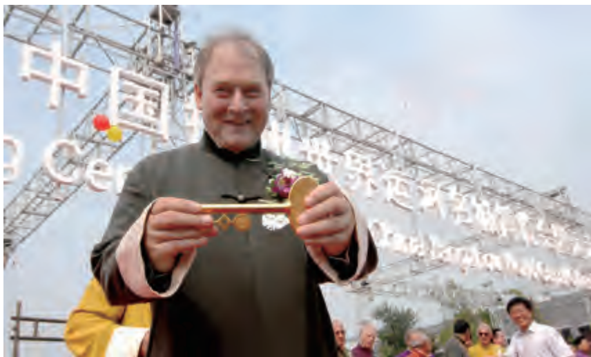
2007 运博会嘉宾展示金钥匙

“世界运河历史文化城市合作组织”是一个以文化交流为主题的非营利性公益组织。该组织在尊重不同运河城市文化个性的前提下，