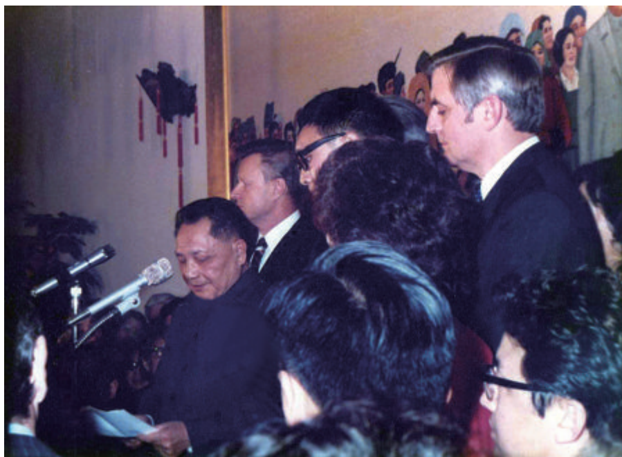
1979 年 1 月 31 日，邓小平在中国驻美使馆举行的答谢招待会上致辞

市正值严冬腊月，寒气逼人，但是天空晴朗，光照能见度好。上午十点，美国总统卡特在白宫玫瑰花园南草坪，正式欢迎小平同志来访美国。现场的美国各界观礼嘉宾、中国访美代表团和我使馆人员，加上 300 名中美和其他国家的记者，共千余人，可谓热闹非凡，盛况空前。卡特总统及夫人在七八米长的红地毯上，从小平同志夫妇下车后，一直陪同走到演讲台。此时美军军乐队奏中美两国国歌。卡特总统后又同小平同志一起检阅美国三军仪仗队，同时美军鸣放 19 响礼炮。美国政府