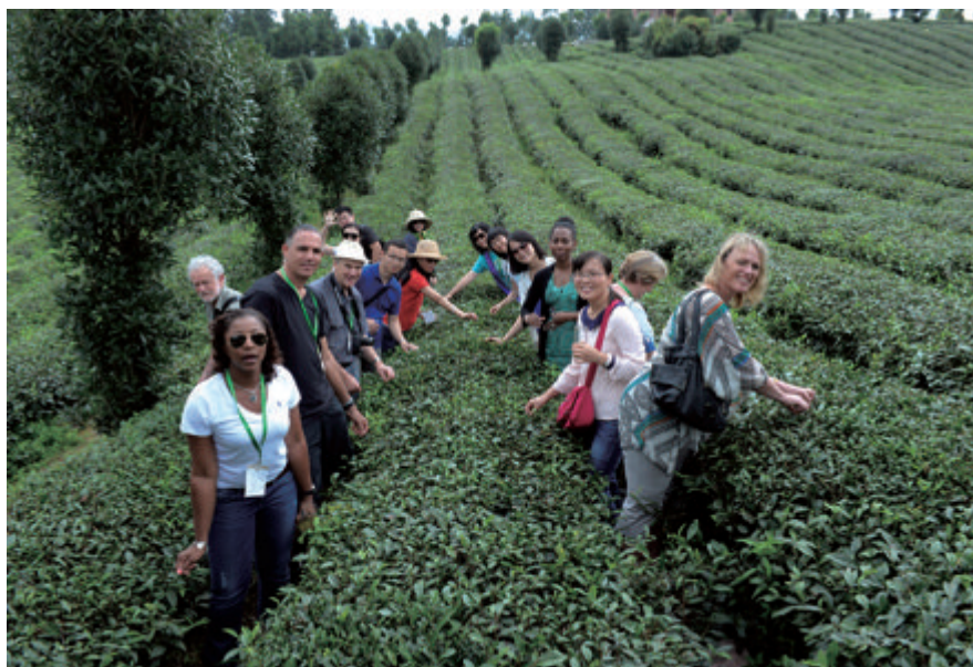
与会外国嘉宾在贵州凤岗茶园采茶