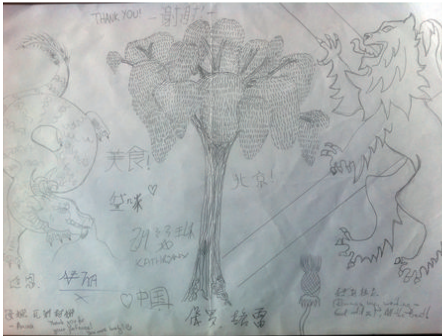
英国学生们创作的中英友谊纪念铅笔画