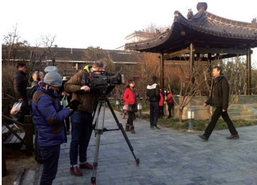
迈克尔·伍德一行拍摄扬州东关城门

作为一名历史学家，迈克尔对中国的历史很有研究，更是专门研究过扬州。他认为清朝时期，中国文化在经历了多年战乱后得到了重