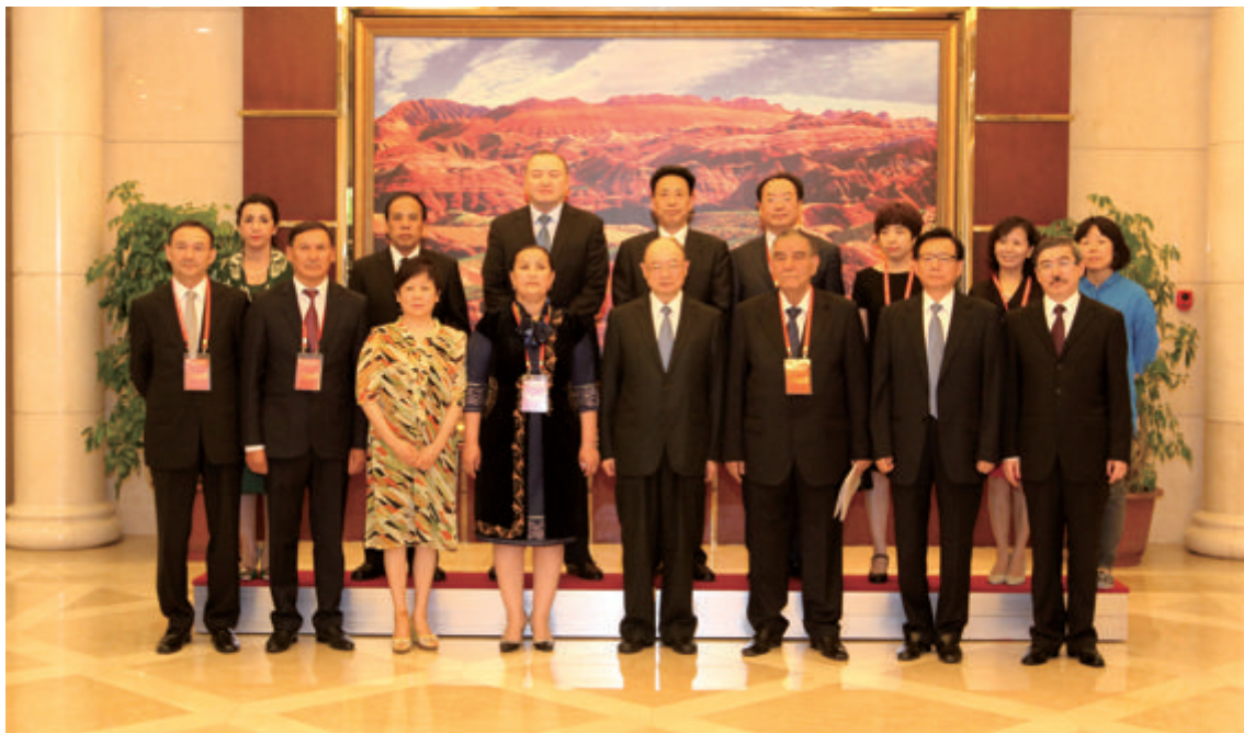
全国政协副主席陈元、中国人民对外友好协会会长李小林会见与会外宾代表

本届对话会在“第20届兰洽会”期间举办，中外嘉宾在出席对话会之余，参观了兰洽会主展馆和兰州等市，洽谈了具体合作，极大地丰富了对话会和兰洽会的内容，扩大了活动的规模和影响力，达成了更多务实成果。两项活动相得益彰，完美结合，更为务实，受到中外与会者的赞誉。■