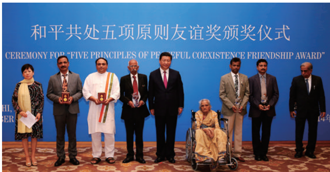
习近平主席为获奖组织代表和个人颁奖后合影