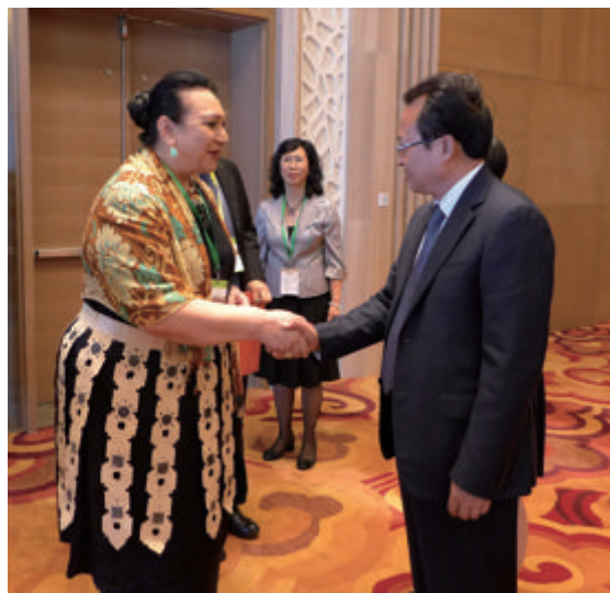
贵州省副省长蒙启良会见汤加公主皮洛莱乌

户思社副会长在致辞中表示，今年5月，全国友协刚刚与各国友人共同庆祝友协成立60周年。习近平主席出席庆祝大会，并在讲话中指出“人民友好是促进世界和平与发展的基础力量，是实现合作共赢的基本前提，相互信任、平等相待是开展合作、实现互利互惠的先决条件。”友好论坛正是践行这一理