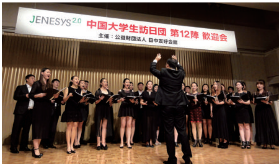
中央民族大学合唱团在欢迎宴会上表演合唱

魅力所带来的震撼。同学们倾听了来自柏林爱乐、维也纳爱乐的大师们所演绎的贝多芬、古诺、亨德尔和小约翰·施特劳斯的名曲，领略了专家们的精湛技艺。同学们纷纷表示参加 PMF 音乐节的开幕式令他们拓宽了视野，能与世界顶级艺术家近距离交流，也更好地提高了自身的专业素养。