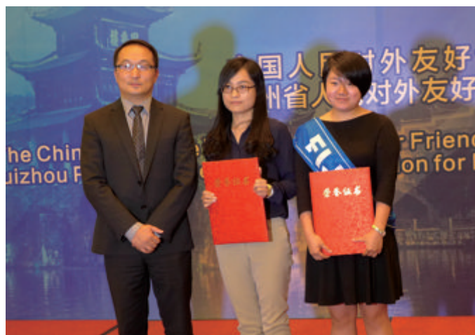
全国友协为赴美国、斐济和危地马拉执行友好帮扶活动的志愿者颁发荣誉证书

会上，全国友协还为赴美国、斐济和危地马拉执行友好帮扶活动的3批志愿者颁发荣誉证书，授予全国友协友好志愿者称号，以表彰他们在巩固接收国对华友好民意基础，推动当地社会各项事业取得进步作出的贡献。■