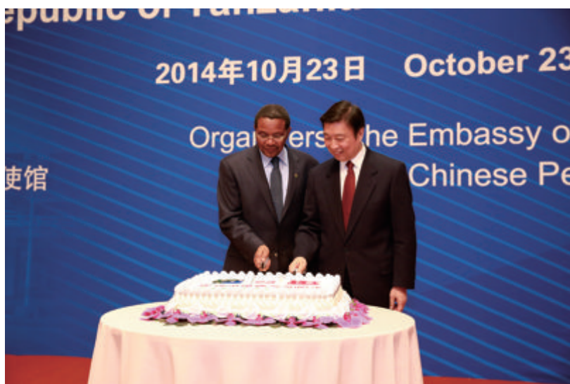
李源潮副主席和基奎特总统共切庆祝蛋糕

基奎特总统说，坦中传统友谊是两国老一辈领导人共同缔造和培育的。坦中长期友好，相互坚定支持，希望双方全面拓展各领域合作。他还特别提到了随团来访并出席招待会的中国人民的老朋友萨利姆，称他为坦中人民的友好使者。1969年萨利姆出任坦桑尼亚驻中国大使。1970年至1980年，任坦桑尼亚驻联合国代表。1971年底，第26届联合国大会宣布恢复中华人民共和国在联合国合法席位，萨利姆起到了非常重要的作用。为此，他赢得了中国人民的尊敬。从联合国返回非洲的萨利姆自1984年开始担任坦桑尼