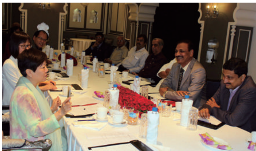
全国友协会长李小林与获奖印度友人在一起

动,为增进双方了解与互信、巩固中印人民友谊发挥了积极作用。中印是邻国,在2000年的交往中出现过许多动人事迹,说明友好有很悠久的历史。中印是世界上人口最多的大国,中印友好合作符合两国的利益。李小林表示,作为中国历史最悠久的民间团体,全国友协愿继续与大家合作,增进中印友好,为进一步发展中印关系作出贡献。■