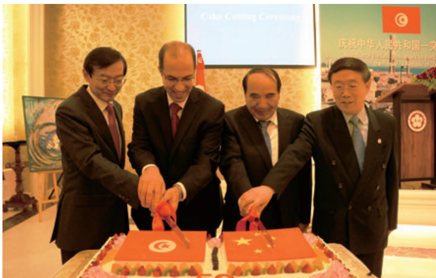
左起：外交部副部长张明、突尼斯驻华大使塔雷克·阿姆里、中非友协会长阿不来提·阿不都热西提、全国友协副会长冯佐库在庆祝中国与突尼斯建交 50 周年招待会上切蛋糕

经过细心筹备，全国友协与突尼斯驻华使馆于 2014 年 3 月 20 日在全国友协和平宫联合举行招待会，庆祝中国与突尼斯建交 50 周年、突尼斯独立 58 周年。第十一届全国政协副主席、中国非洲人民友好协会