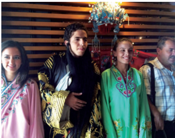
突尼斯青年代表团成员试穿京剧服饰

苏斯市是突尼斯的第三大城市，位于突尼斯东部海滨，已被联合国教科文组织列入世界遗产名录，是世界著名旅游城市。为进一步推动中突城市间的相互了解与交往，经全国友协推荐，泉州市副市长陈荣洲和苏斯市市长默罕默德·穆卡尼在论坛期间共同签订了建立友好城市关系的合作意向书，将开展经贸、科技、文化、旅游、体育、卫生、教育、人才等领域的交流与合作，以推动两市的共同发展与繁荣。