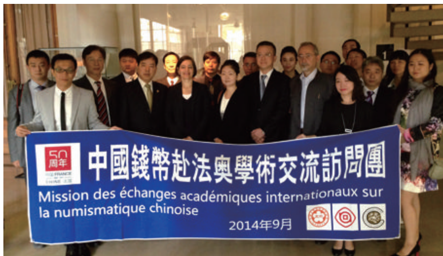
代表团与中国民俗钱币专家学者在法国国家图书馆币章部参观时合影

与奥地利国家造币局举行座谈是此次访问的另一项重要交流活动。奥地利造币局是欧洲仍在运行的造币厂中最古老的一家，距今已有 800 多年历史，是奥地利唯一的国家造币厂，始终以技艺精湛著称于同行。奥地利国家造币局负责人介绍了造币厂的历史，并展示所生产的精美纪念币。除了铸造传统的金银币外，造币局还生产贵金属彩色纪念币，众所周知的维也纳爱乐乐团金银币系列就出自该厂。近年新开发了哈布斯堡王朝皇冠系列金币、欧洲传说系列银币以及今年新推出的史前生物系列，均深受藏家的喜爱。■