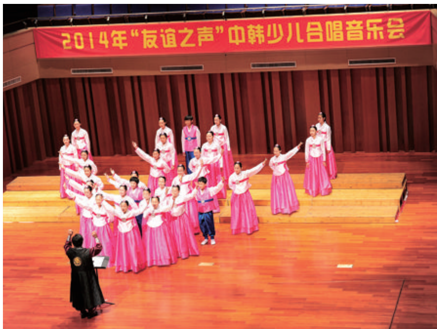
2014年昌原市合唱团在马鞍山市演出

13年后的这个夏天，作为两市缔结友城20周年的系列庆祝活动之一，7月21日至24日，昌原市的少年合唱团一行37人前来马鞍山市访问，与少年合唱团的小朋友们进行了交流。7月22日，两市合唱团百余名团员在市大剧院联袂演出，为市民们献上了一场东方文化的视听盛宴。韩国孩子们身着传统韩国服饰，用优美的歌声带领大家沉醉于韩国特色的歌曲中；中国孩子们献上了特色各异的民乐、西洋乐等，让大家徜徉于不同风格的文化艺术中。中韩少年合唱的韩国歌曲《故