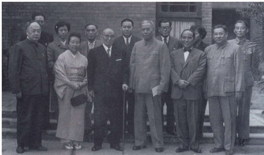
1959年9月，国家主席刘少奇（前排左4）、国务院副总理兼外长陈毅（前排左1）会见日本前首相石桥湛山及夫人。

1952年3月，为打开中日两国人民交往的渠道和开展民间贸易，周总理指示在莫斯科出席国际经济会议的中国代表团团长南汉宸邀请出席会议的三位日本国会议员高良富、帆足计和宫腰喜助访华。三位朋友借赴丹麦、法国之机，绕道莫斯科来到中国，与中方签订了第一次