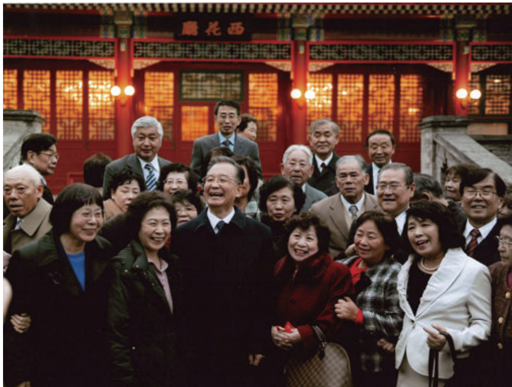
时任国务院总理温家宝带日本遗孤参观西花厅

中国人民养育之恩”访华团的团长，对那段痛苦的经历，她这样说：“回到日本以后，即使很想念养父母，也无法见面，甚至养父母生病都无法前去探望。这使我们这些遗孤被误解为忘恩负义，这是最令我们心痛的。”