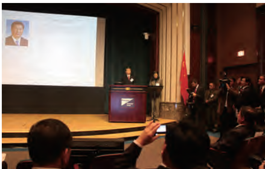
全国友协副会长谢元在两省州战略研讨会上宣读习近平主席贺信

两省州还共同组织了丰富多彩的纪念活动。我们的深刻体会是,从艾奥瓦州政府、议会到社会各阶层人士,处处充满热情和友好的气氛,和对美中友好合作的积极态度。为表彰艾奥瓦州友好人士多年来在促进中美民间交往方面作出的贡献,鼓励美国各界人士更加积极地投身于