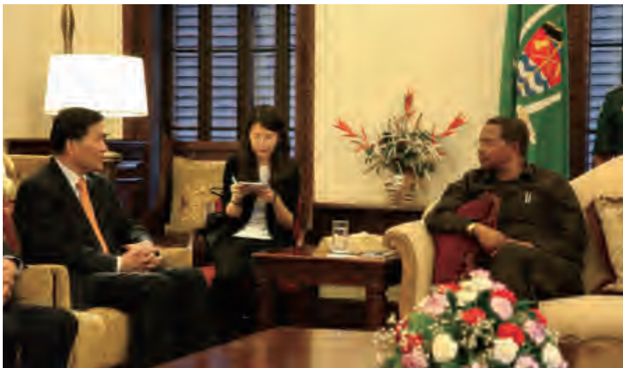
中国地方政府代表团拜会坦桑尼亚总统贾卡亚·姆里绍·基奎特

乌干达和坦桑尼亚两个东道主对远道而来的客人给予了高度重视和热情款待。11月21日，乌干达总统穆塞韦尼亲自出席“中国－东共体国家省市长对话”，与代表团团长夏耕、辽宁省副省长邴志刚、陕西省副省长王莉霞、全国政协副主席冯佐库、潍坊、烟台、四平、本溪、宝鸡等市领导及企业代表、驻乌中资机构代表