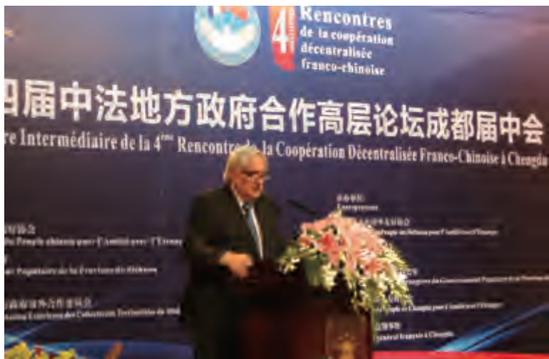
法国亚洲事务巡回大使瓦拉德致辞

由中国人民对外友好协会、四川省政府和法国外交部地方政府对外合作委员会、法国城市联盟共同主办的以“城市创新发展”为主题的第四届中法地方政府合作高层论坛届中会于2013年10月21日在成都举行。