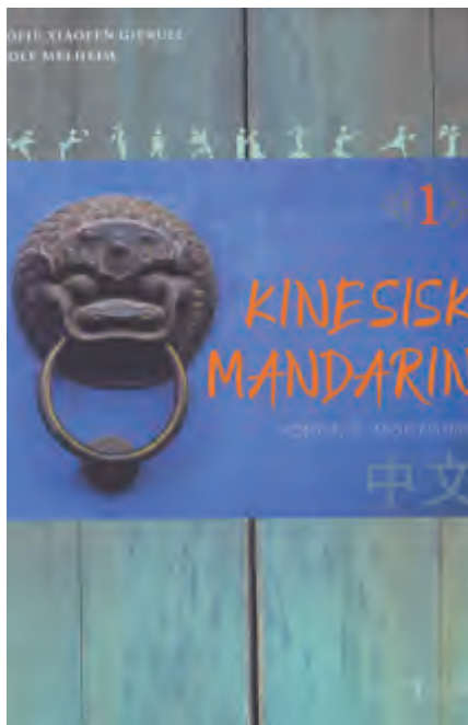
挪威语—汉语教材封面

我在 1976 年随一个挪威教师代表团第一次访问中国。我们乘坐跨西伯利亚火车，途经前苏联和蒙古，整整走了一个星期才到达中国。在北京火车站，中国人民对外友好协会的工作人员迎接了我们。尽管中国与富裕的西方国家相比，还十分贫穷，但是我们知道中国已从 20 世纪 40 年代的混乱中走出，情况已有了很大的改观。1976 年的春天，文化大革命还在进行。我们亲眼见到了 4 月 5 日发生在天安门广场上的大规模示威。然而，普通老百姓的生活似乎还是相当正常。我必须说，无论在北京还是在济南、青岛和上海，我们遇到的每一个中国人都是那么友好和开放，给我留下很深的印象。后来，我在北京语言学院和北京大学学中文。此后，我随挪威旅行团多次访问中国。我得说我与这个伟大的国家建立了坚固积极的关系。我认为当前在中国发生的一