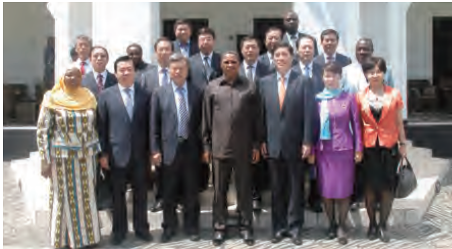
坦桑尼亚总统基奎特会见中方代表团

坦桑尼亚总统基奎特、总理平达在会见时表示，坦中友谊是由两国老一代领导人毛泽东主席和尼雷尔总统在上世纪60年代亲手缔造的，长期以来双方都为维护和发展这一友谊做出了巨大努力，坦方珍视这种兄弟般的传统友谊。相信此次对话会将为建立中坦地方政府合作平台、推进贸易投资和务实合作，真正实现互利共赢作出贡献。平达总理还对其不久前访华受到的热情接待表示感谢。他说，自1964年建交以来，不论国际政治、经济形势如何变化，双边关系不断发展，现在已经成为全天候的朋友。近年来，两国领导人高层互访不断，习近平主席在3月访坦时介绍了13亿中国人民实现国家复兴的中国梦，也提到10亿非洲人民要实现发展的梦想。习主席说要实现这些梦想，就要加强团结合作，相互支持和帮助。这不仅引起当地人民的共鸣，也引起了世界人民的关注。希望今后双方继续加强政治、经贸、文化等各领域务实合作，为坦中关系的深入发展作更大贡献。■