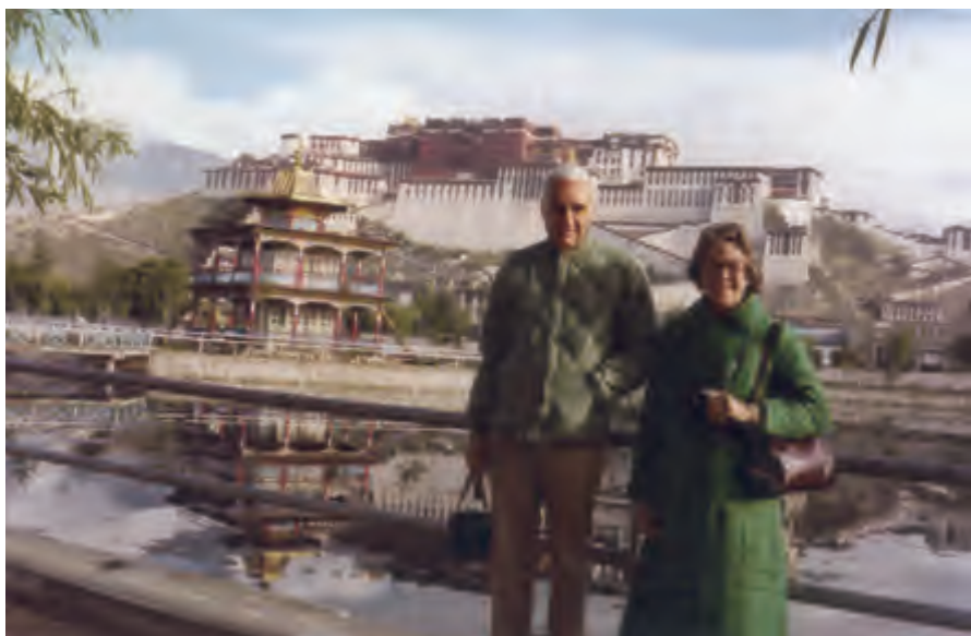
戴蒙德大夫夫妇在西藏刚刚对外开放时访问拉萨