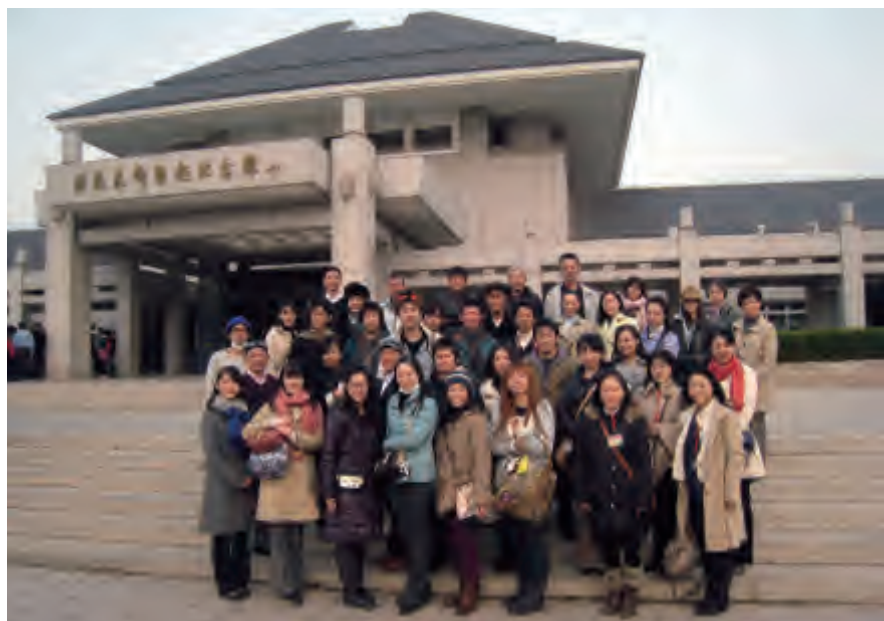
民音艺术团参观天津周恩来邓颖超纪念馆

和音乐把世界人民的心连在一起，今年是该协会成立50周年。1974年池田大作先生访问中国时，周恩来总理指出，今后中日要大力发展两国关系，嘱托池田先生多做工作，把两国人民的心连在一起。第二年民音便与中国开始了交流。39年来，民音邀请了40多个中国文化艺术团体访问演出，有超过300万人次的日本民众得以接触到中国文化，让民众喜欢上中国的努力一直没有间断。今年开始，民音将通过向中国人展示日本文化的方式，希望以文化交流为起点，为两国间各领域的交流提供基础。