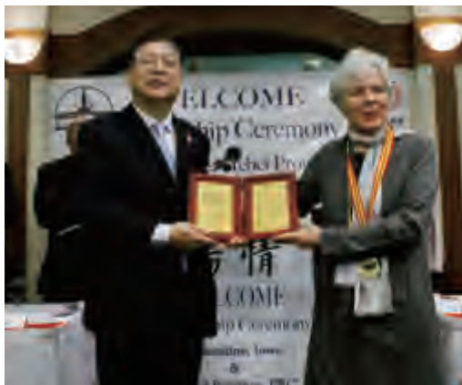
全国友协副会长谢元为萨拉·兰蒂女士颁发“人民友好使者”荣誉奖章和证书

新能源、科技等领域,总投资额达15亿美元。双方还在商贸、旅游、教育、友好市县等领域进行了专业交流,举办了农业可持续发展论坛暨农业项目对口洽谈会、河北旅游推介周等系列活动,进一步深化了两省州之间的交流和务实合作。