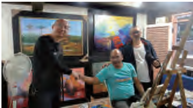
与瓜亚基尔的画家交谈

岛起源、天坑特有植被等相关信息。加拉帕格斯群岛的独特魅力，让中国画家流连忘返，尤其是对于绘画而言，这是一个天然的素材宝库。