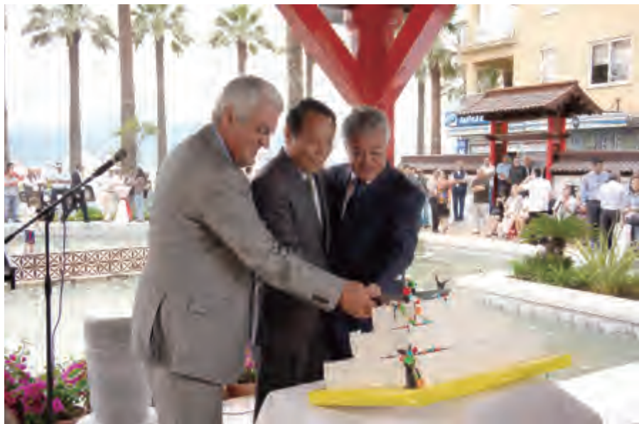
左起：土耳其中央政府驻马尔马里斯总督察奥斯曼·谷润、济南市人大常委会副主任邹世平、马尔马里斯市长阿里·阿卡在“济南园”开园仪式上

2009年，济南市举办中国（济南）国际园林花卉博览会，期间恰逢土耳其的斋月节，尽管这是穆斯林家庭团聚的节日，伊斯迈特还是坚持来到济南，参加此次盛会。园博会开幕期间，“马尔马里斯园”以其精湛的设计获得了“优秀展园