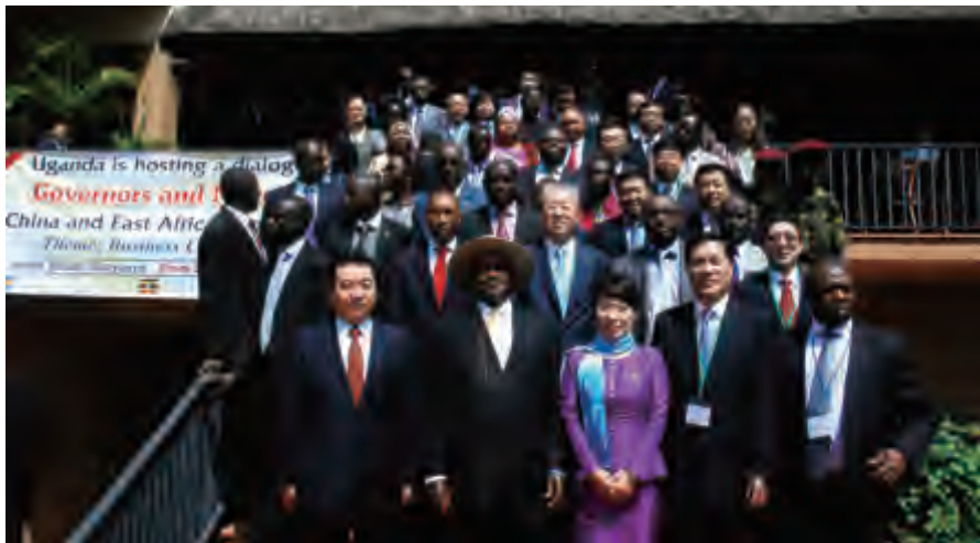
乌干达总统穆塞维尼与与会中非贵宾合影

中国—东非共同体省市市长对话会 11月21日,中国—东非共同体国家省市市长对话会在乌干达首都坎帕拉举行。乌干达总统穆塞维尼、副总统塞坎迪、东非共同体国家地方政府部部长及中非双方官员和企业家共260余人与会。穆塞维尼总统在开幕式主旨发言中对中国地方政府代表团表示欢迎,对中国—东非共同体省市市长对话会召开表示祝贺。他说,新中国成