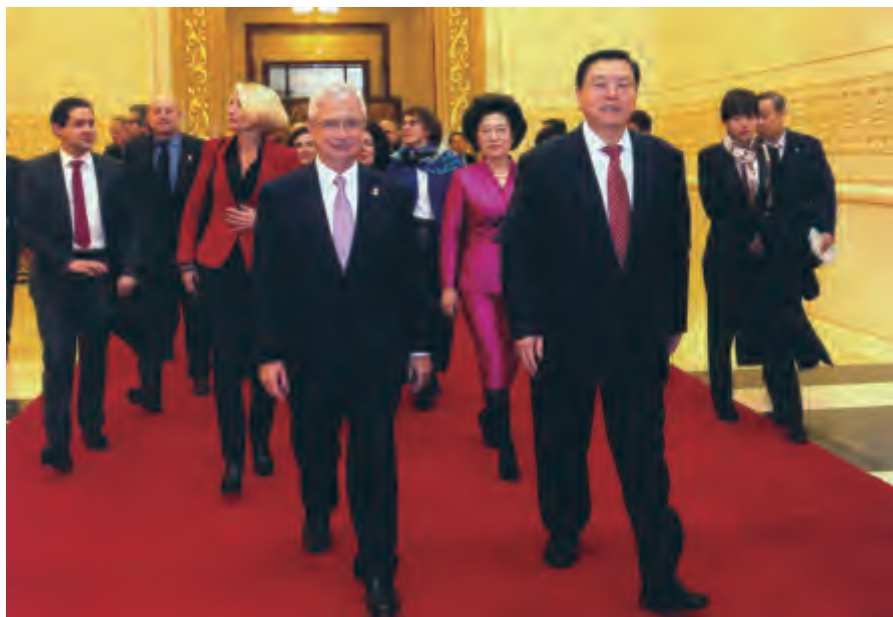
全国人大常委会委员长张德江与法国国民议会议长巴尔托洛内步入招待会会场

张德江强调，中法深化全面战略伙伴关系面临新的机遇。正如习近平主席在与奥朗德总统会谈时指出的，新形势下，中法要继续做优