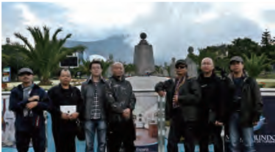
中国画家代表团在赤道纪念碑前

10日，经过两个小时太平洋飞行和严格的环境消毒检查，画家们怀着激动的心情抵达声名远扬的厄