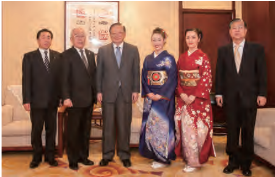
中日友协会长唐家璇（左3）会见艺术团主要成员

同时，唐会长对中日两国的民间文艺交流提出了殷切希望。他指出：“由于众所周知的原因，中日关系目前陷入低谷。越是困难的时候，中日双方民间团体及文艺界越应更多交往，这将有助于中日关系恢复到正常发展轨道上来。古语讲‘国之交，在于民相亲’，由于一些重大问题，导致两国政治关系出现困难，也影响了双方的社情和民意，形成隔阂。在这种情况下，民