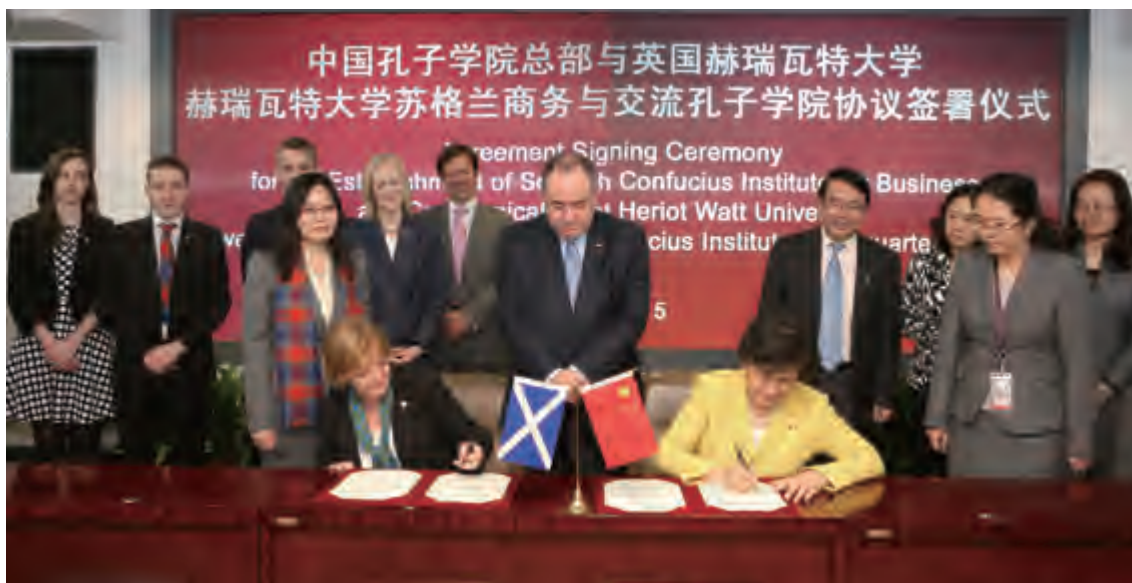
苏格兰首席部长萨蒙德见证中国孔子学院总部与英国赫瑞瓦特大学签署合作协议

下午4时30分，萨蒙德部长抵达首都机场，谢元副会长为他送行。萨蒙德部长短短3天的访问有助于加深中国与苏格兰地方政府相互了解，促进双方在政治、交通、金融、文化、教育等领域的深入合作。■