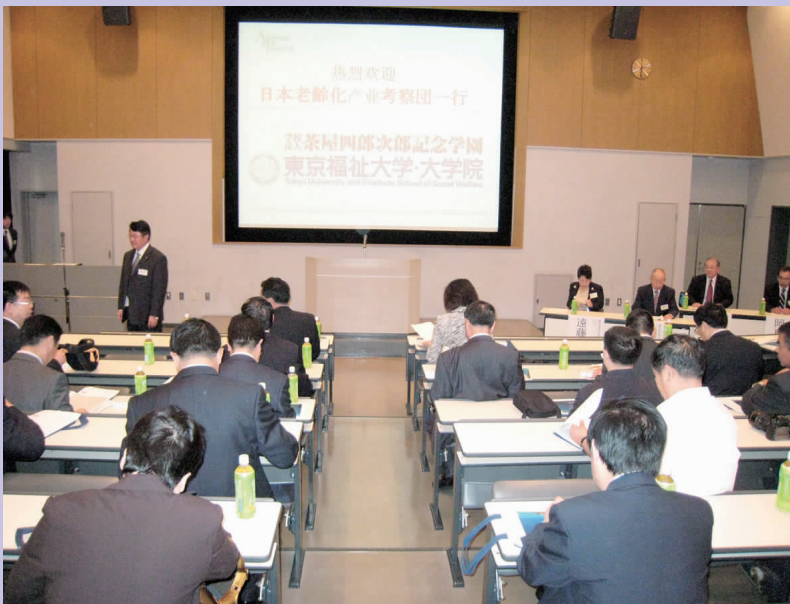
中国老龄事业考察团在东京福祉大学参观考察

日本护理保险制度从 2000 年开始实施,是一项强制性的保险制度。该保险制度规定:承保对象分为两种,一是 65 岁以上的人可以成为一等被保险人;二是加入医疗保险的 40 岁至 64 岁的人可以成为二等被保险人。被保险人可以享受的保险服务有:家访看护,清洁服务,家庭理疗,医务人员家访,全天看护,在看护设施内为被保险人提供当天的各项服务,痴呆病人的集体设施看护,自费老人设施内的看护,轮椅等医