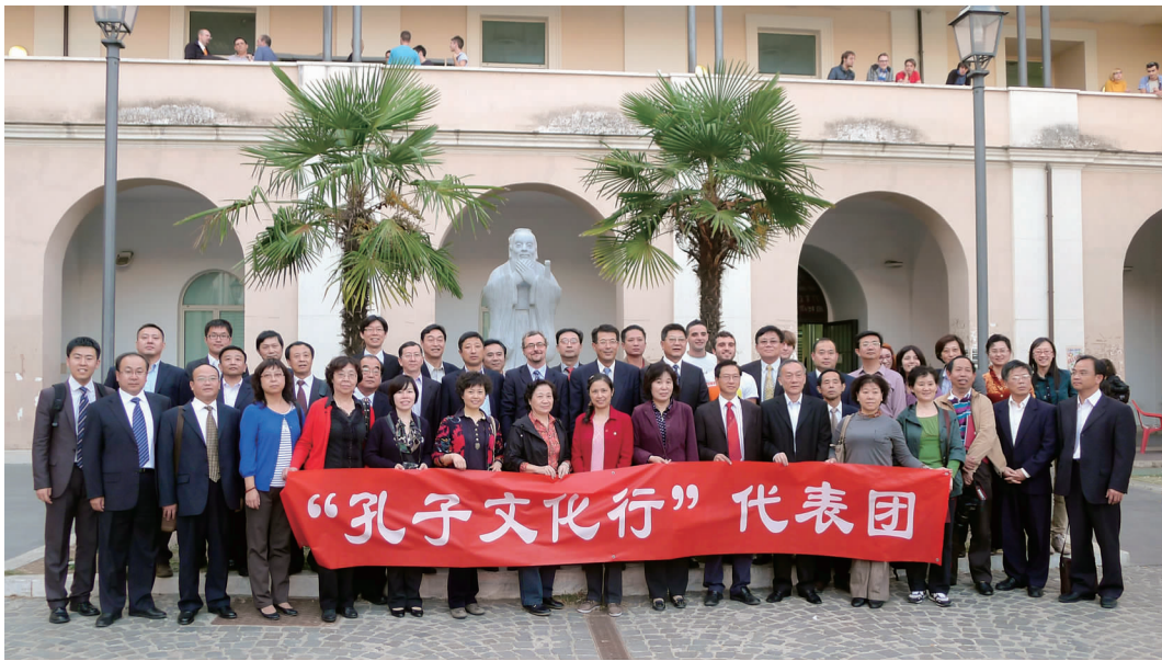
孔子文化行代表团在罗马大学孔子学院

发展作出了重要贡献。没有古希腊文化及罗马帝国所奠定的基础,也就没有现代的欧洲。同样,没有古老的中华文明也就没有现代的亚洲。希腊的苏格拉底、柏拉图、亚里士多德等与中国的老子、孔子、庄子等伟大的思想家曾共同引领世界文明走出蒙昧,向前发展。早在公元前数世纪,连接罗马和长安的古代丝绸之路开启了欧亚文明对话的先河。