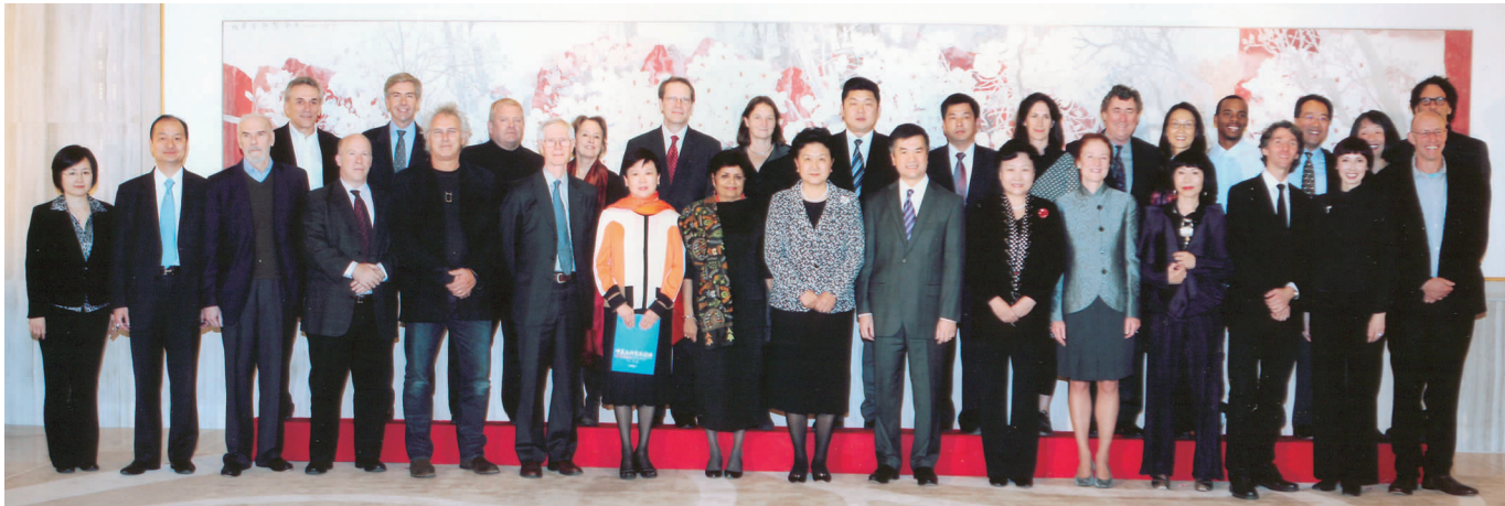
国务委员刘延东会见出席中美文化艺术论坛的美国文艺界代表团

马友友在谈个人成长之路时说,他首先想成为一个人,其次想成为一个音乐家,最后想成为一名大提琴家。他从小对周围的世