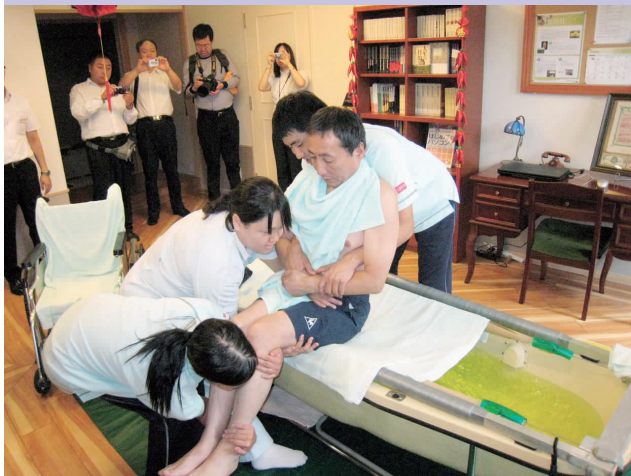
代表团参观日本为行动不便的人提供家庭洗澡服务

他山之石，可以攻玉。目前我国老龄人口的增长快于人口增长，此访为代表团成员提供了一个学习和借鉴国外成功经验的好机会。■