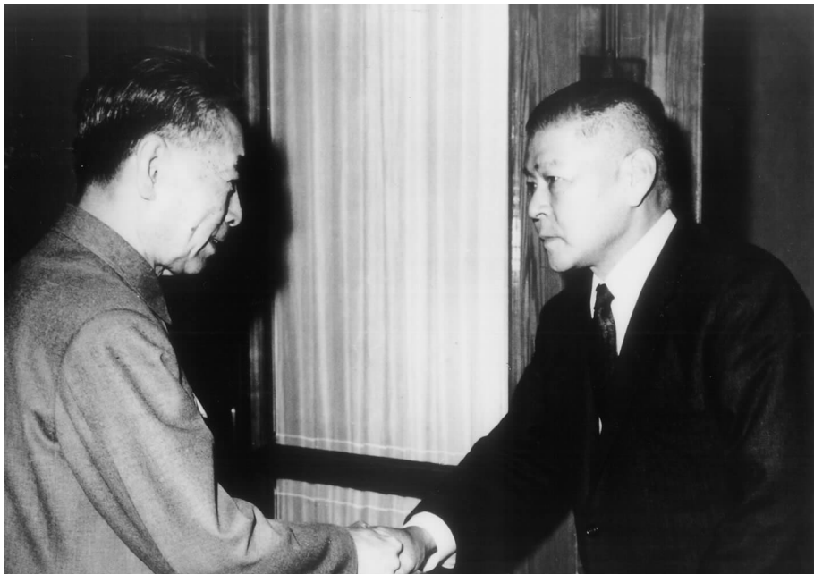
周总理会见后藤钾二

会上还举行了《乒乓外交的回忆》赠书仪式和中日友好交流城市初中生乒乓球友谊比赛大会签字仪式。中日友好交流城市初中生乒乓球友谊比赛大会是中日友协、中国乒协及日中友协、日本乒协为纪念中日邦交正常化40周年而共同策划组织的大型友好交流活动,将于2012年8月中旬在北京举行。■