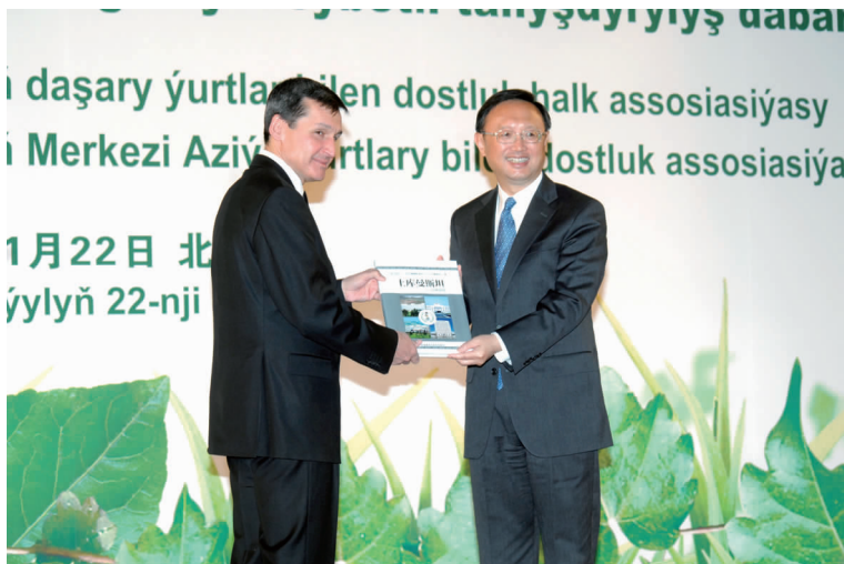
杨洁篪外长向梅列多夫副总理转交赠送土库曼斯坦总统的总统著作中译本

别尔德穆哈梅多夫总统的 3 本著作中文译本,分别介绍了土库曼斯坦丰富的药用植物、美丽的自然风光和著名的疗养胜地以及作为土库曼民族骄傲和荣耀的阿哈尔捷金马。