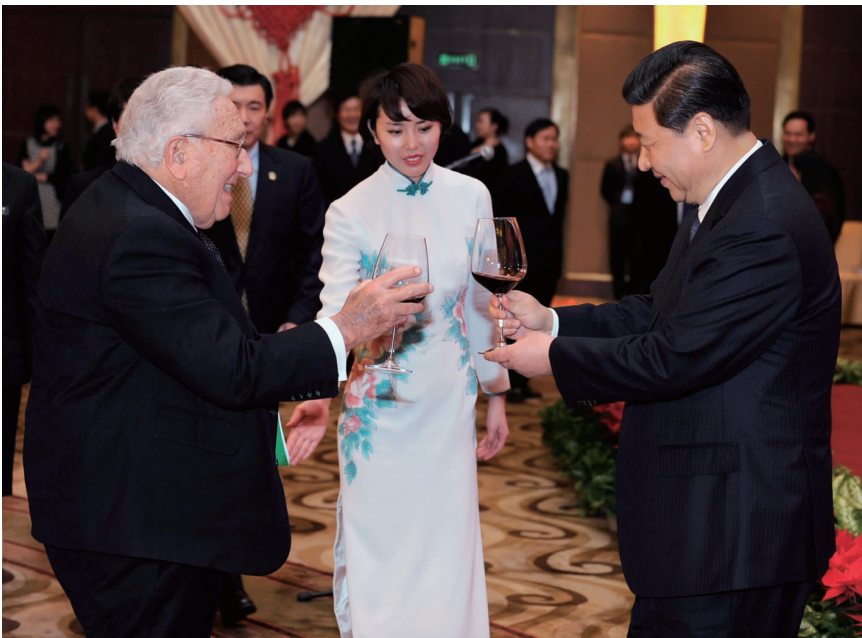
习近平副主席与基辛格在尼克松总统访华 40 周年纪念活动上

全国人大常委会副委员长路甬祥、韩启德,全国政协副主席董建华、张梅颖,全国人大常委会前副委员长成思危、顾秀莲,全国政协前副主席徐匡迪以及美国前国务卿舒尔茨等两国各界人士 200 多人共同出席了纪念活动。前国务委员唐家璇主持了纪念活动。■