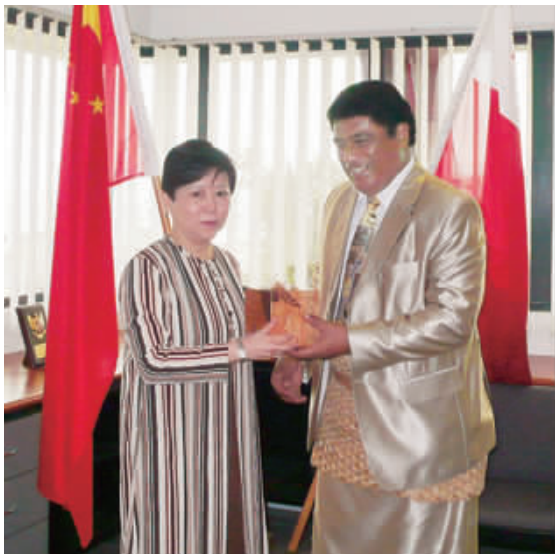
李小林副会长会见汤加首相图伊瓦卡诺