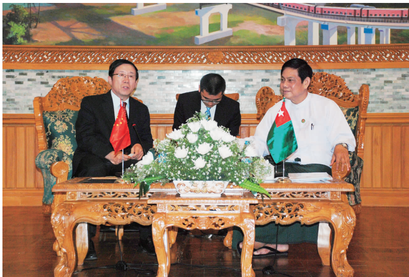
缅甸联邦巩固与发展党总书记吴泰乌会见中缅友协会长冯佐库

举办中缅友好之夜晚会,与缅甸各界人士广泛接触。8月22日晚,代表团以中缅友协名义在仰光举办“中缅友好之夜”招待会,邀请缅甸各界友好人士近200人出席。仰光省行政长官吴敏瑞、仰光市市长吴拉敏及仰光省各职能部门主要负责人出席了招待会。招待会上,中缅两国各界人士畅谈友谊,来自中国的艺术家进行了文艺表演,场面热烈、气氛友好。■