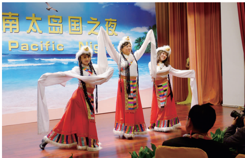
对外友协会长李小林等表演藏族舞

中国人民对外友好协会会长李小林在致词中说,作为全国性民间友好组织,中国人民对外友好协会一直致力于增进中国人民与包括南太岛国在内的世界各国人民之间的了解和友谊,过去的一年中开展了形式多样的友好交流活动。民间外交的宗旨,就是促进人民友谊,维护世界和平,让世