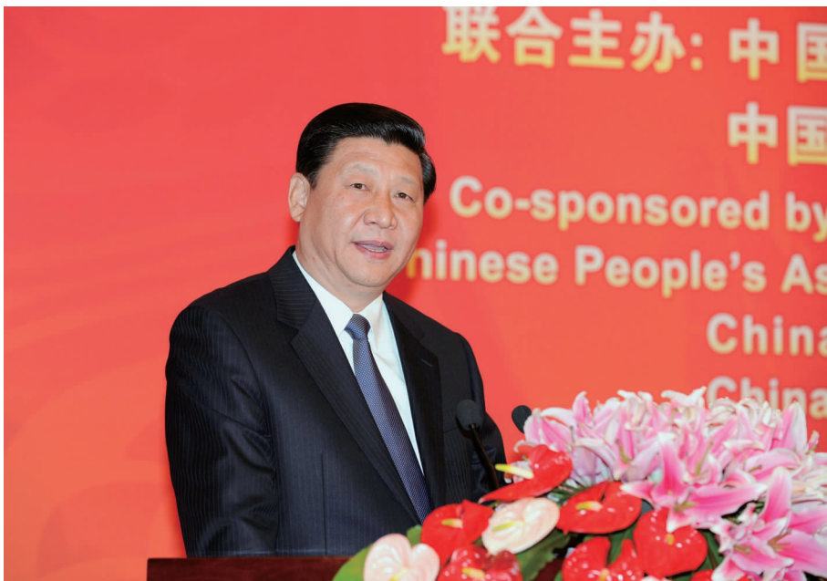
习近平副主席在纪念尼克松总统访华 40 周年活动上致词

习近平说,在新的形势下,我们要按照胡锦涛主席和奥巴马总统达成的重要共识,坚定不移地建设相互尊重、互利共赢的中美合作伙伴关系。我们要以更加长远的战略眼光来审视和处理中美关系的未来,始终从两国人民的根本利益出发,尊重彼此核心和重要利益,妥善处理分歧,牢牢把握中美关系的正确方向。我们要以更加频繁、密切的方式加强两国高层和各层级的接触,完善各种对话合作机制,增进双方的战略互信。我们要本着互利共赢的精神,以更加务实、有效的方式推进经贸各领域合作。我们要以更加重视彼此利益和关切的方式加强在国际地区问题上的合作。我们要以更加灵活、多样的方式促进中美社会各界友好交流。