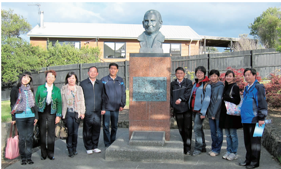
路易·艾黎公园里的艾黎塑像

* 路易·艾黎，新西兰人，1927年 前往中国，与中国人民风雨同舟，为中国人民的解放和建设事业奋斗了整整60年。20世纪30年代，路易·艾黎积极参加了在上海的国际性的马列主义学习小组，并向国外撰写了大量宣传中国人民抗日战争的文章。抗日战争时期，他积极参加并发起组织了工业合作社运动，成为失业工人和难民生产自救、支援抗战而兴起的一支独特的经济力量。新中国成立后，路易·艾黎致力于维护世界和平与各国人民友好事业，为发展中国人民同新西兰及各国人民间的友谊作出了重要贡献。