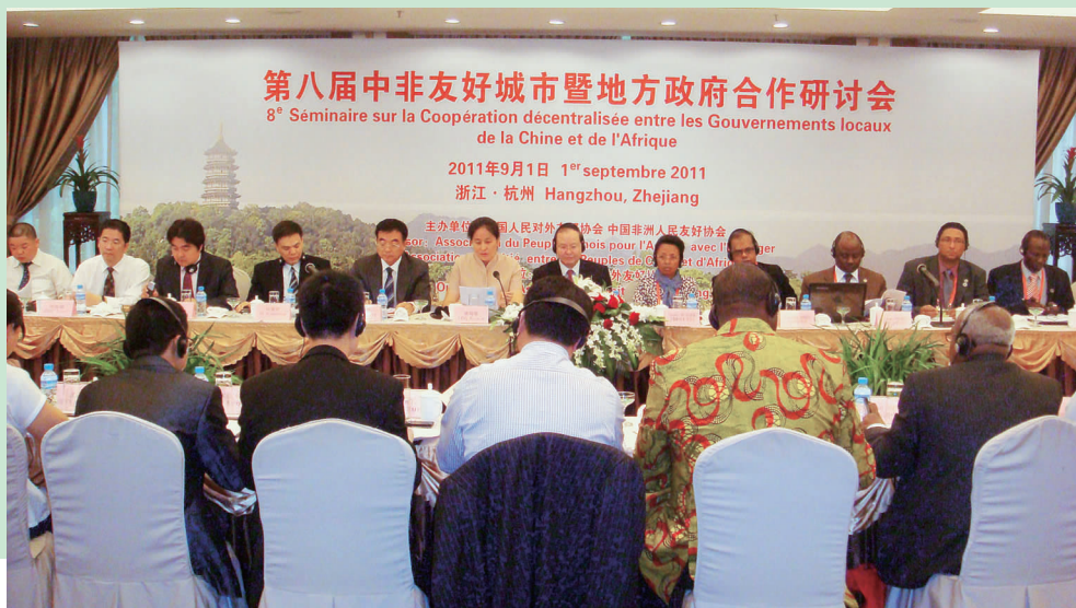
研修班学员出席在杭州市举办的地方政府合作研讨会

研修班学员还参观了义乌国际商贸城,特别是非洲产品展销中心,目前已有20多个非洲国家