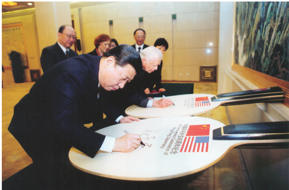
习近平副主席和美国前总统卡特在乒乓球拍上签名