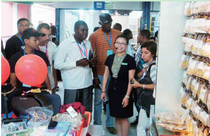
研修班学员参观义乌小商品城