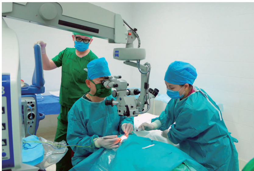
中国医生在为老挝患者做手术

和中老友协向老挝眼科医院赠送了眼科医疗设备 A 超机一台。他强调：“国与国的友好归根到底是人民之间的友好，人民之间的相互了解和感情对于两国关系十分重要。我们举办这类惠民活动，目的就是为两国人民提供增进感情的平台，同时为建交 50 周年献礼。”老中友协副会长肯玛尼·奔舍那说，此次“光明行”活动意义重大，既是建交活动的一个亮点，又为普通百姓带来实惠，让他们深深感受到了中国人民的友好情谊。一位 75 岁的患者对中国医护人员说：“听说中国最好的眼科医生要来为我们做手术，我非常激动。家人陪我从南部来到万象，没想到这么大年纪还能重见光明，我们会永远记得是中国医生为我们治好了眼睛。”