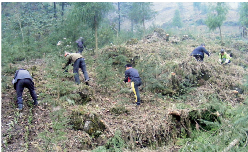
安县地震恢复项目种植柳杉

从2000年开始,四川省友协联同有关方实施了为期6年的简阳市丹景山中日友谊林造林绿化工程和简阳市沱江流域绿化造林工程项目,通过日中绿化交流基金为项目拨款3450万日元,分别在丹景山种植各类苗木57万多株,绿化面积144.2公顷,在沱江河流域种植各类苗木42万多株,绿化造林154公顷,使昔日荒草丛生、水土流失严重的丹景山变成了郁郁葱葱的中日友好公园,通过种植经济林木和果树,不仅保护和改善了沱江上游两岸的生