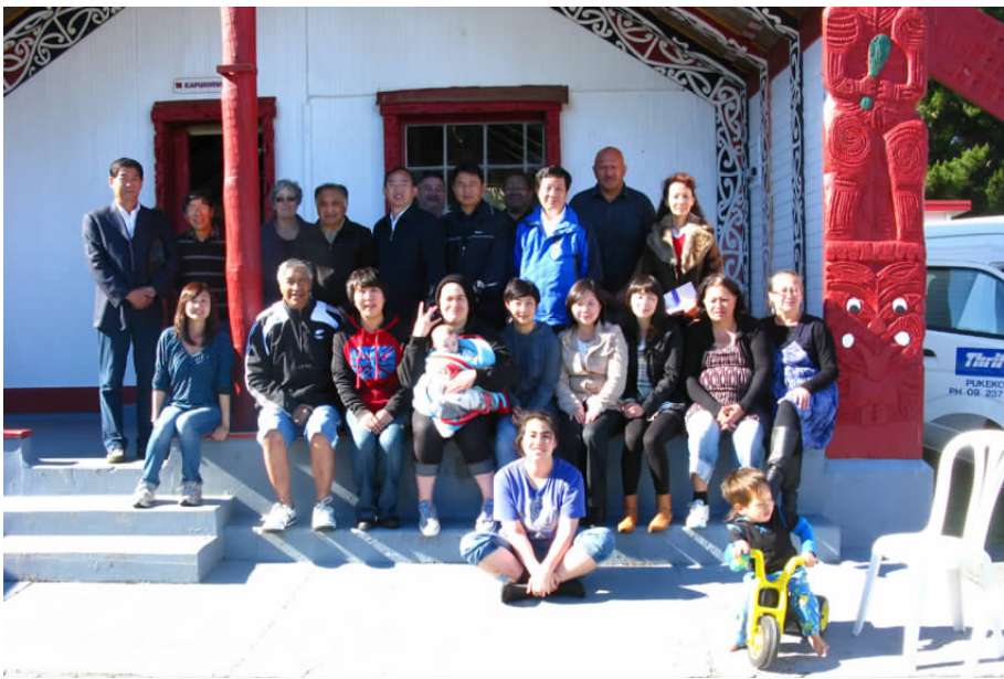
代表团与瓦伊德托克部落长老及毛利朋友在会堂前

毛利人对环境保护的重视和对文化传承的坚定态度令人敬佩。他们拥有富饶的土地、山川,