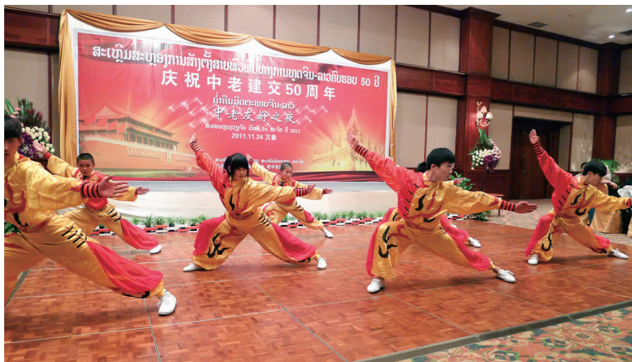
中老友好之夜武术表演

当晚，两国各界友好人士 120 人出席了中老友好之夜招待会，招待会上中老人民亲如一家的友好氛围，将本次系列庆祝活动推向高潮。青年武术代表团与老挝国家武术团在招待会上共同进行武术表演，既切磋了技艺，又增进了彼此的了解与友谊。■