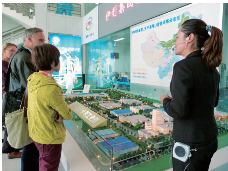
作者参观伊利公司

地处帝制时期的中国北部边疆,传统上蒙古为中华帝国提供骑兵部队。蒙古族按旗组织,分为贵族、喇嘛、牧民和农奴等阶层。