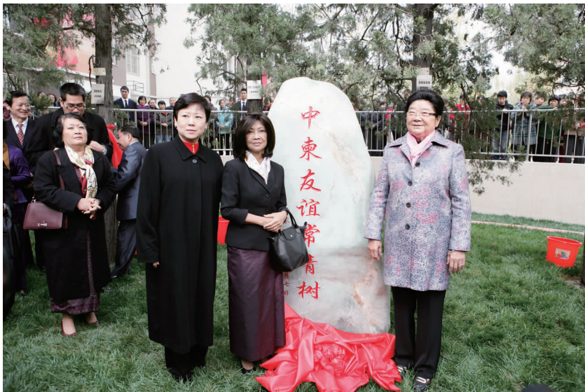
右起:顾秀莲、帕花黛薇、李小林为中柬友谊碑揭幕

40 年前栽下的象征中柬友谊的五棵常青树已从青青幼苗长成参天大树,成为中柬人民世代友好的历史见证。老一辈领导人为中柬友谊所倾注的心血、所体现的精神值得我们永远铭记。■