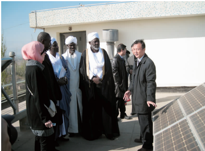
乍得代表团参观甘肃太阳能基地

对外友协与乍得民间交往已中断 20 年,通过乍得伊斯兰事务最高委员会主席谢依克·伊森的来访,友谊的纽带再次将中乍两国人民联系在一起,相信双方今后的交往将结出丰硕的果实。■