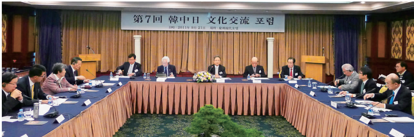
中日韩文化交流论坛会场

与会代表还欣赏了韩国的“非物质文化遗产”—板索里,并参观了两处世界文化遗产—庆州佛国寺和海印寺八万大藏经的藏经阁,学习到韩国在文化遗产保护方面的宝贵经验。■