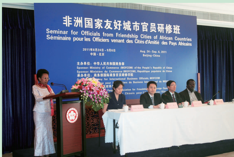
非洲国家友好城市研修班学员代表发言

2011年8月下旬,对外友协承办的非洲法语国家友好城市官员研修班23人在华度过了两周美好的时光。他们分别来自摩洛哥、刚果(布)、布隆迪、贝宁、毛里求斯、马里、科特迪瓦、多哥、乍得、马达加斯加和佛得角等11个国家。在北京,来自国务院发展研究中心、文化部、北京市规划委员会、北京市旅游发展委员会、中国传媒大学、清华大学、首都师范大学的专家和我会有关领导为学员们授课,内容涉及中国的区域经济发展、城市的基础设施规划、城市环境问题的治理、城市旅游发展战略、城市的国际艺术节和中国对非友好城市交往策略,受到学员们的赞赏和欢迎。学员们还赴浙江杭州、义乌和金华进行了为期一周的参观学习。在杭州举办了第八届中非友好城市暨地方政府合作研讨会,来自杭州市、宁