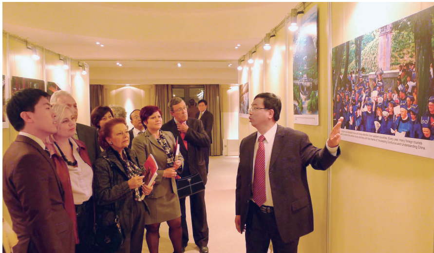
在希腊雅典帝国饭店会展中心举办的孔子文化图片展

中国民间艺术展。 作为此次系列文化活动之一的中国民间艺术展 10 月在瑞士苏黎世奥布里姆勒文化中心举办。展览选取了陕西华县的皮影、山东潍坊的年画和各地剪纸精品共 60 余幅。瑞士观众通过观看中国农村的草根艺术感受中国农村的乡土气息和文化生活,通过中国民俗专家对民间作品所包含的故事的介绍了解了其中的寓意,对中国民间艺术产生了浓厚的兴趣。■