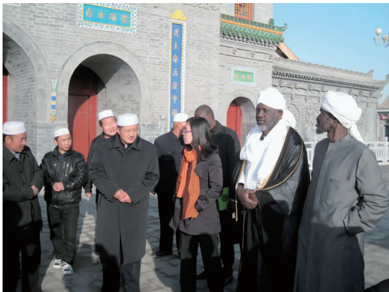
乍得伊斯兰事务最高委员会主席一行与中国的穆斯林在一起

谢依克·伊森主席是首次来华访问,随同访华的还有国家电视台的记者。伊森主席一行拜会了中国伊斯兰教协会和国家民族事务委员会,参观了北京牛街清真寺、宁夏纳家户清真寺、兰州市