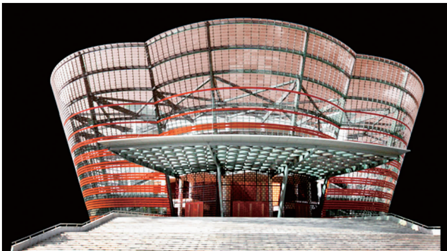
斯里兰卡莲花池马欣达·拉贾帕克萨剧院

我们希望在剧院举行的这类演出能很快对所有斯里兰卡人民开放，而且能让他们消费得起。尽管很多人通过那晚的电视实况转播和后来的重播看到了那场演出，但是人们还是须亲临剧院，才能体验现场演出呈现给人们的那种活力、震撼人心的视觉享受和美妙的音乐。演出是以两个舞剧开场。它们有效地利用了特技，在