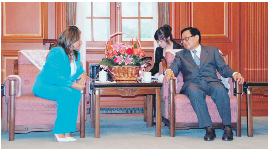
全国人大常委会副委员长华建敏会见塞拉诺主席

访华期间,塞拉诺目睹了北京、上海等大城市的发展成就;在宁夏国际投资贸易洽谈会上,了解到中国对外贸易和交往的情况;在宁夏回族金凤区良田移民镇普通农户的田间地头,看到中国农村建设、退耕还林政策、移民迁置规划和配套设施建设等解决三农问题措施的实施情况。中国社会经济的快速发展令