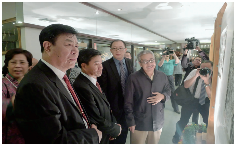
代表团参观中老友好画展

中老友好画展于 24 日在万象开幕，展出由 9 名中国画家精心创作的一批歌颂友谊与和平的优秀作品，吸引了两国艺术爱好者前去观赏。辛拉冯会长在开幕式致词中指出，老中民间交流正在向高层次、宽领域发展，画展为两国的文化艺术搭建平台，为两国人民心灵沟通建起桥梁。