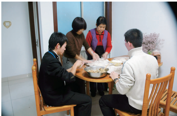
日本学生与中国学生及家人一起包饺子

12 月 10 日至 11 日本高中生与潍坊一中高中学生进行文化教育交流,并进行文艺联欢活动。潍坊一中的学生演出了丰富多彩的文艺节目,日本学生也跳起了他们的传统舞蹈一岩城舞,在跳的过程中,不断有中方学生加入,气氛非常热烈,使文化交流活动达