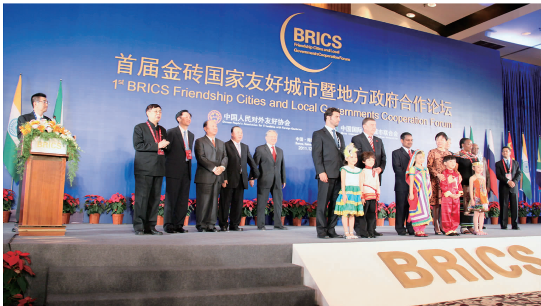
金砖国家友好城市论坛机制启动仪式