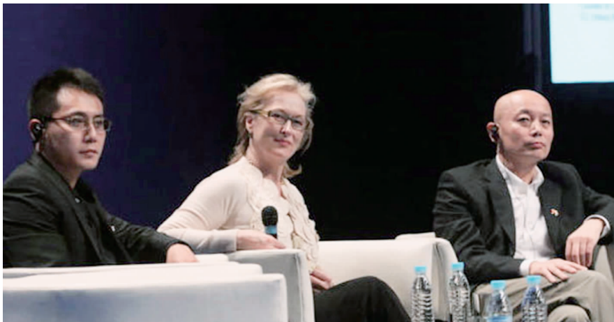
左起：刘烨、梅丽尔·斯特里普、葛优在论坛上

在讨论会、展映会和音乐会上，观众与嘉宾充分互动，气氛热烈，掌声与笑声不断，在交流中互相了解并相互欣赏。中美文化艺术论坛共吸引中外媒体 100 多家，观众 3000 余人。■