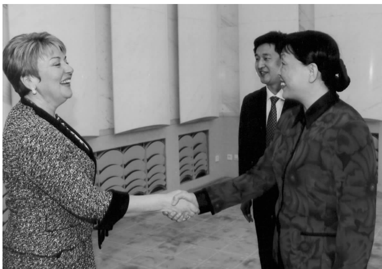
全国政协副主席张梅颖与俄罗斯国际科学文化合作中心主席米特罗法诺娃亲切握手

海南省三亚市副市长王诚安会见了米特罗法诺娃一行。双方一致认为,在三亚市举办俄语培训班,提高当地旅游从业人员俄语水平,将有助于吸引更多的俄罗斯游客。在三亚期间,外宾参观了海南大学三亚分院。□