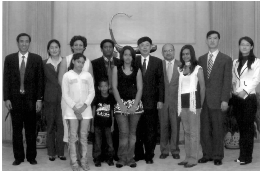
陈昊苏会长与塞舌尔财长丹尼·福尔一家在一起

在北京,丹尼·福尔财长还与中国进出口银行签署了购买中国飞机的优惠贷款协议,并与中国航空技术进出口总公司、中成进出口股份有限公司、华为技术有限公司等进行了接触。丹尼·福尔财长一家对访华非常满意,特别是孩子们对奥运福娃爱不释手,他们期盼着北京奥运的成功召开。□