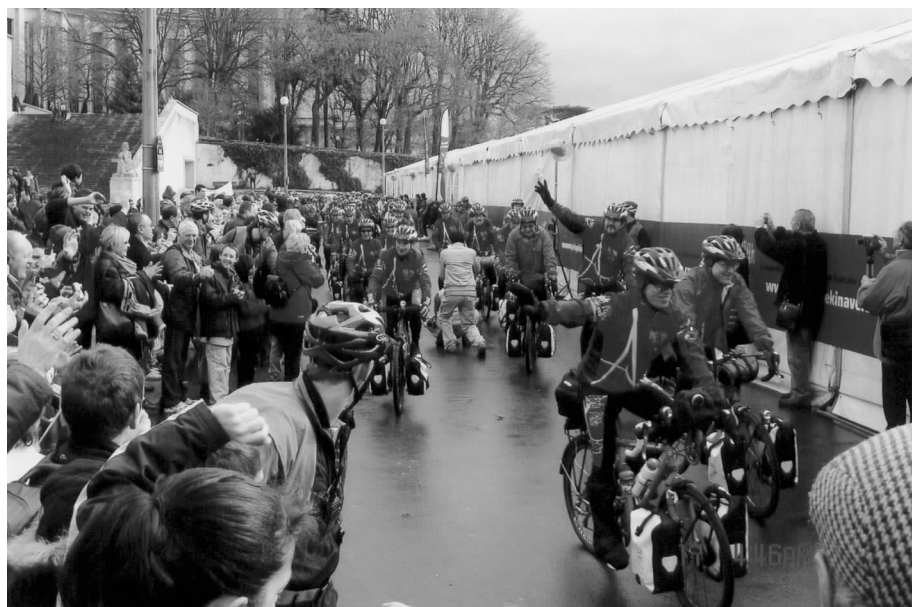
“巴黎—北京自行车 2008 梦想之旅”发车仪式在夏佑宫广场举行

法国地方政府合作委员会是由法国总理府牵头成立的协调与各国开展地方政府合作的中央咨询机构,其秘书处设在法国外交部。2007年11月,法国地方政府合作委员会与我会合作在波尔多成功举办了“第二届中法地方政府合作高层论坛”。我方就“第三届中法地方政府合作高层论坛”事宜与法国地方政府合作委员会秘书长安东尼一若里进行了工作会晤。□