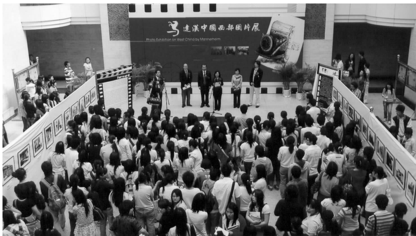
展览开幕式在西安外事学院教学大楼大厅举行

由对外友协和芬中协会、陕西省人民对外友好协会联合举办的“马达汉中国西部图片展”于5月13日至17日在西安外事学院展出。作为“马达汉中国西部图片展”系列展的第三站，西安展得到陕西省对外友协和西安外事学院的大力支持，师生的积极关注和一致好评。展览开幕式当日就有近千人前来参观。