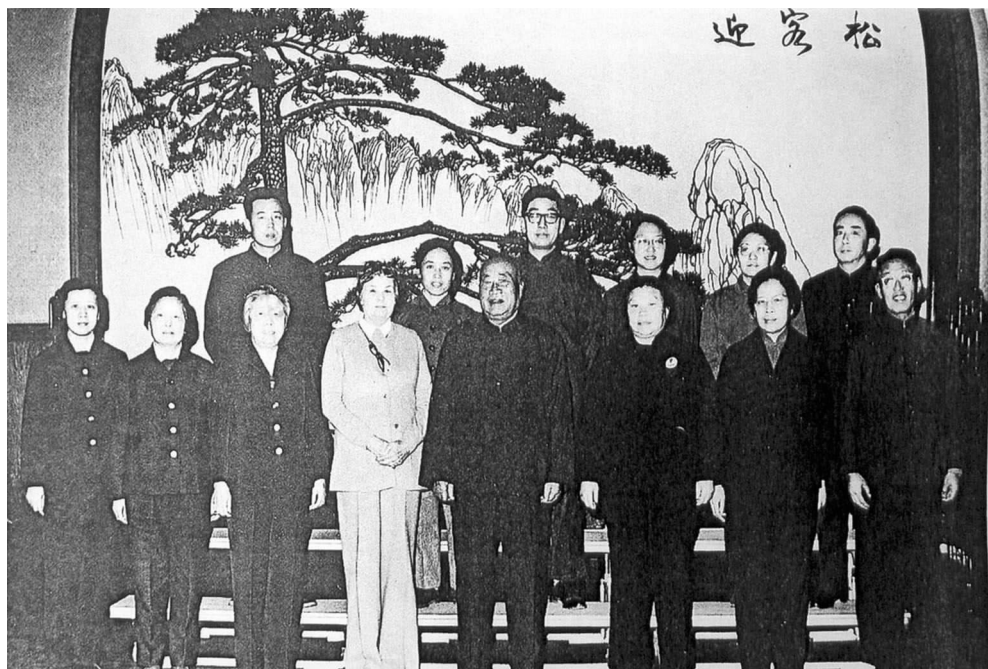
1972年，朱德、邓颖超、康克清接见海伦·斯诺（前排左4）

文，发表在斯诺故乡的《堪萨斯城星报》上；文中回忆了他们在中国的共同经历。她认为，埃德走得太早了，中美两国和人民之间的关系还有许多事情需要他去做呢！