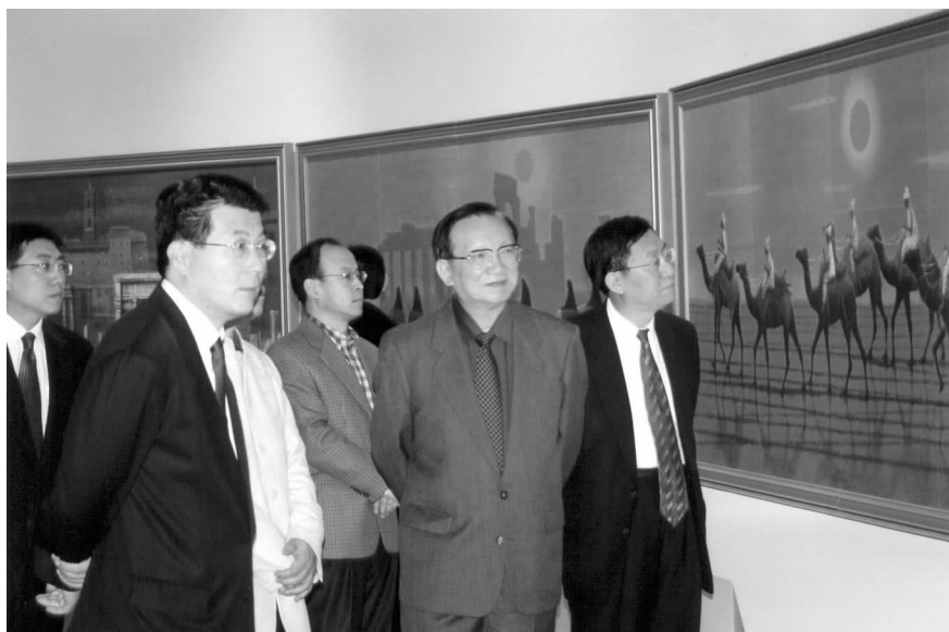
前国务委员唐家璇(右2)、对外友协副会长井顿泉(左2)参观于2008年4月在中国美术馆举办的“平山郁夫艺术展”