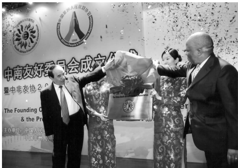
全国政协副主席阿不来提·阿不都热西提（左）与南非驻华大使倪清阁为中南友好委员会牌匾揭幕

前外交部副部长杨福昌，中非友协副会长冯佐库、王运泽、黄泽全及在京理事，部分非洲国家驻华使节，以及首都新闻界代表 100 余人出席了成立仪式。□