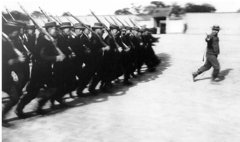
《西安的步兵在操练》

然风光。其中关于清末西安社会生活的有两幅，一幅是“西安的步兵在操练”，一幅是“居住在西安的西藏贝子杨中赉”。前者尤为珍贵，向观众展示了当时步兵已经装备了火枪的史实。师生们对这些老照片产生了极大的兴趣。新闻摄影专业的同学还认真翻拍老照片，以作学习研究之用。西安外事学院院长黄藤高度肯定这些图片的价值：“这次展览图文并茂，形象生动，真实反应了清末中国西部的自然人文景象，具有很高的历史和文化价值。不但为我们提供了一个从外国人视角看旧中国的独特角度，同时还让我们真切地领略到了伟大祖国的百年沧桑巨变。”陕西电视台等媒体对展览作了专题报道。□