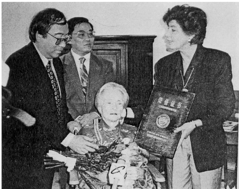
1991年,海伦·斯诺被授予“理解和友谊国际文学奖”

悲痛。海伦前往“毛主席纪念馆”瞻仰遗容时泣不成声。她说：“他是一位真正的伟人。他改变了中国，世界也因此变了样。”