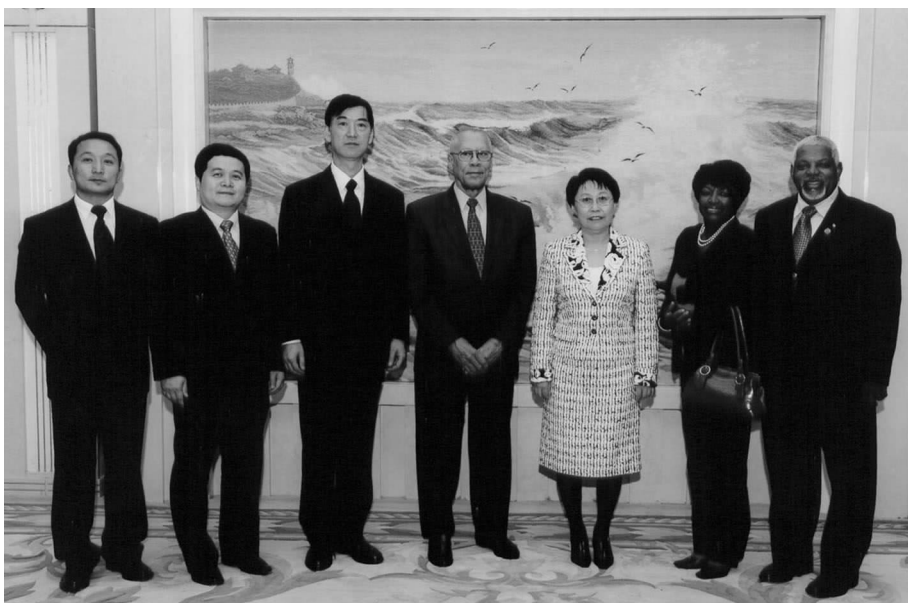
乌云其木格副委员长(左5)会见巴哈马副总督福克斯(左4)一行

福克斯曾在2004年参与创立巴哈马中国友好协会并担任副会长,此次访问时他表示希望巴中友协和对外友协加强合作,促进两国在学术、文化、教育等领域的交流。 □