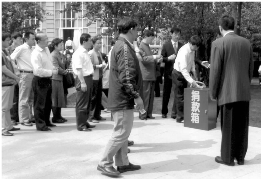
对外友协干部职工为四川地震灾区捐款

全体同志共同观看了中央电视台的“抗震救灾，众志成城”直播节目，14时28分，跟全国人民一起，对外友协全体同志默哀三分钟，七位青年干部代表走近钟亭，缓缓敲响钟声，汽车同时鸣笛。与此同时，北京市上空响起防空警报声。钟声、鸣笛