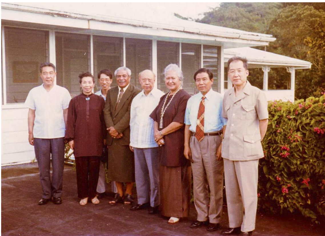
1981年5月王炳南会长率团访问新西兰（右起第四人为王炳南，右起第一人为作者）

炳南同志 1908 年生于陕西省乾县。1988 年在北京逝世，享年 80 岁。他曾在遗嘱中说过：“我死后，有人说声炳南是个好人，我就心满意足了。”认识他的人都会异口同声地称赞他确实是位好同志。