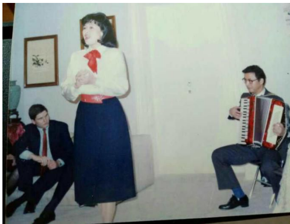
（笔者拉琴“妇唱夫随”）

第二次活动是在次年元月5日。老布什邀请韩叙大使夫妇和参赞杨洁篪夫妇到他官邸作客。在邀请中，他还特意提到：“别忘了请那对会唱歌的夫妇也到我家来，我和我家人都喜欢听他们唱歌”。美国副总统官邸离我们使馆不远，只有几个街区的距离。由于韩大使那天事前已安排重要活动难以更改，因此只有我们和杨洁篪夫妇驱车前往了。老布什夫妇居住在美国副总统官邸，而副总统办公地是在美国白宫西翼的西头。副总统官邸原是美国海军天文台一号楼，是一座白色外墙的两层建筑，建于1830年，