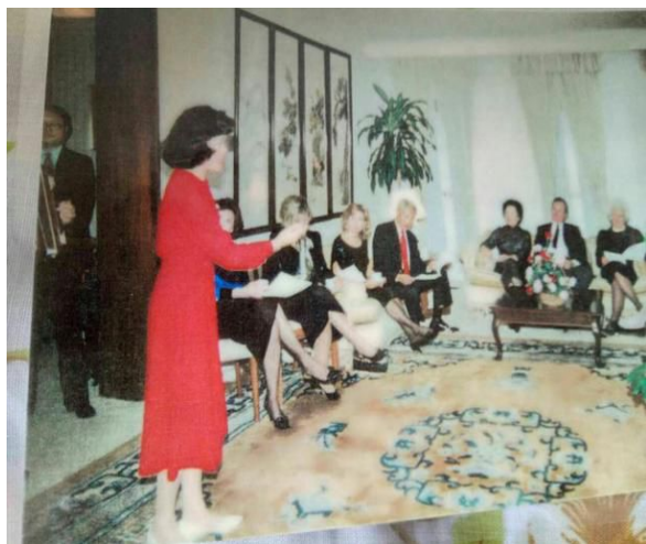
(笔者夫妇面向老布什夫妇唱)

1974年美国国会决定划归为副总统官邸。比起5100平方米的白宫，只有850平方米的副总统官邸要小得多。我们一行四人到了老布什家，先看到很大的大厅和壁炉。他邀我们参观了他的官邸，“你们参观参观我的住室吧”。美国副总统官邸并不像人们想象的那么豪华，那么富丽堂皇。令人印象深刻和感受到他对中国情感的是，卧室中有一个中国古董专柜，这些古董主要是他在中国担任驻华联络处主任时收集的。那天，老布什还邀请了其他几位美国高官和美国空军的一位女高音歌唱家。