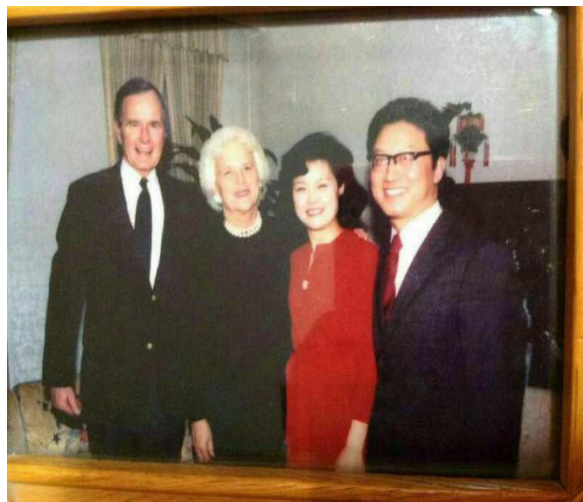
(老布什夫妇和笔者夫妇)

日的《人民日报》以“腊月欢聚韩家村”为题发了一篇特写，美国和海外报纸也作了报导。