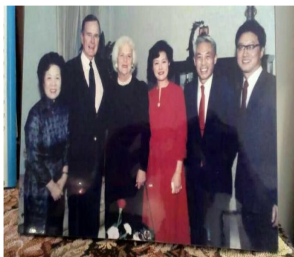
(老布什、韩叙大使和笔者夫妇)